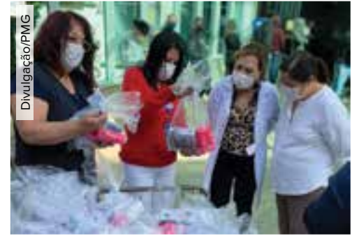
Pacientes da maternidade JJM recebem kits de higiene do Fundo Social