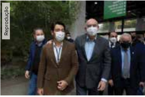
Guti recebe ministro da Educação em evento do MEC realizado em Guarulhos