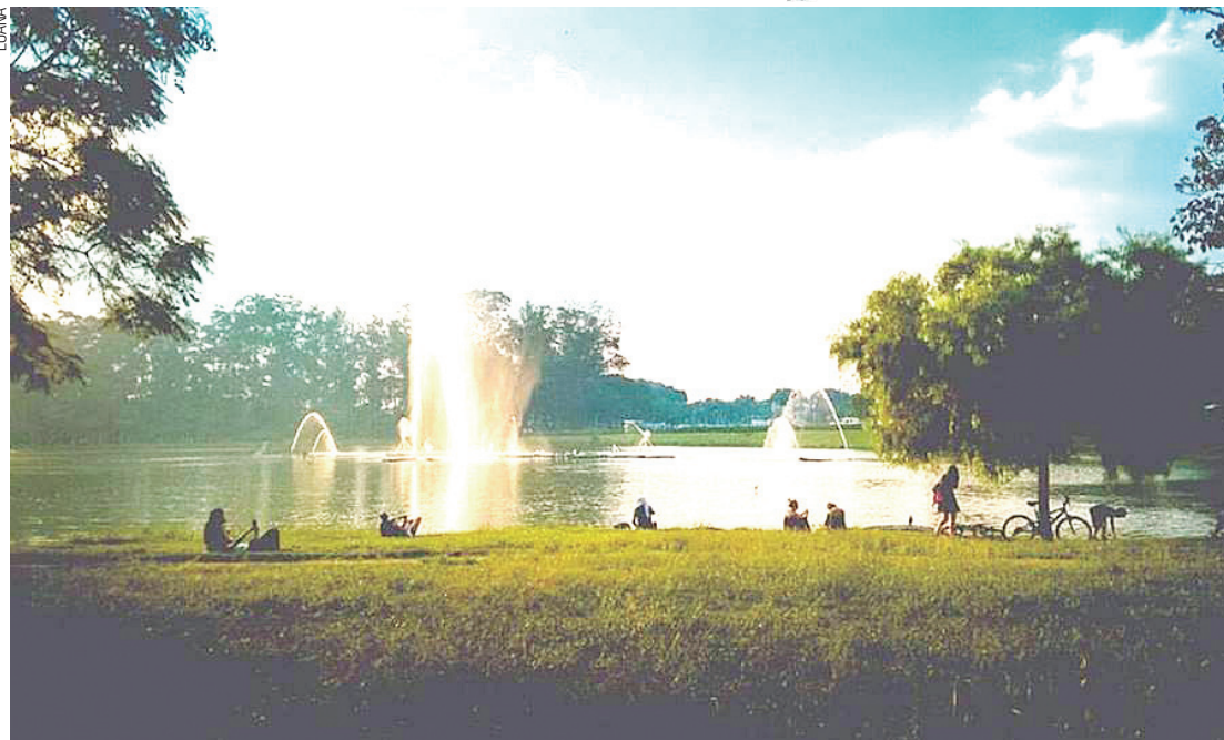
Para relaxar – Paulistanos aproveitam um bucólico final de tarde à beira do lago do Parque Ibirapuera

Caro leitor, envie sua foto para esta seção: 94021-9397 ou redacao@metronews.com.br