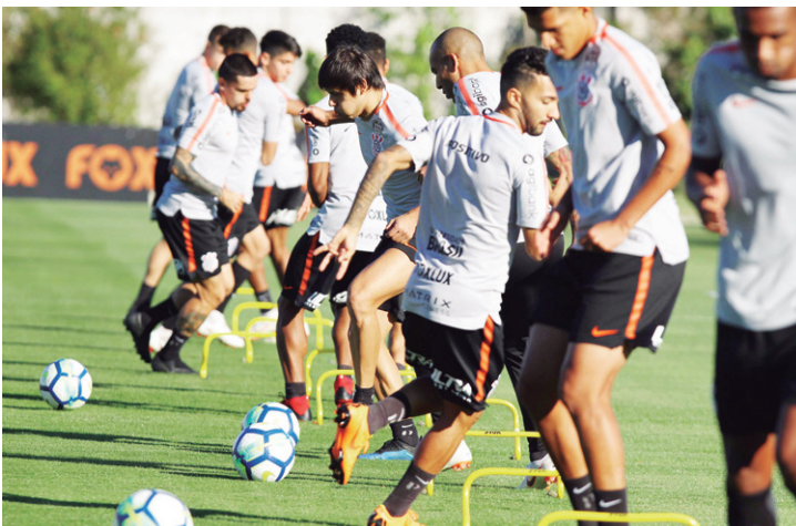
Focado – Derrotado no domingo, Timão terá força máxima amanhã