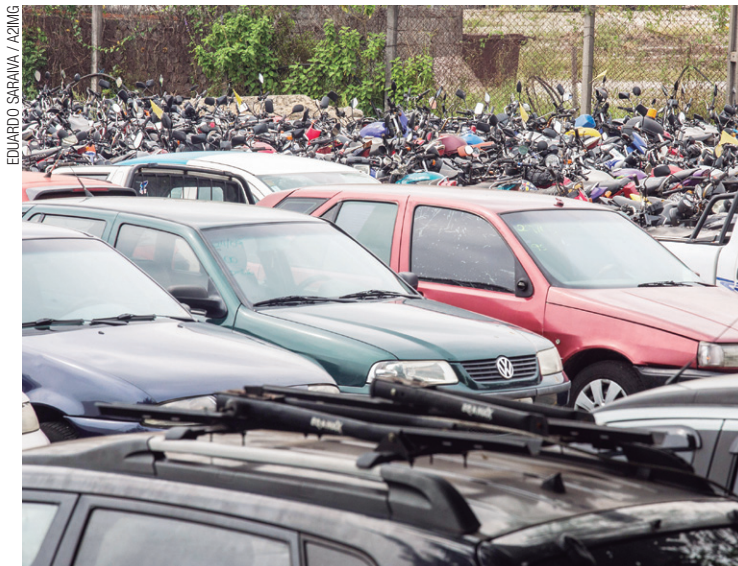
Apreendidos – Veículos ficam em pátios antes de serem levados a leilões

O trio opera as vendas por meio da plataforma Sumaré Leilões. Outros 11 sites chegaram a realizar leilões do Detran em 2018. Para comparar, o 2º colocado fez 52. O 3º, 30. (AGÊNCIA ESTADO)