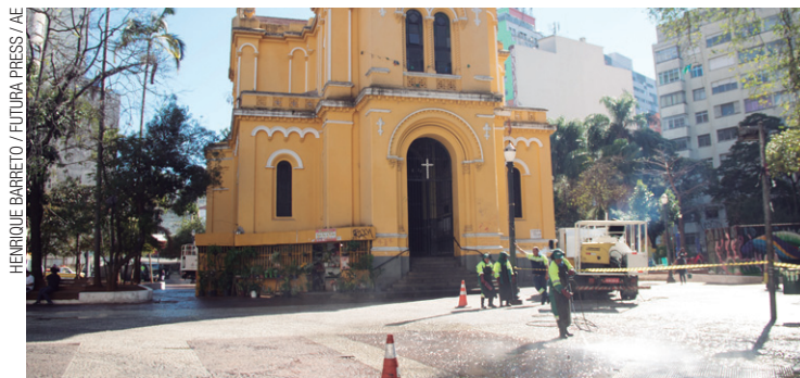
Volto à rotina – Área à frente da igreja volta a ficar sem barracas

A Prefeitura de São Paulo informou que ofereceu acolhimento às famílias que estavam acampadas e que, nas últimas semanas, “intensificou