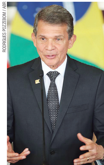
Avanços – Silva e Luna diz que proposta dos EUA vai evoluir

A base, criada em 1983 para o Programa Espacial Brasileiro, é objeto de interesse dos Estados Unidos por causa da proximidade com a Linha do Equador, que possibilita a economia de combustível no lançamento de foguetes. Um acordo para uso norte-americano foi frustrado na década de 1990. (AGÊNCIA BRASIL)