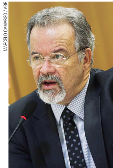
Otimista – Jungmann acredita que PPP é a saída para combater facções

As PPPs irão destravar o sistema e permitir que os recursos do fundo nacional para a construção de unidades, que recebe R$ 400 milhões anuais de loterias esportivas, não submetidos a contingenciamento, sejam de fato usados. "Com as PPPs vamos melhorar a segurança pública e reduzir a força das facções", afirmou Jungmann. (AGÊNCIA ESTADO)