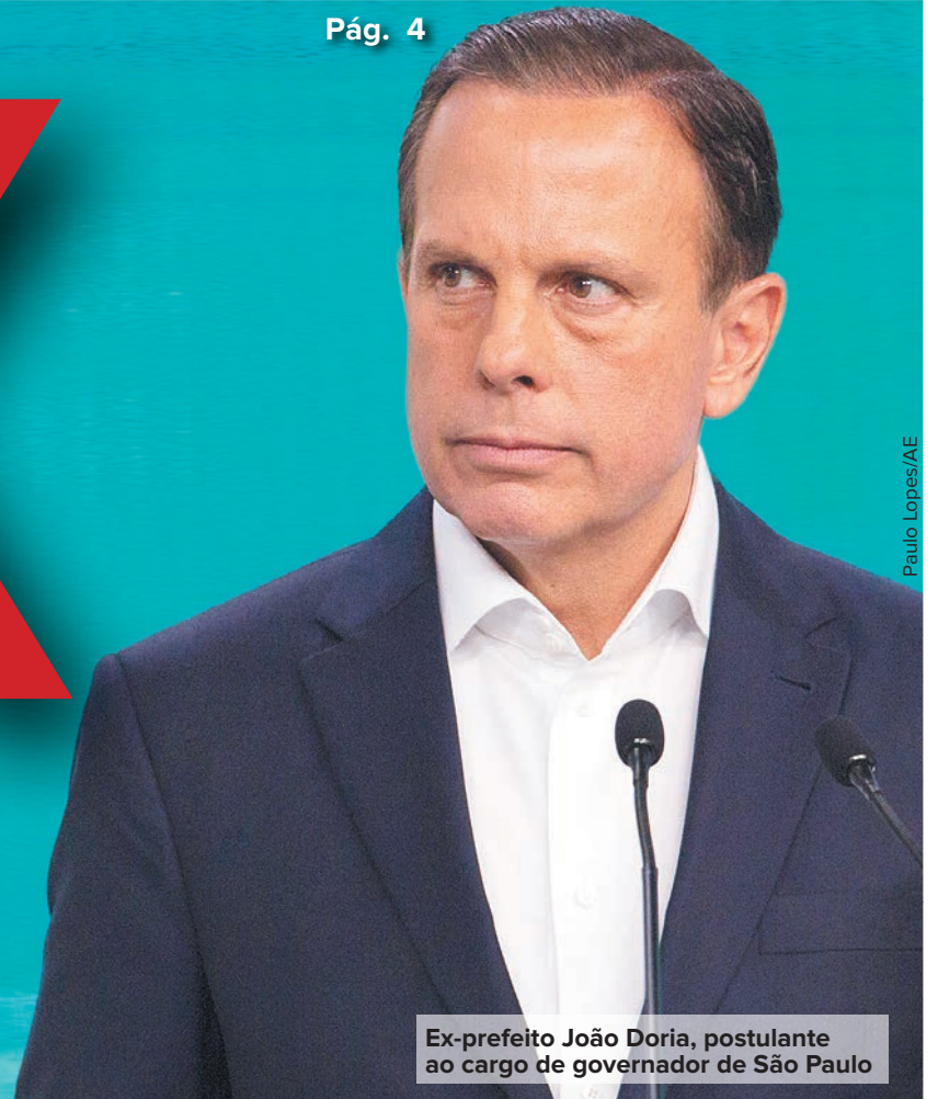
Ex-prefeito João Doria, postulante ao cargo de governador de São Paulo

Bolsonaro sobe quatro pontos e vai para 31%; Haddad tem 21%, aponta pesquisa Ibope