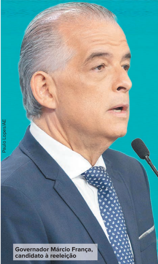
Governador Márcio França, candidato à reeleição