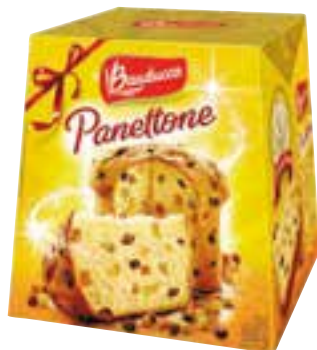
Panettone com frutas Bauducco 500 g