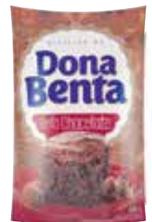
Mistura para bolo Dona Benta chocolate 450 g