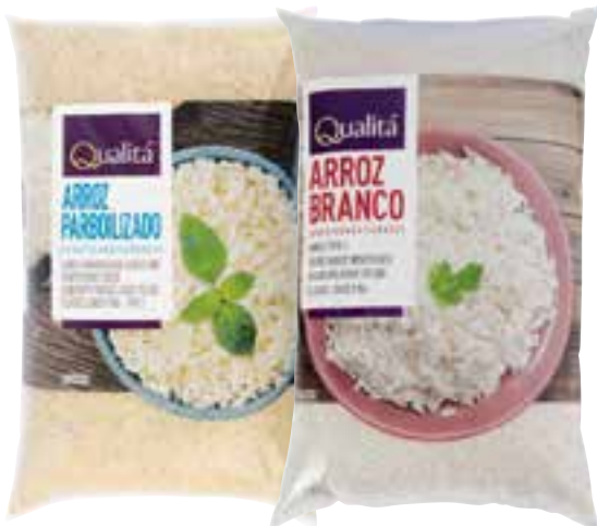
Arroz branco ou parboilizado Qualitá 5 kg