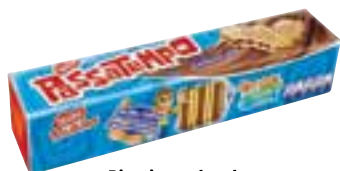
Biscoito recheado Passatempo Nestlé vários tipos 130 g/140 g

R$ 14,99 R$ 10,90 EXCLUSIVO CLIENTE Mercado Extra