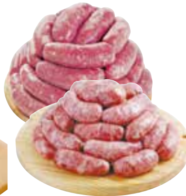
Linguiça de carne suína Perdigão ou linguiça toscana Seara a granel kg