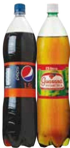
Pepsi ou Guaraná Antarctica PET 1,5 litro