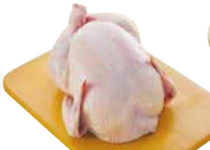
Galinha congelada kg