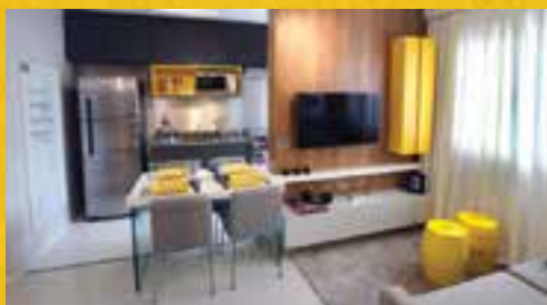
PERSPECTIVA ILUSTRADA DO APTO. DE 31 M 2