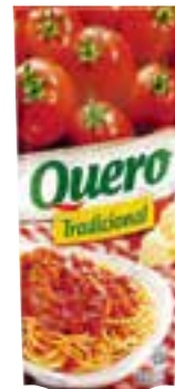
Molho de tomate Quero tradicional 340 g