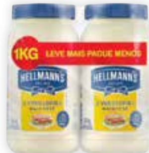
Pack maionese Hellmann's com 2 unidades de 500 g cada