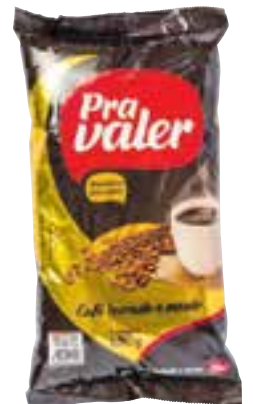
Café torrado e moído Pra Valer tradicional 500 g