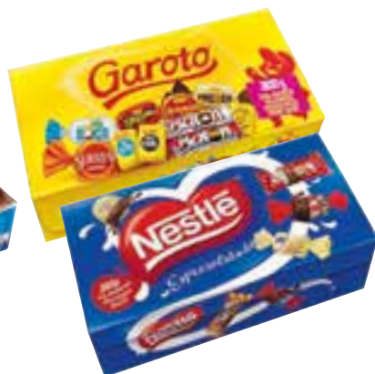
Bombons sortidos Garoto ou Especialidades Nestlé 300 g