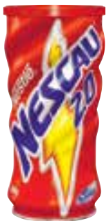
Achocolatado em pó Nescau 2.0 Nestlé 400 g