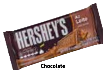
Chocolate em tablete Hershey's vários sabores 92 g