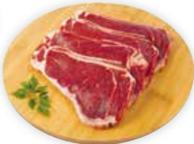
Bife de contrafilé bovino com osso congelado kg