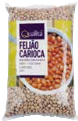
Feijão-carioca Qualitá tipo 1 - 1 kg