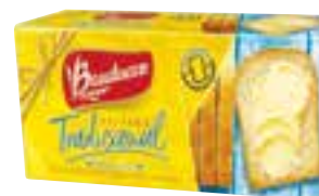
Torrada Bauducco 142 g