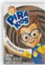
Achocolatado Pirakids Piracanjuba TP 200 ml