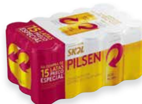
Cerveja Skol embalagem com 15 latas de 269 ml cada