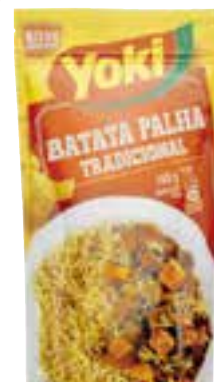
Batata palha Yoki 140 g