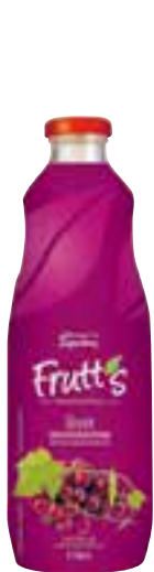
Suco pronto para beber Superbom uva 1 litro