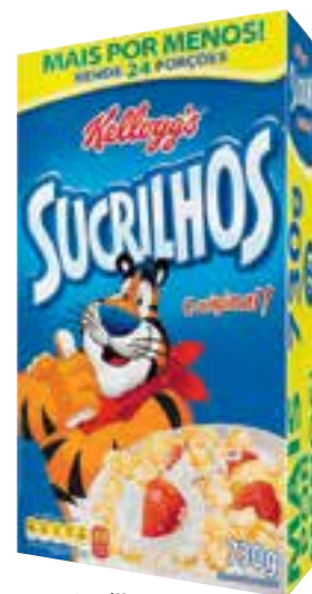
Sucrilhos Kellogg's 730 g