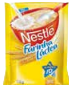
Farinha láctea Nestlé tradicional ou com aveia 210 g