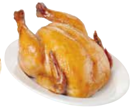
Frango assado kg