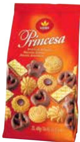
Biscoito amanteigado sortido Princesa 400 g

R$ 14,99 R$ 10,90 EXCLUSIVO CLIENTE Mercado Extra