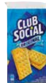
Biscoito Club Social vários tipos 141 g/144 g