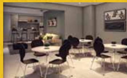
PERSPECTIVA ILUSTRADA DO SALÃO DE FESTAS

AV. MARQUÊS DE SÃO VICENTE, 2900 - BARRA FUNDA 0800-100 2000 | www.benx.com.br