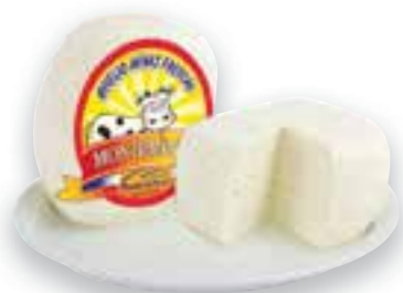
Queijo minas frescal Monteminas 100 g

Ofertas válidas de 3 a 9/12/2019 no Mercado Extra.