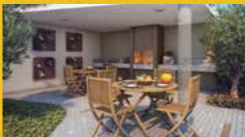
PERSPECTIVA ILUSTRADA DA CHURRASQUEIRA