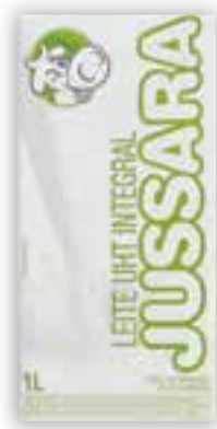
Leite longa vida Jussara integral TP 1 litro