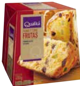
Panettone Qualidade 400 g