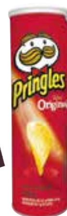
Batata Pringles 114 g/120 g