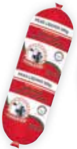
Carne moída bovina congelada 500 g

Ofertas válidas de 3 a 9/12/2019 no Mercado Extra.