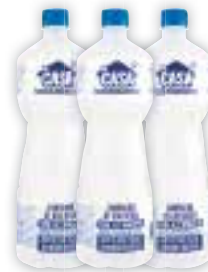
Álcool Da Casa 46INPM, 1 litro