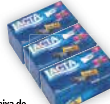
Caixa de bombom Favoritos Lacta Sortidos, 250,6g