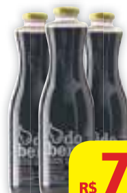
Suco integral Do Bem Sabores, 1 litro