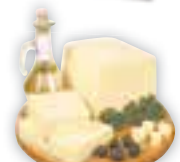
Queijo muçarela Di Fratelli Peça, Kg