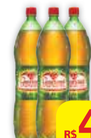
Guaraná Antarctica PET, 2 litros