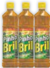
Desinfetante Pinho Bril Diversos, 500ml