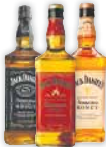
Whiskey Jack Daniel's Diversos, 1 litro