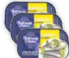
Sardinha Robinson Crusoe Diversas, 125g