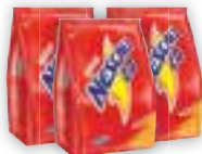
Achocolatado em pó Nescau Nestlé Sachê, 1,2kg