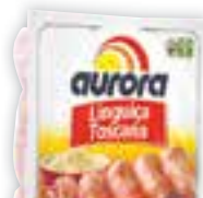
Linguiça toscana Aurora Congelada, 800g