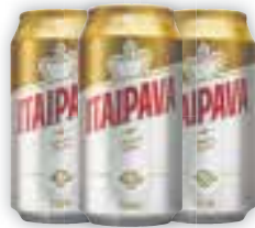
Cerveja Itaipava Lata, 350ml

É HOJE! 10/12 ÀS 9H | Av. dos Estados, 8.500 - Jardim Alzira Franco