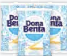
Farinha de trigo Dona Benta 1kg