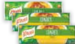
Massa com ovos ou sêmola Knorr Diversos cortes, 500g