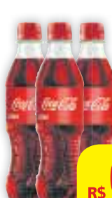
Coca-Cola PET, 200ml