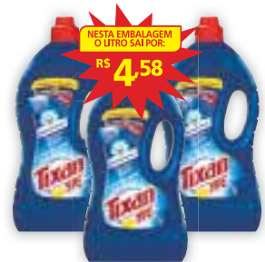
Detergente líquido para roupas Tixan Ypê Primavera, 5 litros