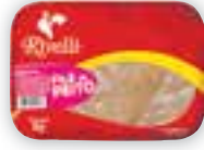
Filé de peito de frango Rivelli Bandeja, Congelado, 1kg