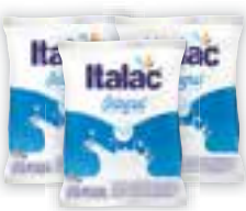
Leite em pó Italac* Integral/Instantâneo, Sachê, 400g