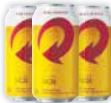
Cerveja Skol Lata, 350ml