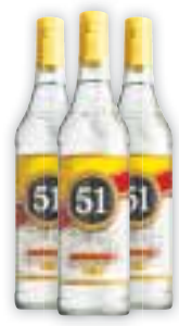
Aguardente 51 965ml