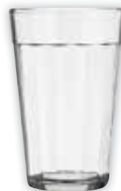
Copo Americano Nadir Figueiredo 190ml