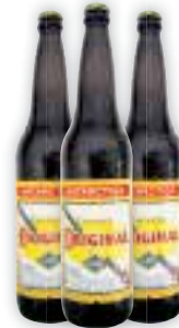
Cerveja Original 600ml