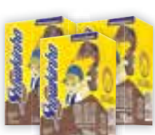
Bebida láctea Showkinho 200ml