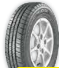
Pneu Direction Goodyear Aro 14, 175/65