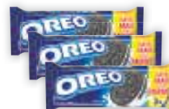
Biscoito recheado Oreo Baurilha, 270g