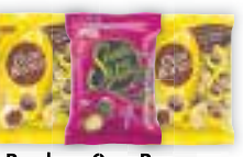
Bombom Ouro Branco ou Sonho de Valsa Lacta 1kg