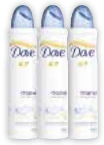
Desodorante Dove Diversos, Aerosol, 150ml