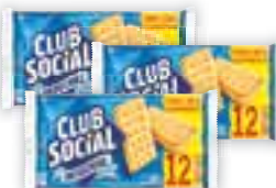
Biscoito Club Social Original/Integral, 288g