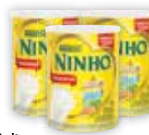
Leite em pó Ninho Nestlé* Integral/Instantâneo, Lata, 400g