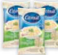
Arroz integral Camil 1kg