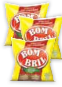
Lã de aço Bom Bril Com 8 unidades, 60g