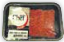
Carne moída bovina Do Chef 500g