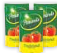
Molho de tomate Pomarola Sachê 340g