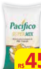
Pré-mistura para pão francês Supermix Pacífico 25kg