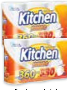
Toalha de papel Kitchen Jumbo, Com 3 unidades, Leve 360 unidades Pague 330 unidades