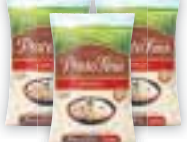
Arroz Prato Fino Branco, 5kg, Tipo 1