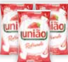
Açúcar União Refinado, 1kg