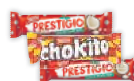
Chocolate Nestlé Charge/Chokito/Prestigio, 32/33/40g cada