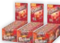
Chocolate Baton Garoto Diversos, Display com 30 unidades