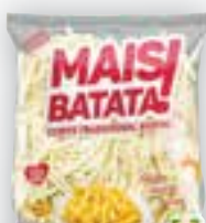
Batata palito Mais Batata! Pré-frita, Congelada, 2kg