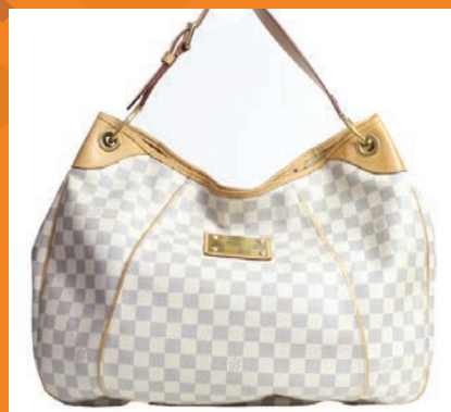
Reparos diversos em bolsas femininas