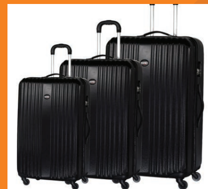
Venda e aluguel de malas de viagem com o melhor preço do mercado

Somos a maior empresa do Brasil em conserto, venda e aluguel de malas de viagem. Entre em contato conosco e peça um orçamento, sem compromisso.