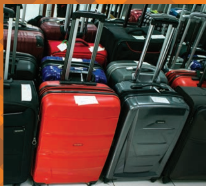
Conserto de malas de fibra e tecido