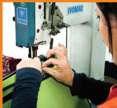
Troca de zíper e costura