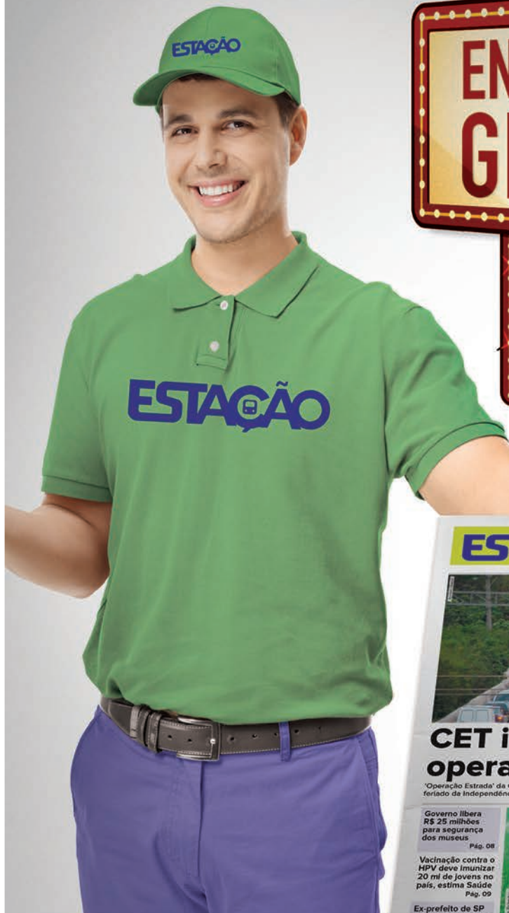
O CAMPEÃO DO METRÔ

MAIS DE 6 MILHÕES DE USUÁRIOS DE VEÍCULOS