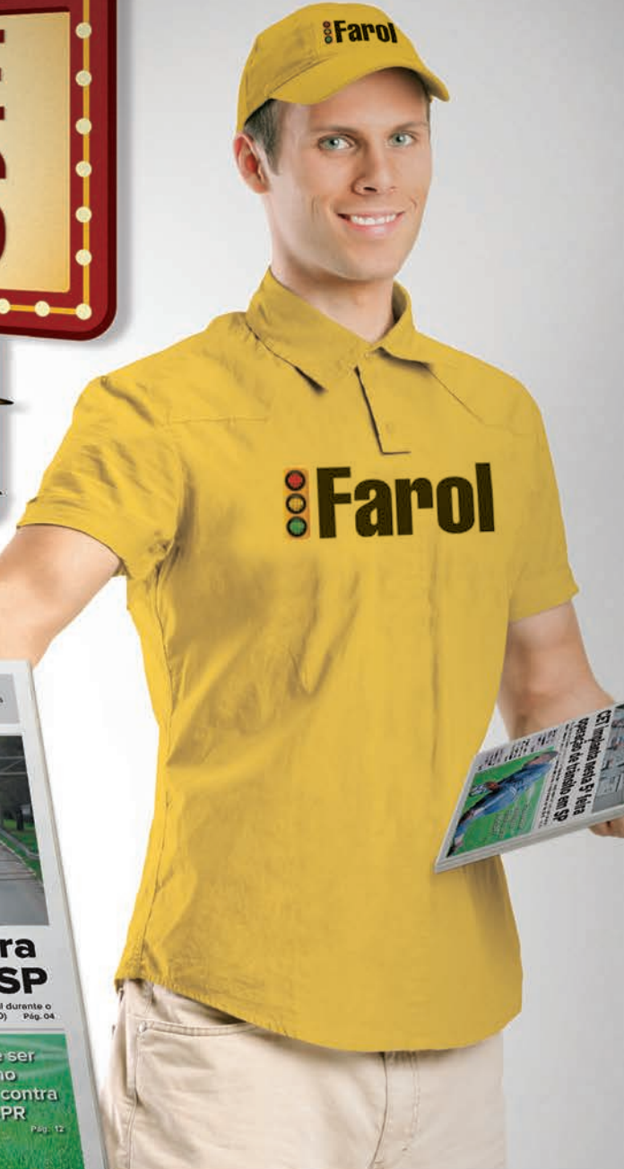
O CAMPEÃO DO FAROL