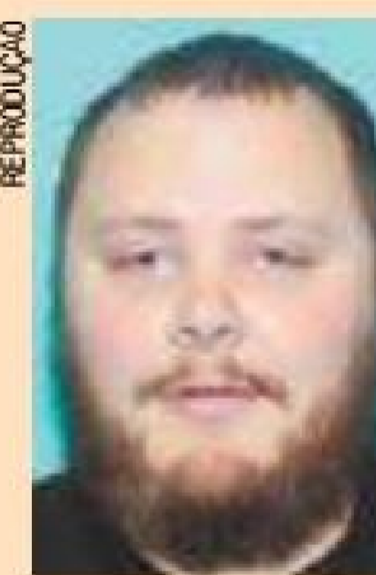
Suicídio Homem teria tirado a própria vida após atentado