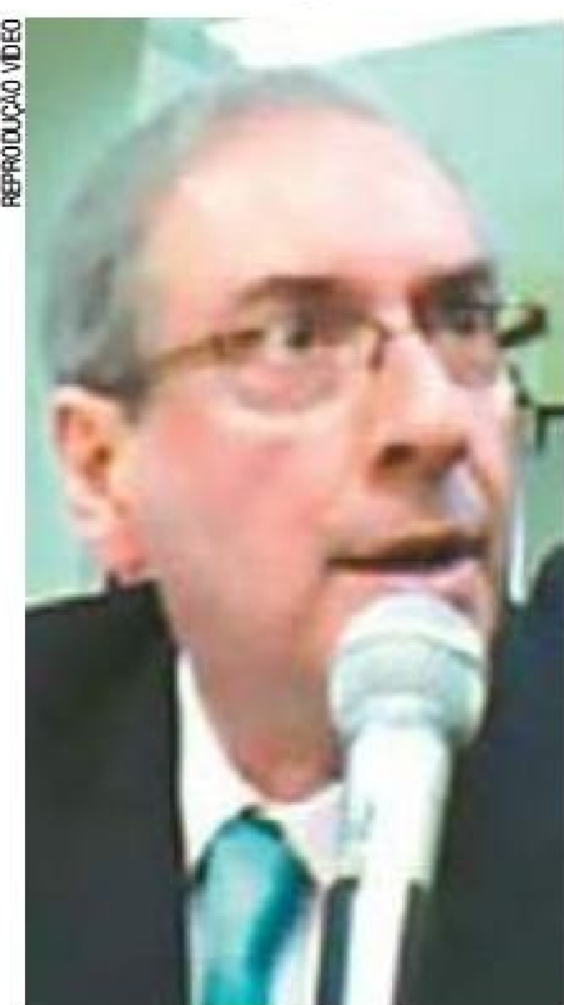
Em cana - Deputado cassado está preso há pouco mais de um ano

A suposta compra do silêncio de Cunha embasou uma das denúncias do então procurador-geral da