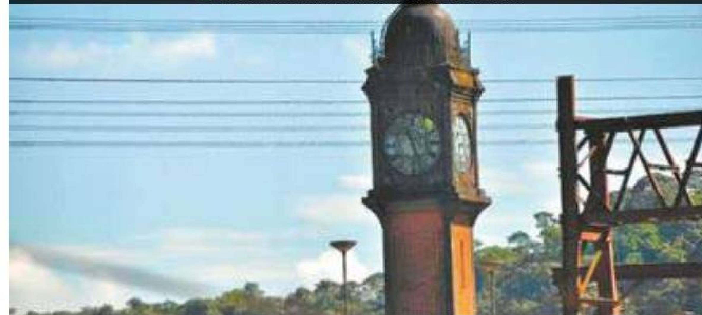
Tempo - Alessandro Rodrigues elegeu como lugar favorito a vista da torre de um relógio em Paranapiacaba