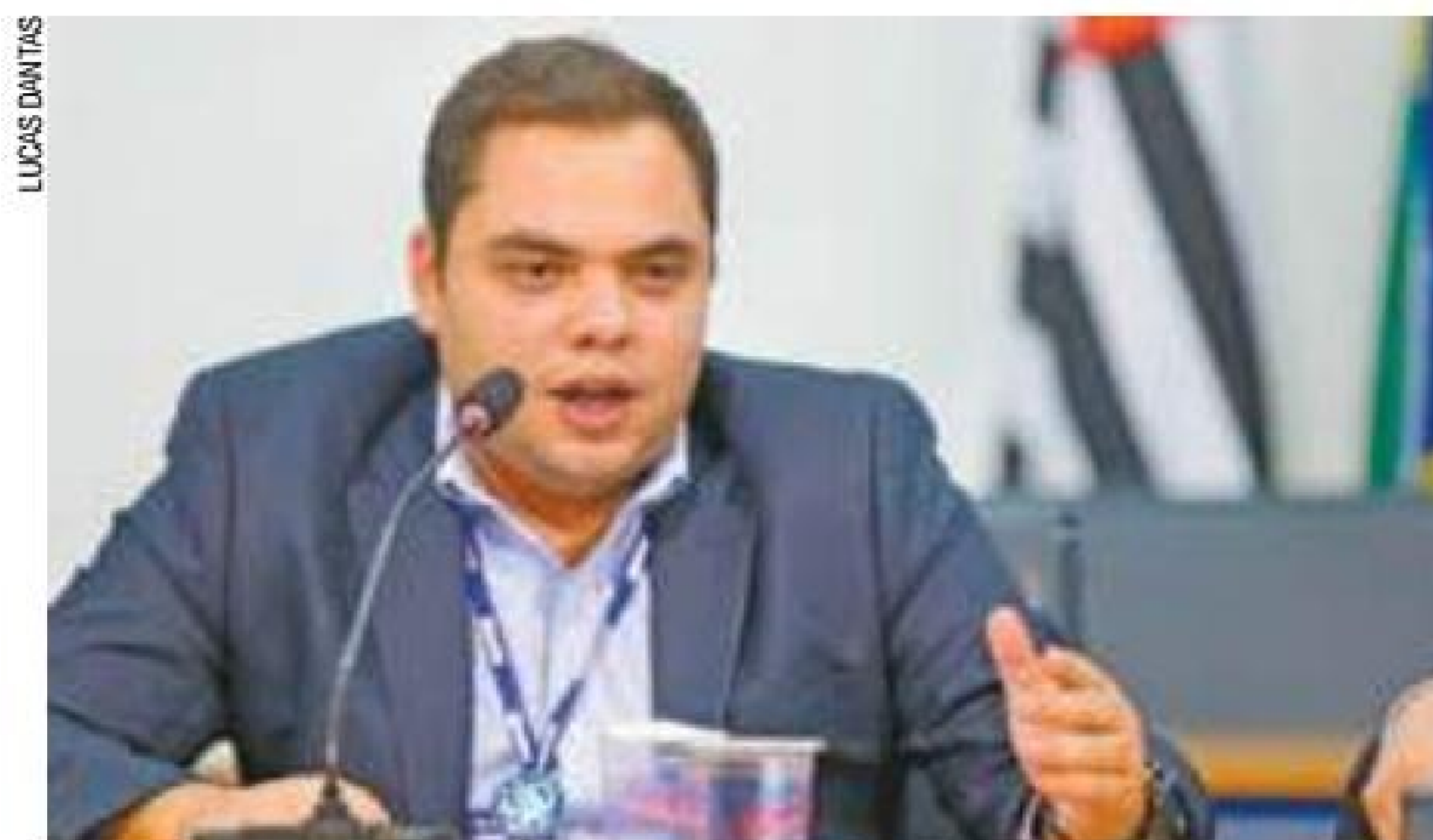
Mais fácil - Empresa pode renegociar contratos que a impediam de operar

“É uma grande vitória para todos dessa gestão. Agora a empresa pode voltar a tocar as obras de forma mais ágil,