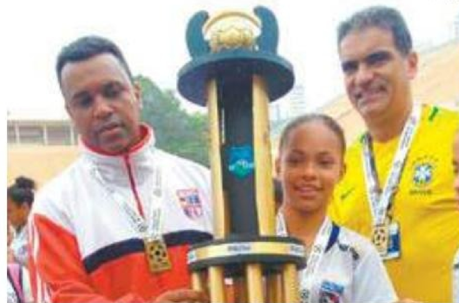
Vitória - Equipe Sub-15 levantou o caneco no último domingo, dia 5

Hoje todas as divisões treinam no Estádio Municipal Doutor Cícero Miranda, na Vila Galvão, durante um dia por semana.