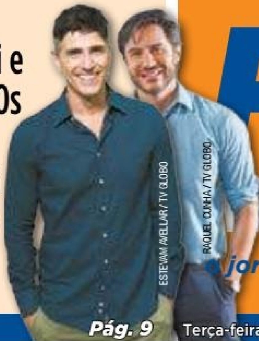
ESTEWAN WELLYAR / TV GLOBO

Gianecchini e Tozzi são "Os guardiões do Taj", em espetáculo