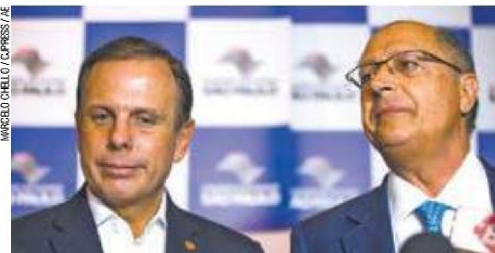
Dobradinha - Aliança seria feita para atingir a Lula e a Jair Bolsonaro

O prefeito de São Paulo, João Doria (PSDB), admitiu a possibilidade de ser candidato a vice-presidente da República em uma chapa encabeçada pelo governador de São Paulo, Geraldo Alckmin (PSDB), em 2018. Em entrevista exibida na madrugada de ontem, no programa Canal Livre , da TV Bandeirantes, o tucano declarou que “tudo é possível”. Ele voltou a defender que só uma aliança partidária de centro encabeçada pelo PSDB seria capaz de derrotar o ex-presidente Luiz Inácio Lula da Silva (PT) e o deputado federal Jair Bolsonaro (PSC-RJ) no ano que vem.