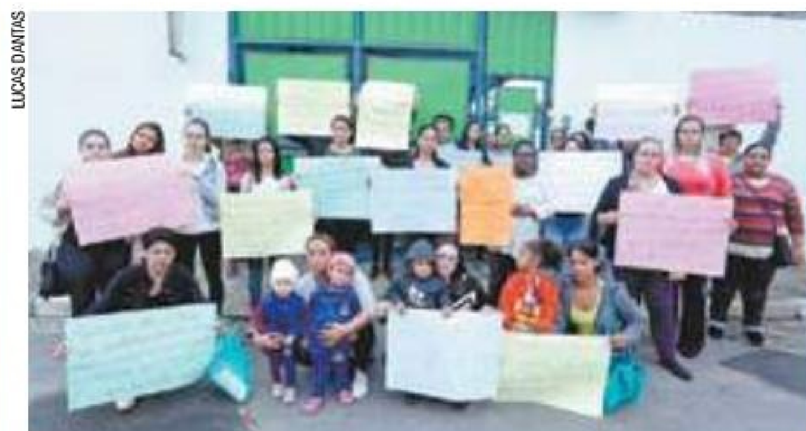
Atraso - Associação não recebe repasses da Prefeitura há três meses