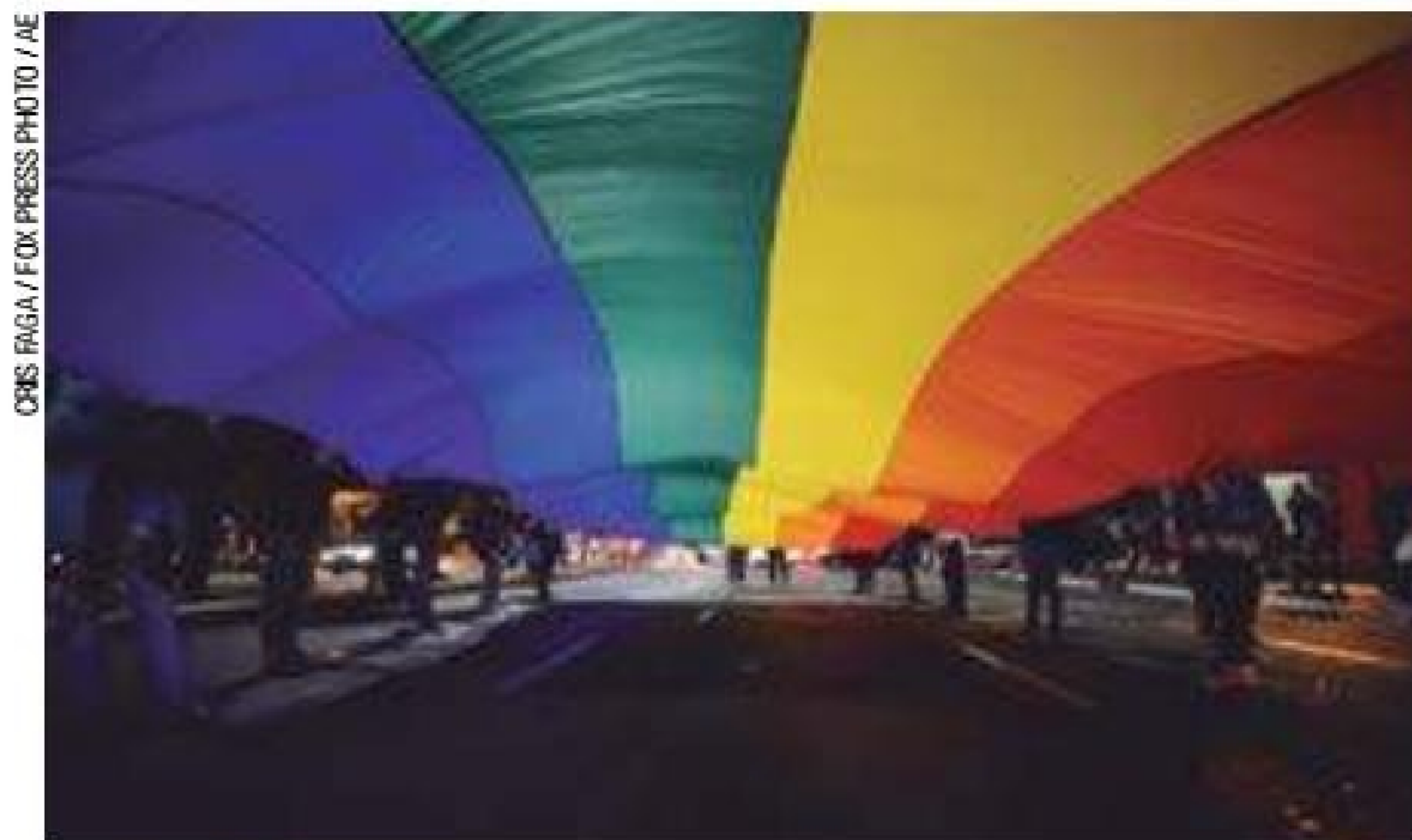
Diversidade - Meta propõe ações de combate ao preconceito

PME foi protocolado no último dia 7 pela Educação