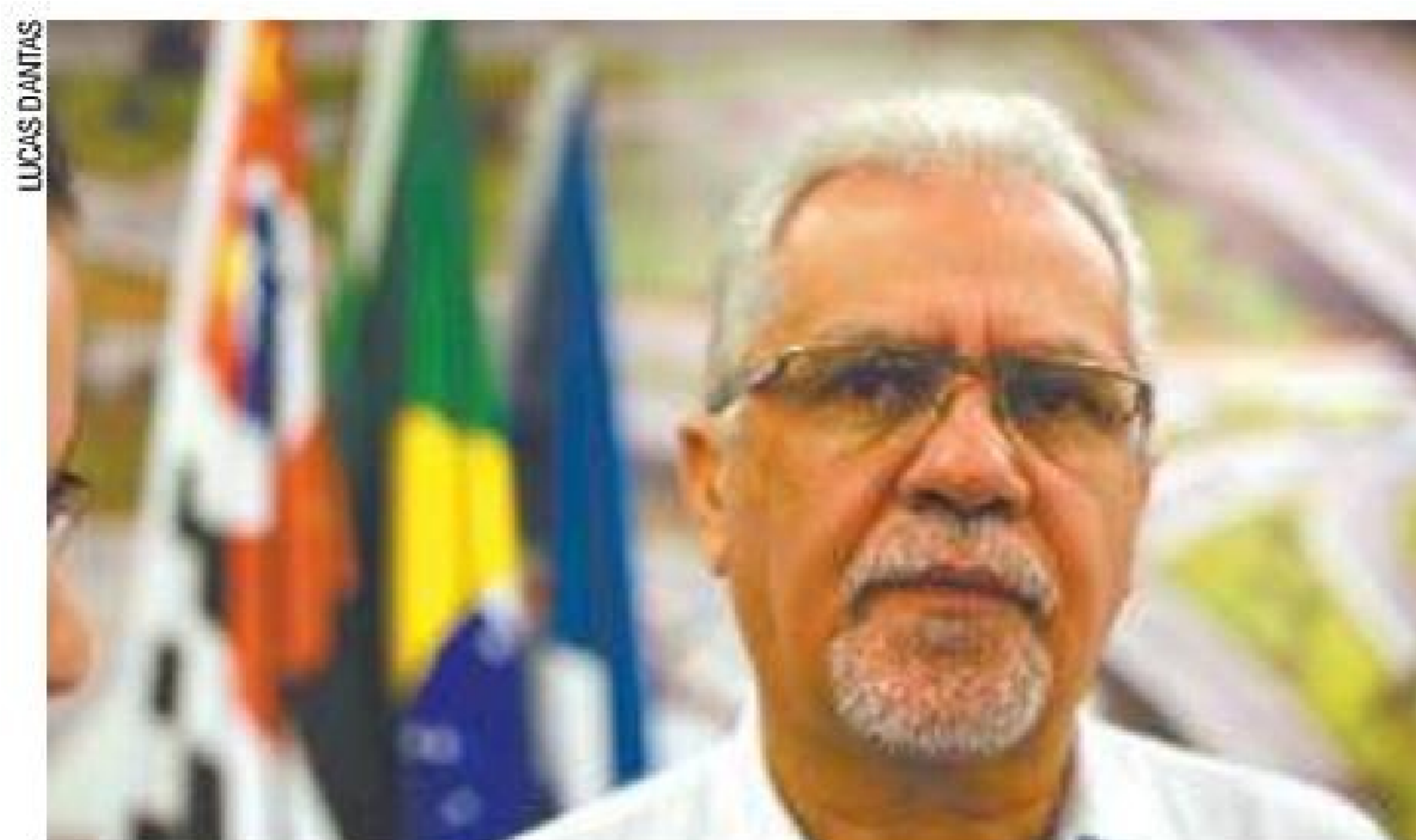
Risco - Ex-prefeito pode ficar inelegível e não disputar eleições em 2018