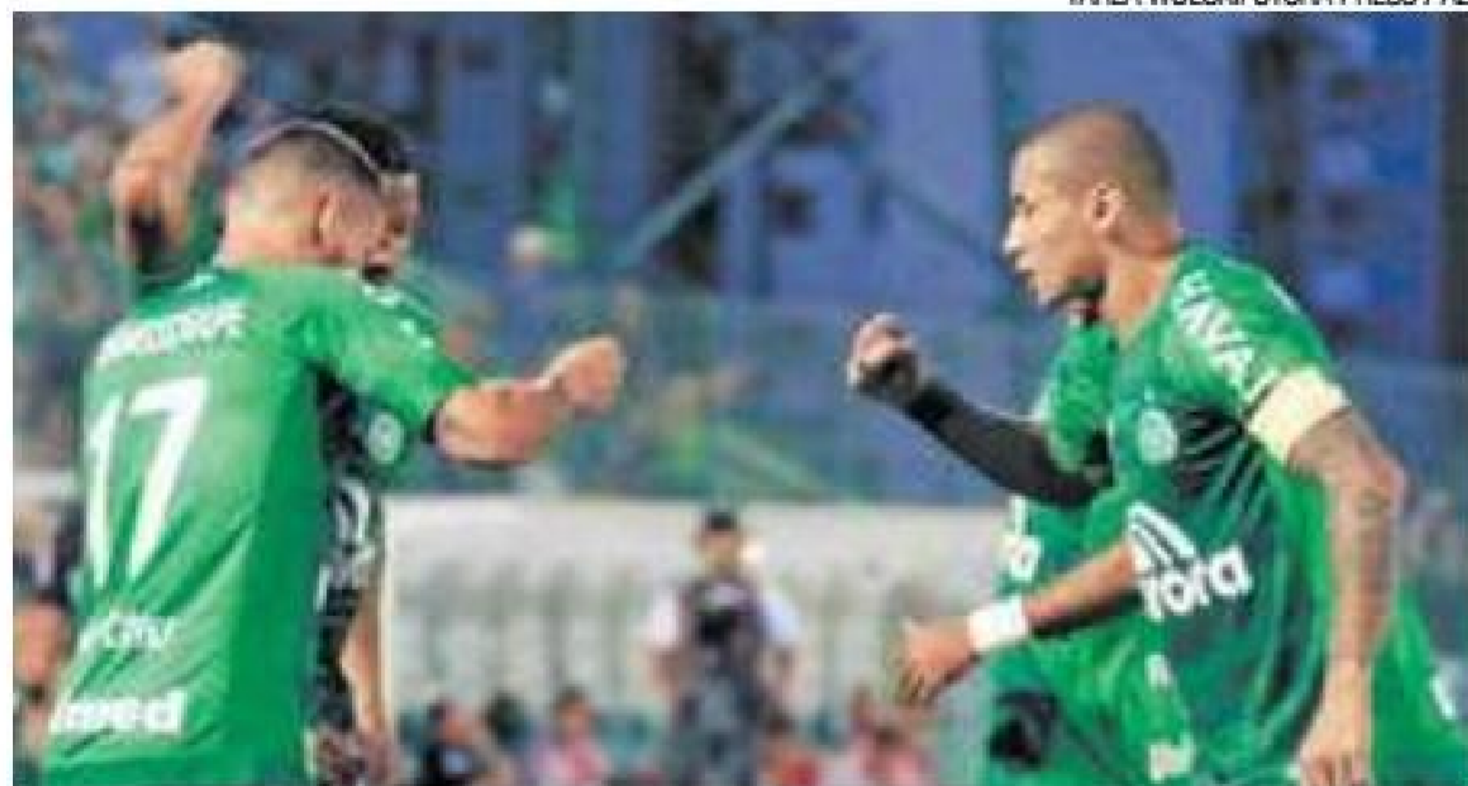
Matemática – Resultado eliminou matematicamente as chances do Peixe