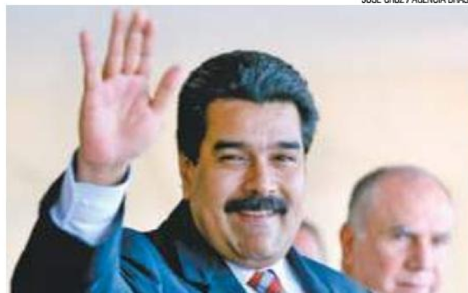
Tendência - Europa segue os passos dos Estados Unidos e do Canadá

Assembleia Constituinte, formada exclusivamente por chavistas. Após manifestar sua preocupação pelas informações sobre "violações dos direitos humanos e uso excessivo da força na Venezuela", os países europeus decidiram proibir a venda e o abastecimento de armas. (AGÊNCIA ESTADO)