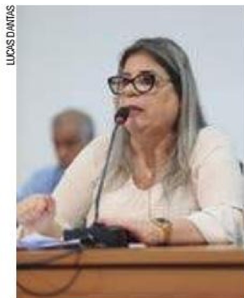
Recursos - Diretora afirmou que há recursos para comprar mistura

“Nós temos recursos para merenda, não temos problemas de recursos, o nosso problema é processual, de licitação em que en-