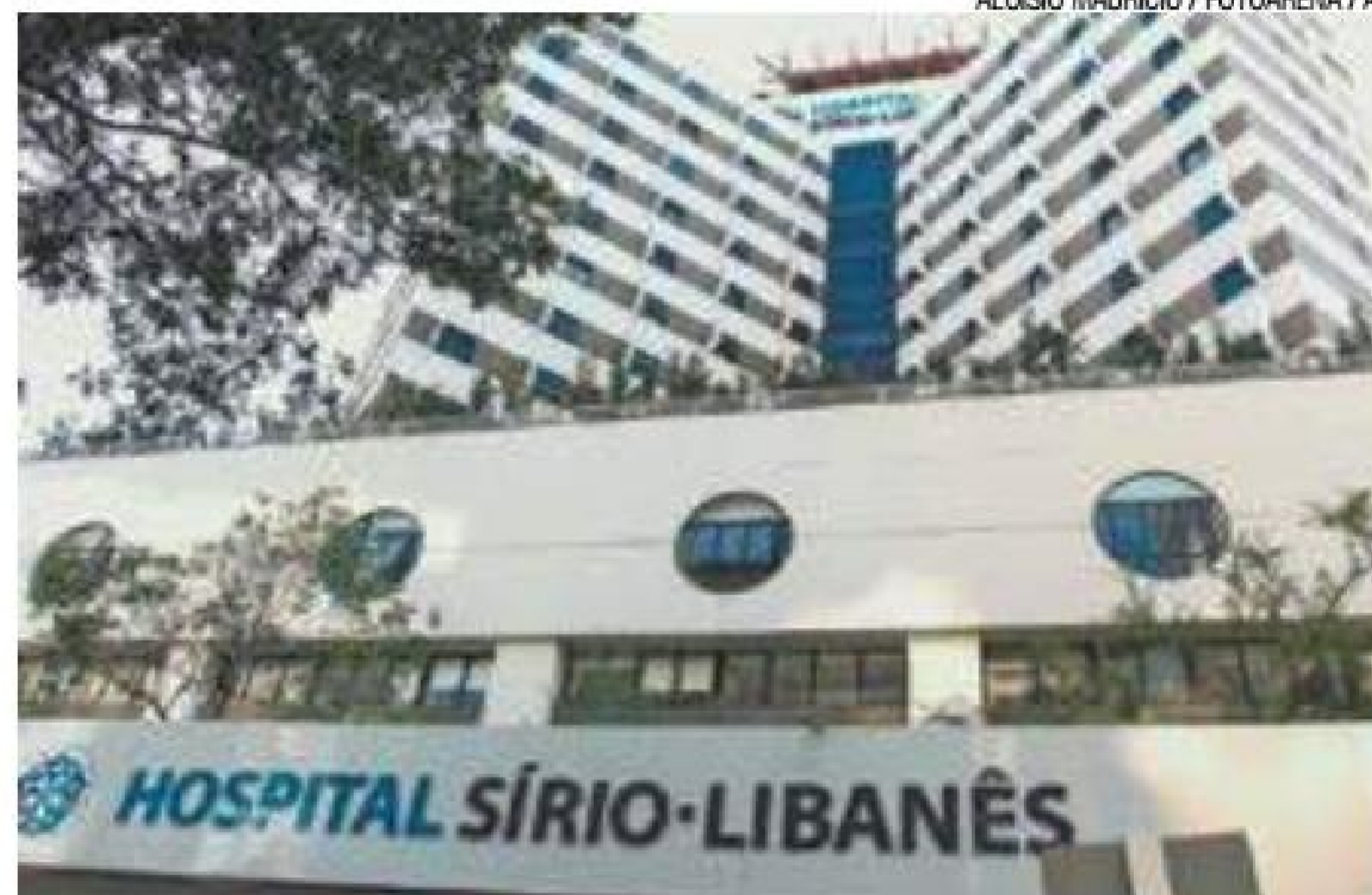
Referência – Temer tem ido com frequência ao hospital para tratamento