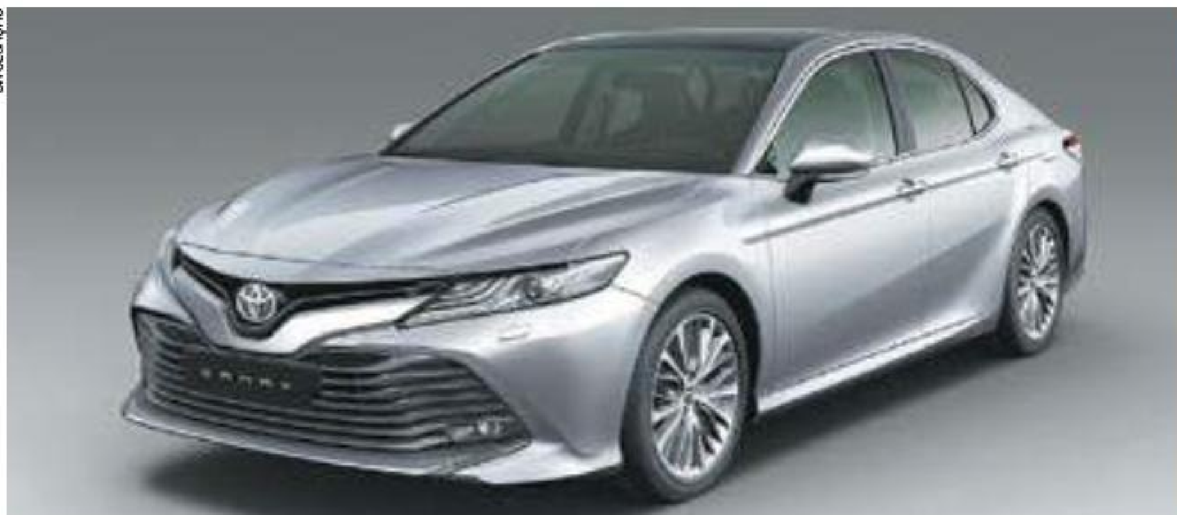
Força – Motor V6 3.5L ainda mais potente, de 310 cv, e nova transmissão automática de oito velocidades