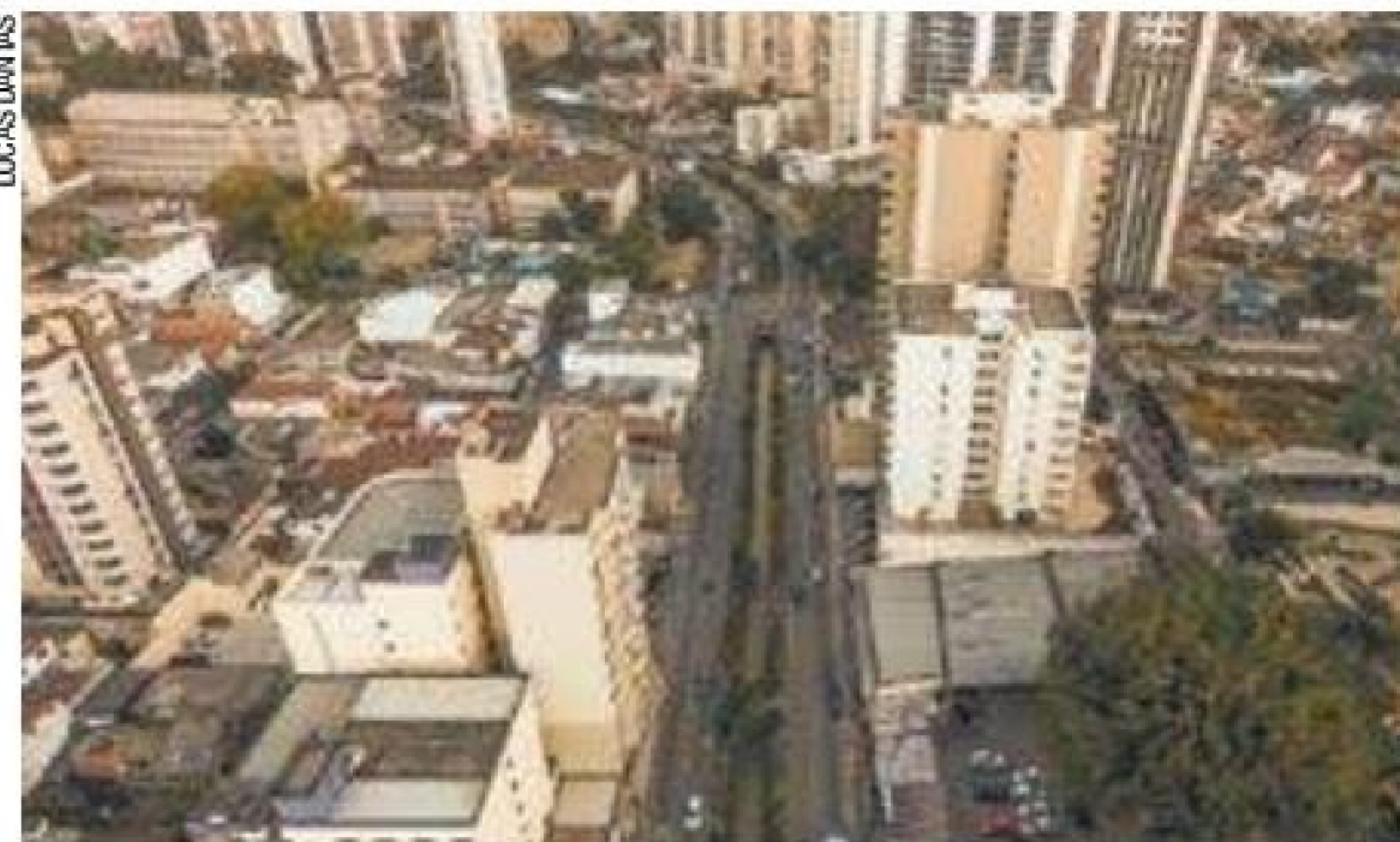
Potência - Guarulhos perdeu espaço na economia na última década

Excluindo-se as capitais, dez municípios geravam, individualmente, mais de 0,5% do PIB e, juntos, chegavam a agregar 7,4% do Produto Interno Bruto do País em 2015. Desses dez municípios, os sete