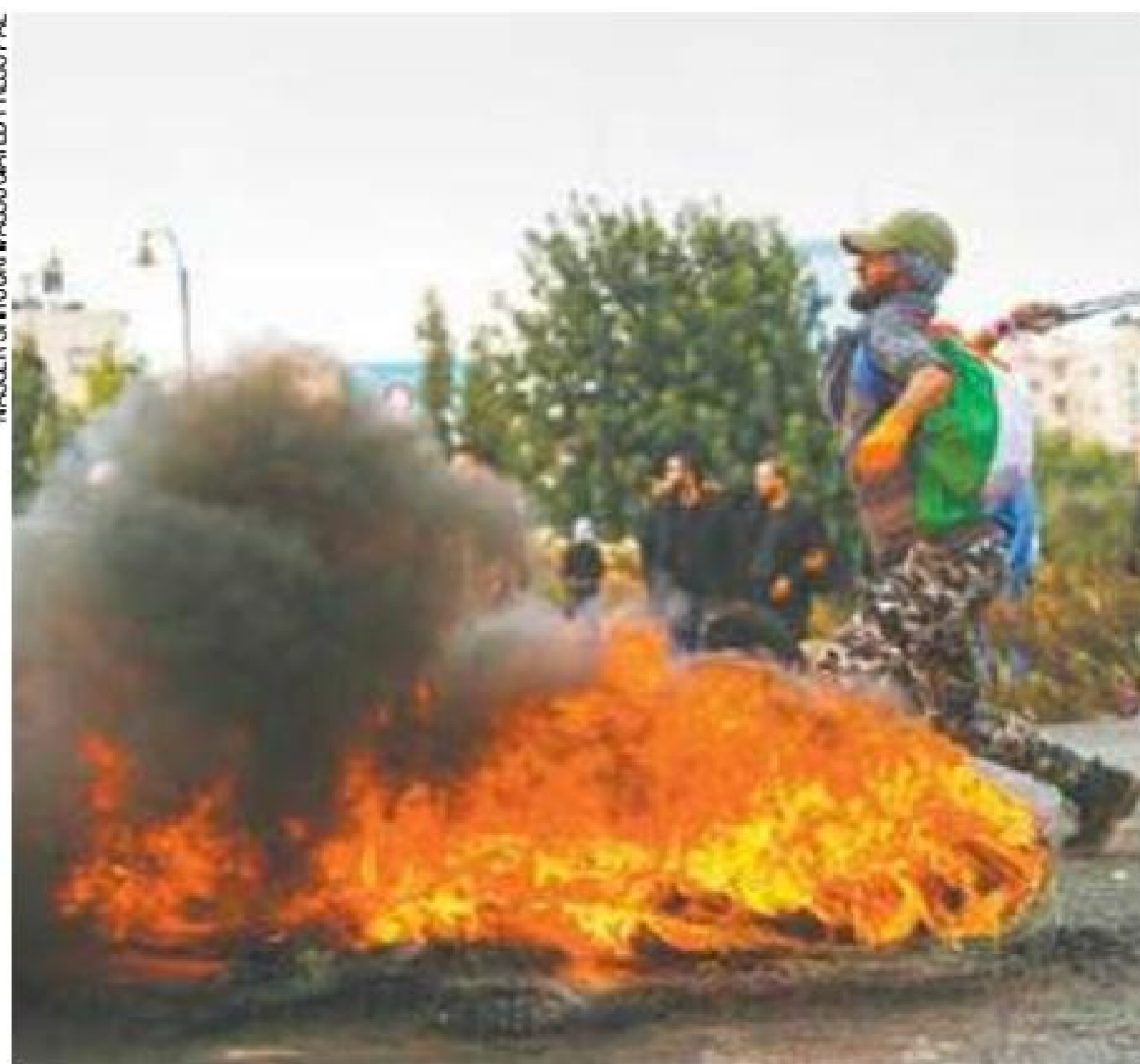
Tensão – Extremistas palestinos têm atacado o território de Israel diariamente

Reconhecimento de Jerusalém como capital é polêmica