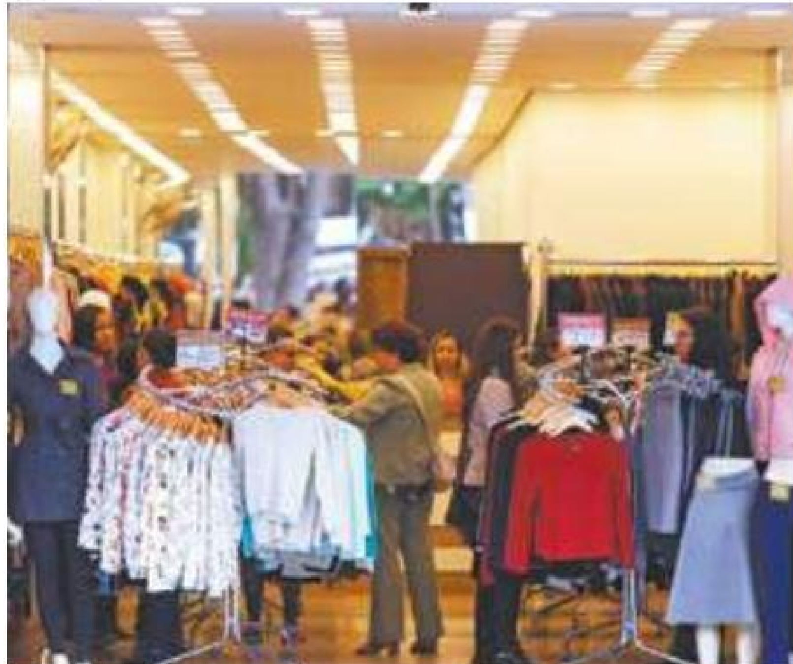
Mercado - Lojas intensificam as contratações por conta do Natal