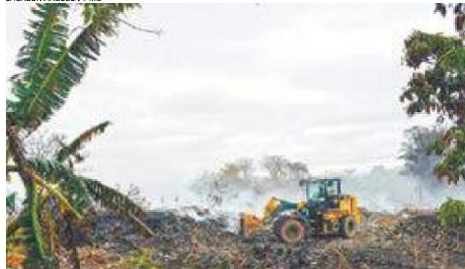
Destruição - Chamas atingiram aterro ilegal e queimaram mata do local