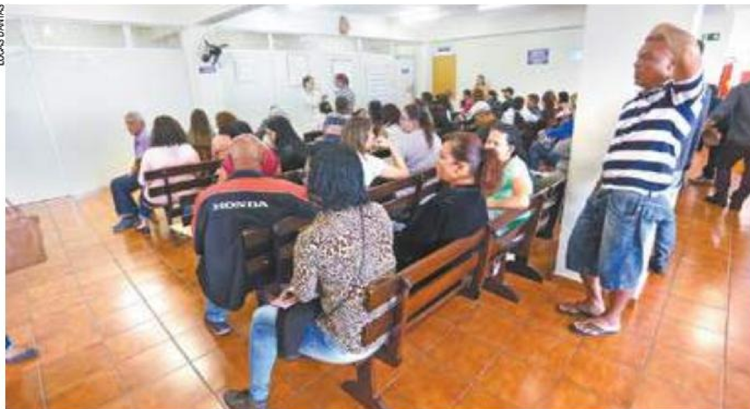
Paciência - Locais com atendimento pelo SUS registram alta na demanda de pacientes em Guarulhos