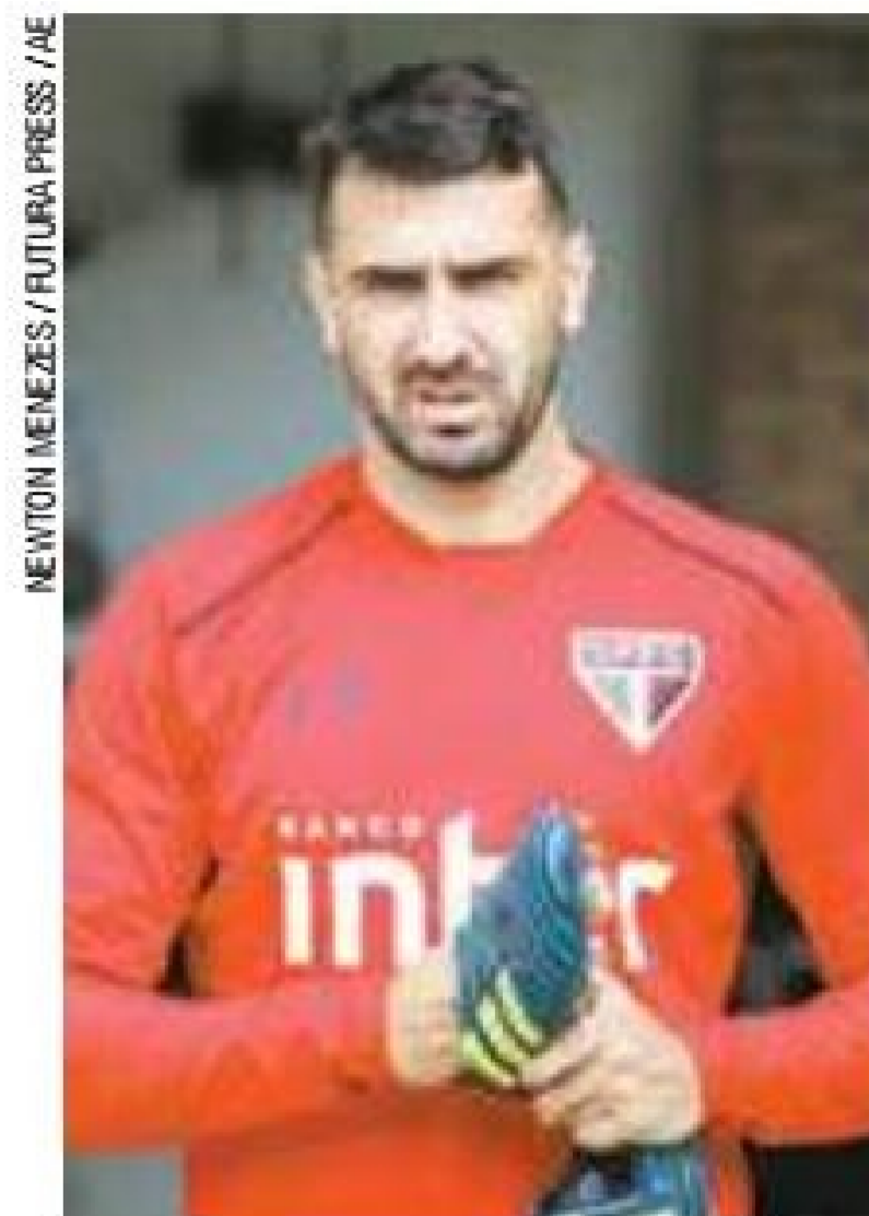
Sacrifício - Atleta garantiu que "vai parar um pouco" de jogar

Pratto revelou jogar há cerca de um mês com o problema. "Conversei com a comissão técnica e com os médicos. Como atingimos o nosso objetivo, vou parar um pouco". (AE)