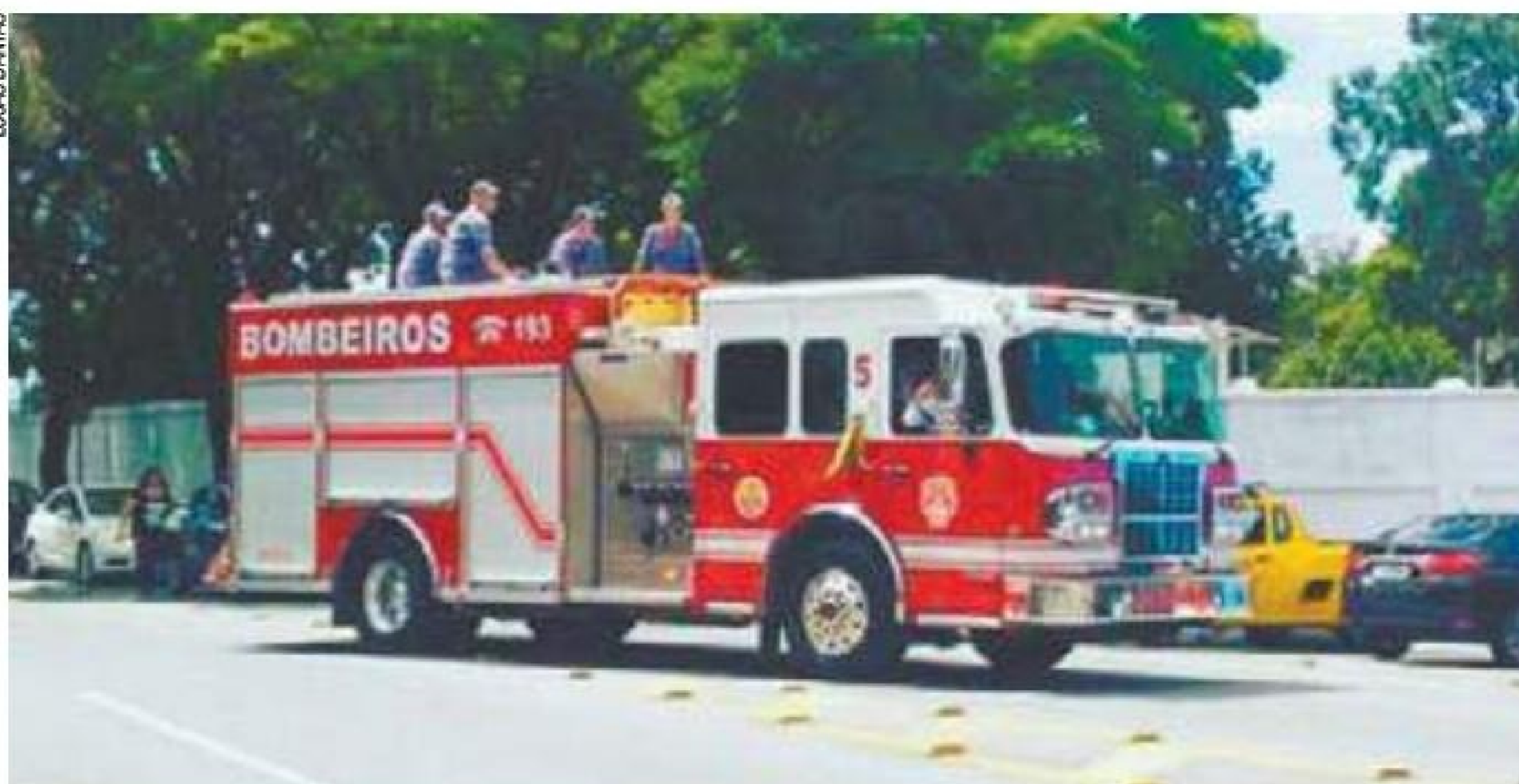
Último adeus - Corpo de Papotto foi velado no Paço Municipal, onde ele trabalhou por 4 anos como prefeito

Simplicidade e humildade são marcas deixadas por Papotto na política e na vida