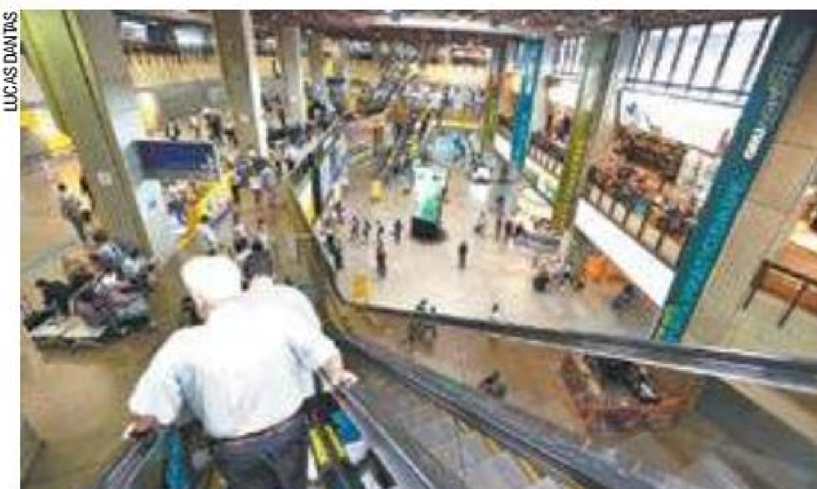
Liderança – Aeroporto de Guarulhos é o mais movimentado do Brasil

A ideia da companhia árabe é assumir a participação de parte das ações dos fundos de pensão estatais Previ (de funcionários do Banco do Brasil), Funcef (Caixa) e Petros (Petro-