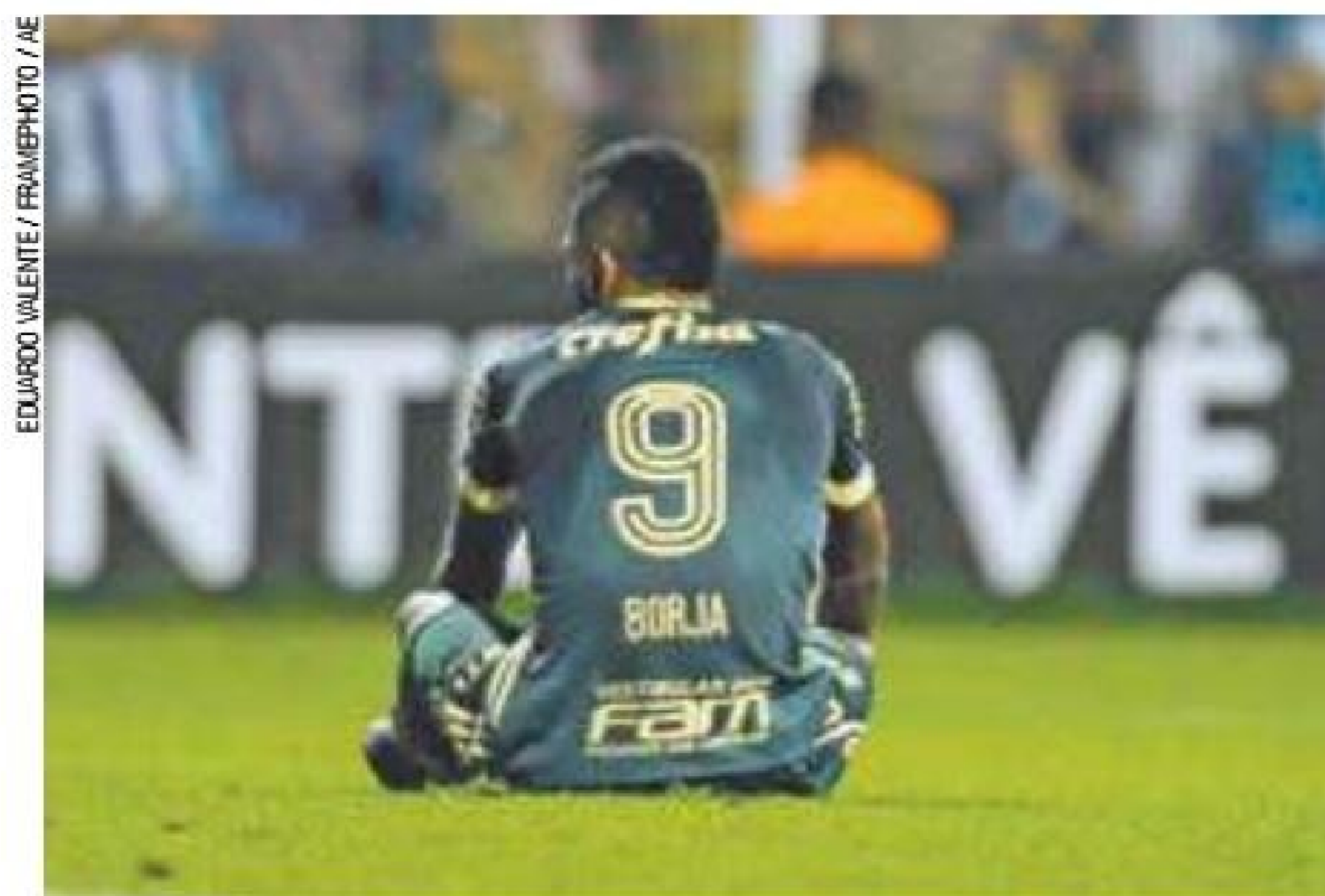
Desmotivado - Equipe não apresentou um bom futebol em Florianópolis

No encontro entre o Avaí, movido pelo desejo de evitar a queda, contra o Palmeiras, com pouca ambi-