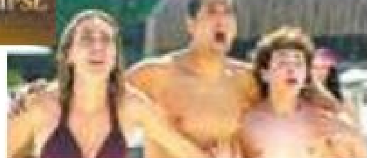
Desespero - Tragédia no começo