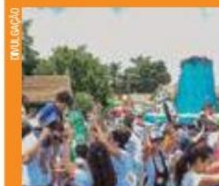
Solidariedade - Grupo doa lanches para carentes

Hamburgada do Bem espera voluntários Pág. 7