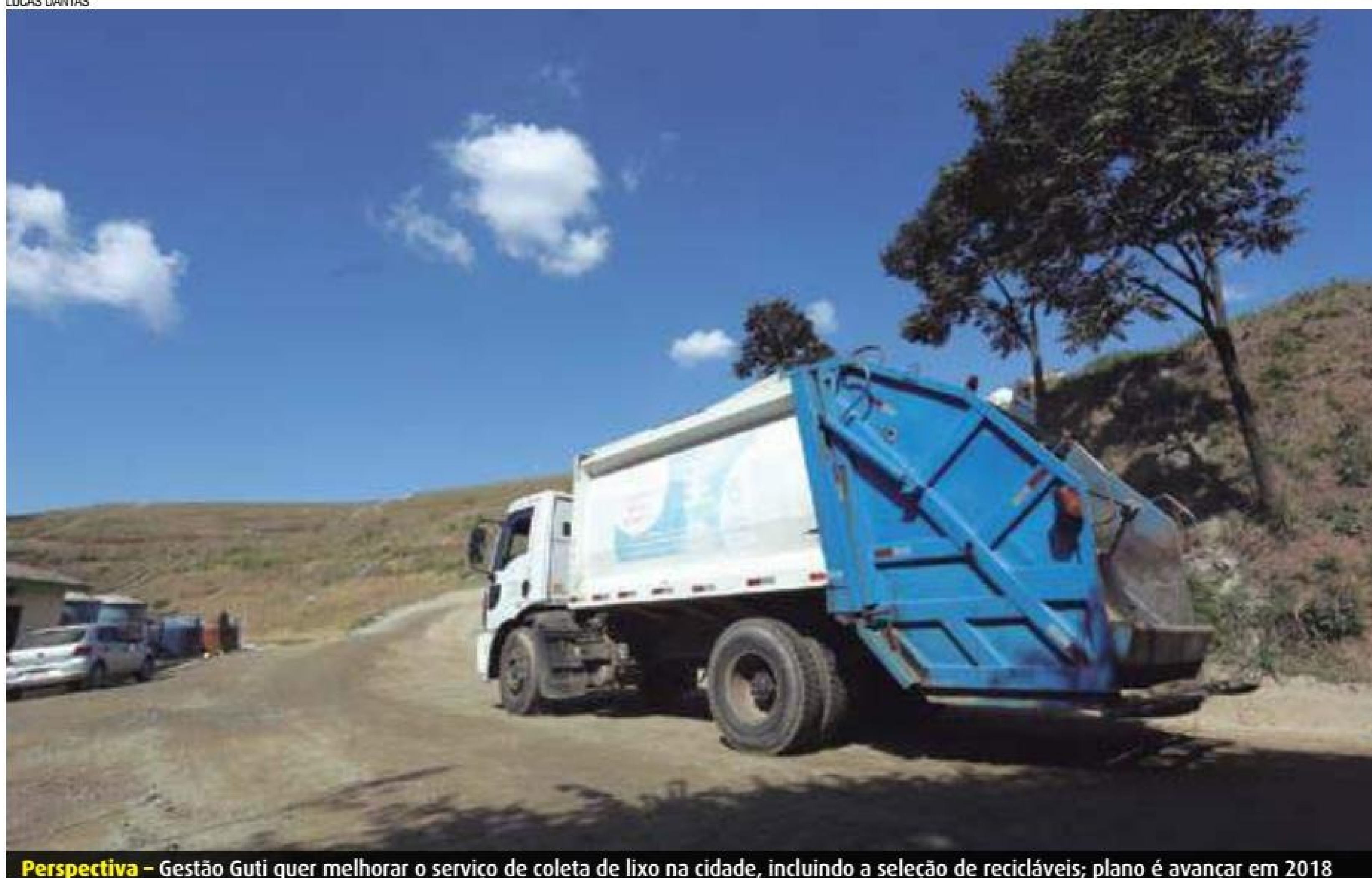
Perspectiva - Gestão Guti quer melhorar o serviço de coleta de lixo na cidade, incluindo a seleção de recicláveis; plano é avançar em 2018