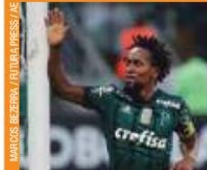
Agradecimento - Lateral chorou ao final da partida

Cidade fica na 25ª posição nos Jogos Abertos do Interior Pág. 12