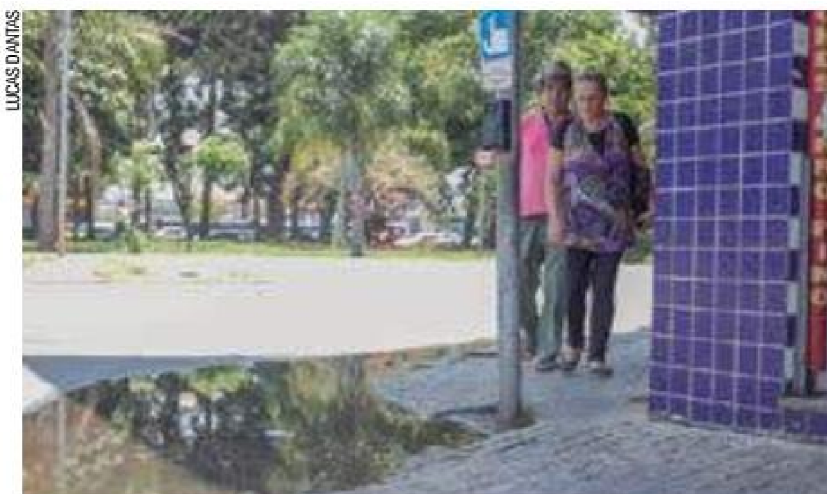
Desvio - Esgoto faz transeuntes terem acesso pequeno para passar