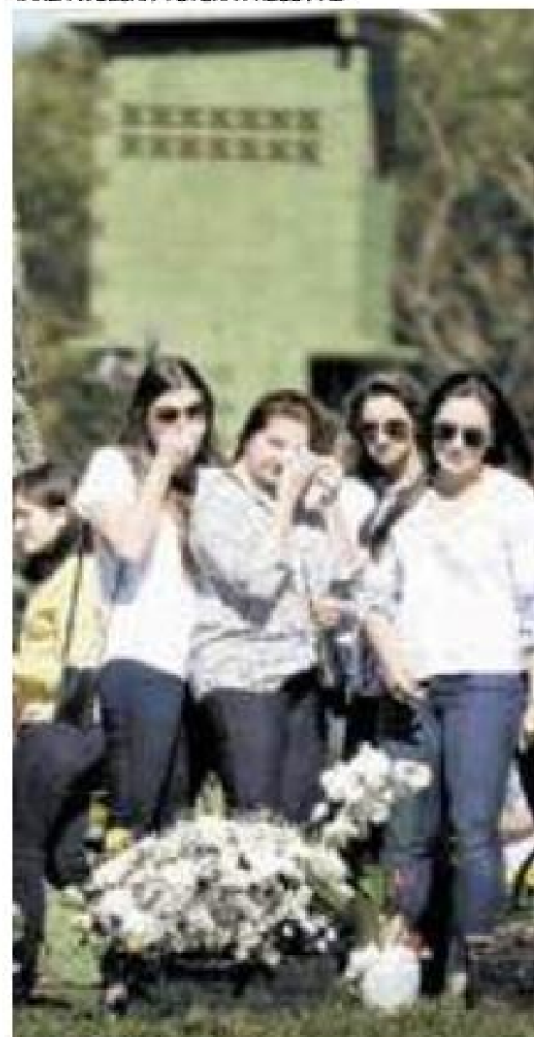
Dor - Mulheres choram ao visitar túmulo de atletas da Chapecoense