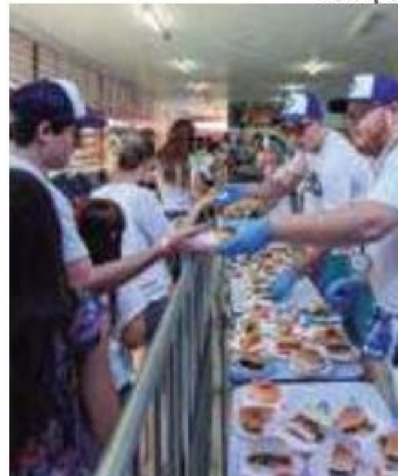
Bondade - Evento distribui lanches para as pessoas carentes da cidade