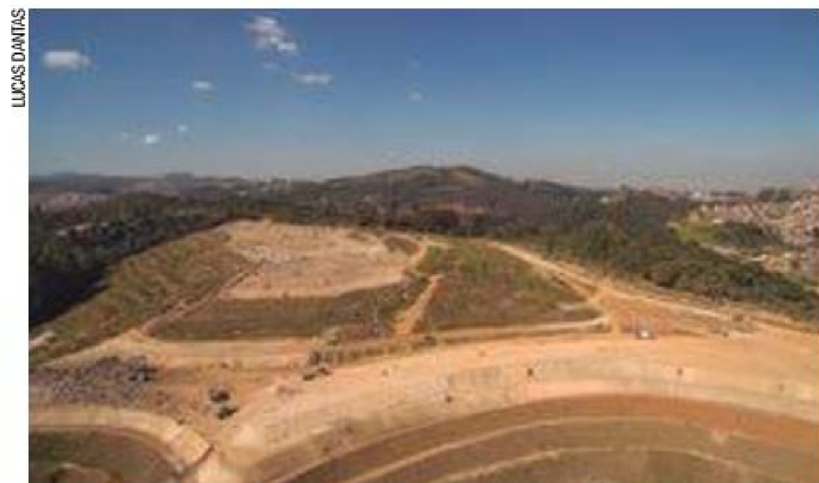
Futuro - Aterro foi adquirido pela Prefeitura, da Quitaúna, em 2016

Tribunal de Contas suspendeu a 1ª concorrência