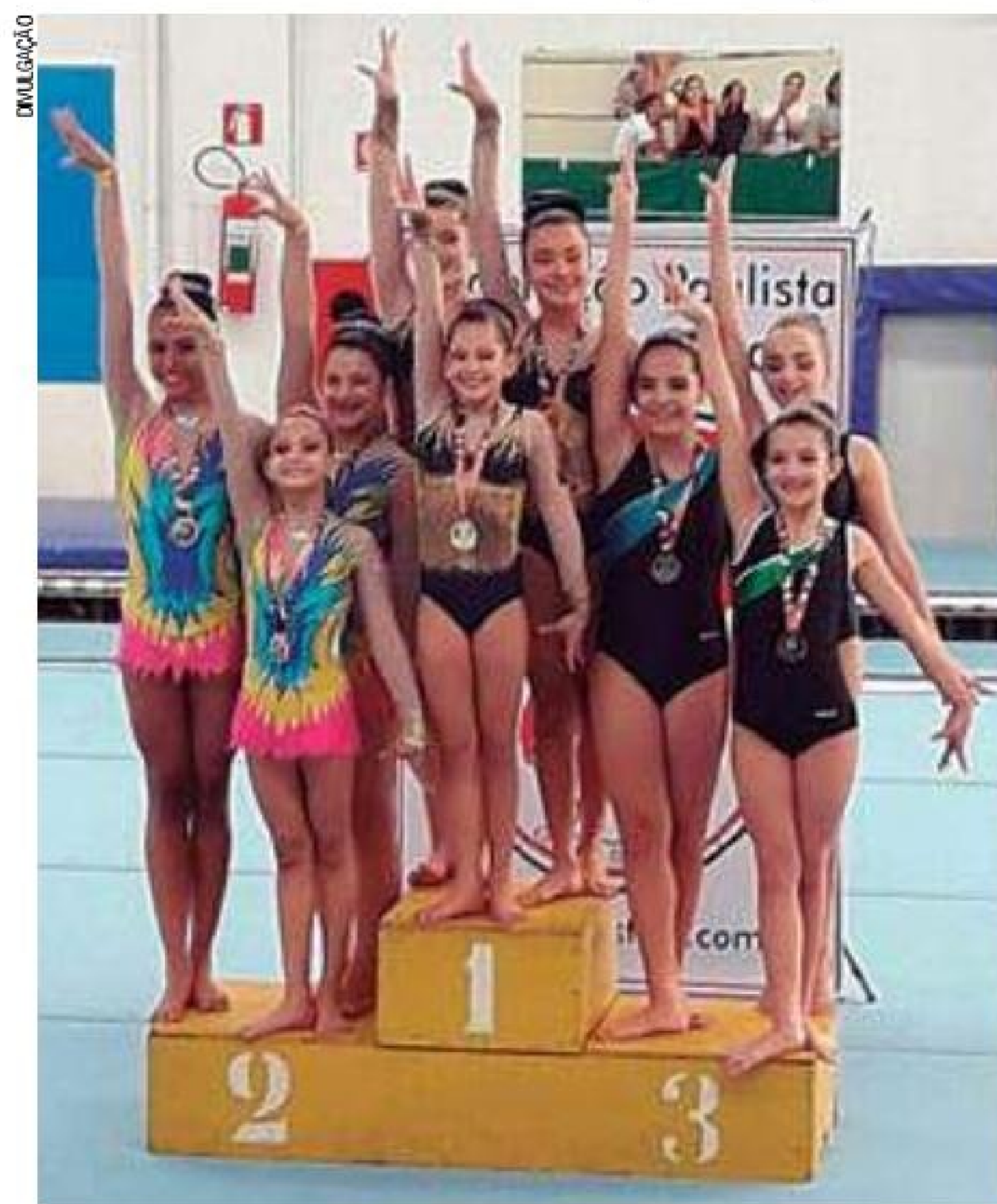
Futuro - Equipe de Guarulhos tem belo trabalho na formação de ginastas

No Estadual, Guarulhos foi vice-campeão por equipe, subindo no pódio quatro vezes. Na dupla feminina, categoria de 9 a 15 anos, a equipe ficou com a prata e o bronze. No trio feminino, de 9 a 15 anos, a cidade ficou na segunda colocação, e na categoria de 12 a 18 anos faturou o ouro. (DA REDAÇÃO)