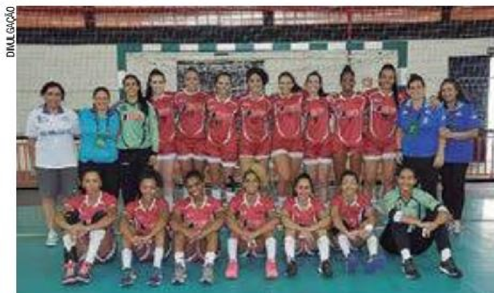
Esforço - Meninas do handebol ficaram com a medalha de prata