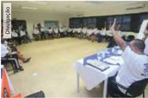
Durante 2 dias de seminário, metalúrgicos de Guarulhos reforçam ação na base