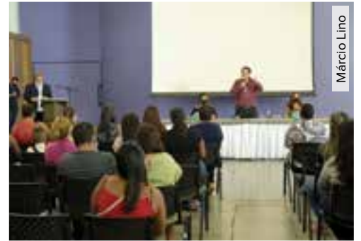
Encontro encerra 1ª turma do programa Bolsa Trabalho no município com 162 alunas