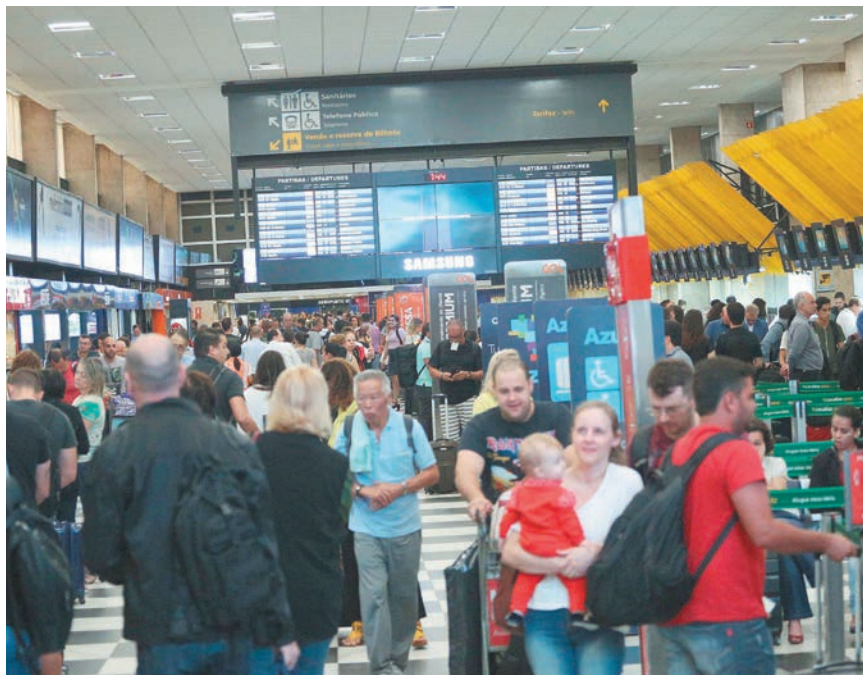
Renato S. Cerqueira/AE