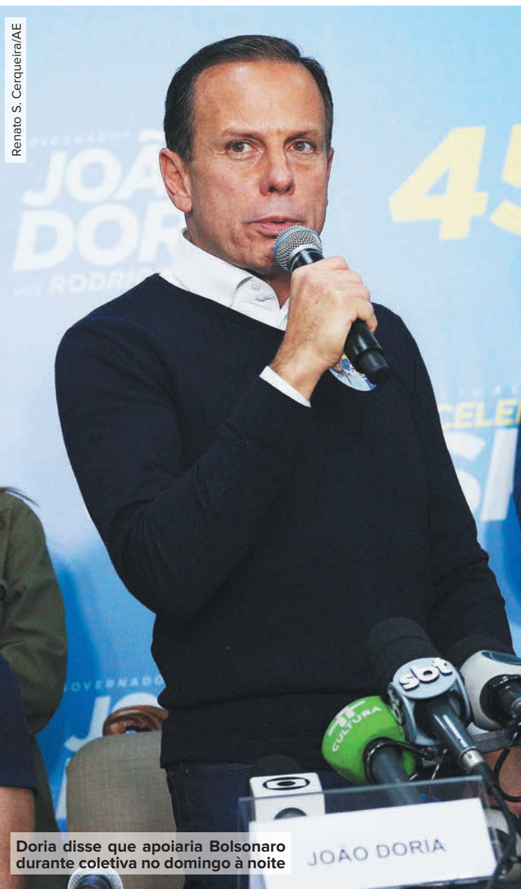
Doria disse que apoiaria Bolsonaro durante coletiva no domingo à noite