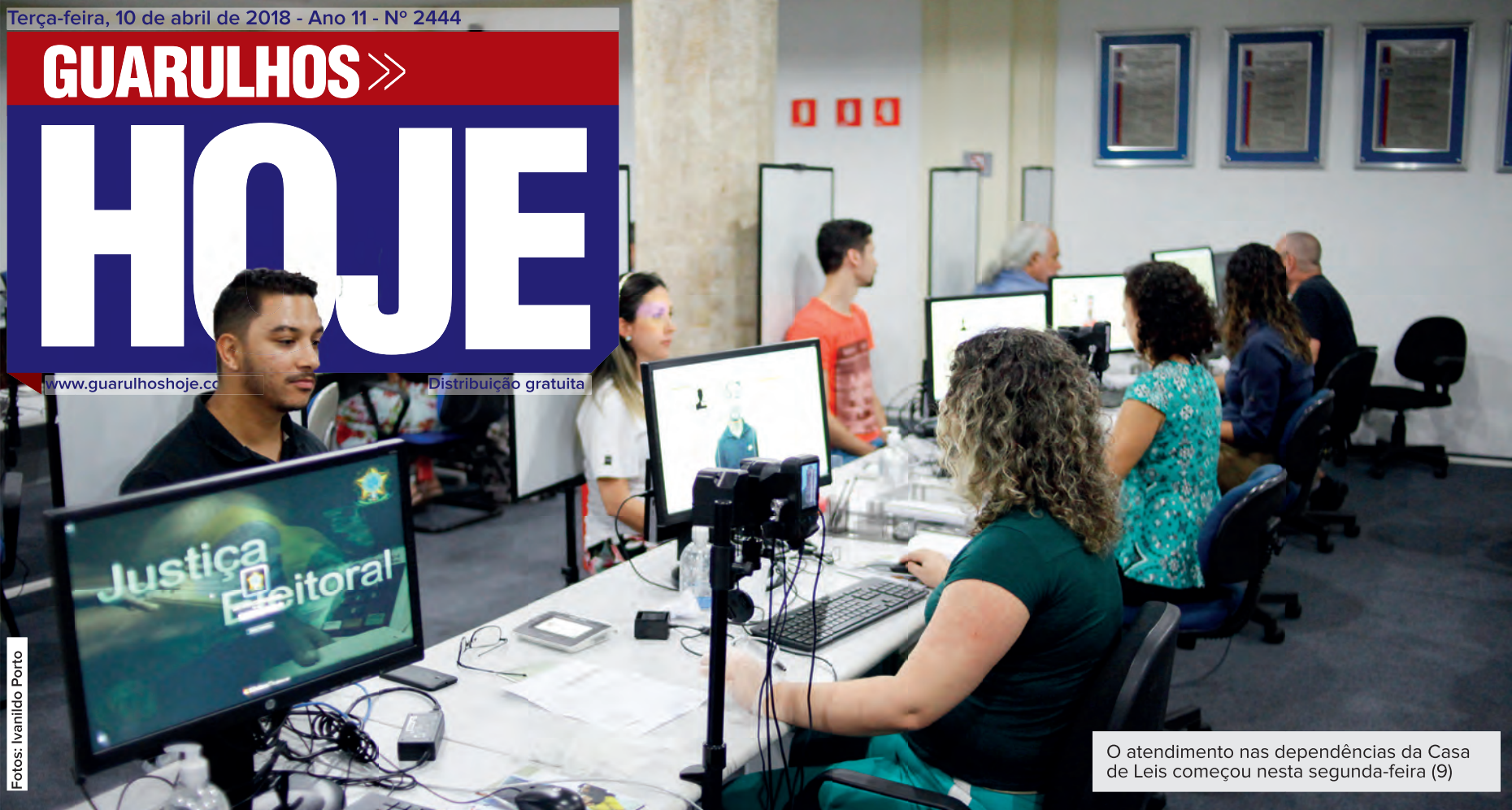
O atendimento nas dependências da Casa de Leis começou nesta segunda-feira (9)