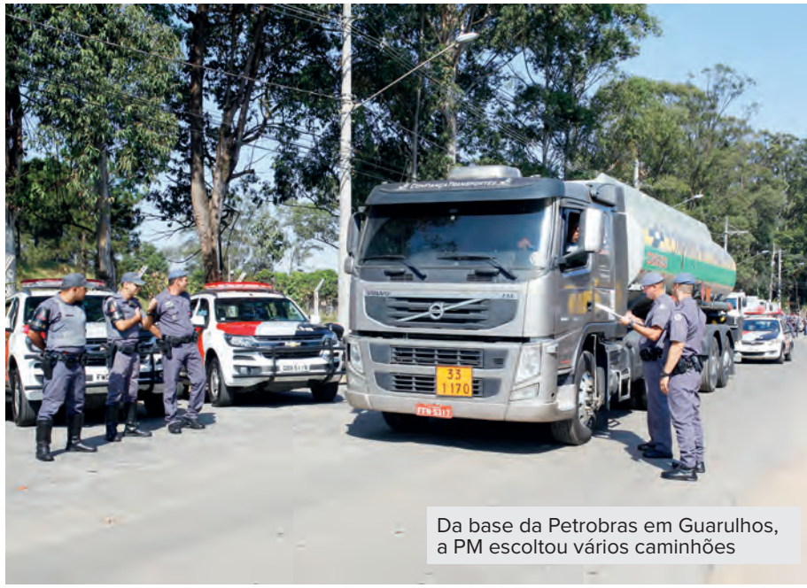
Da base da Petrobras em Guarulhos, a PM escoltou vários caminhões