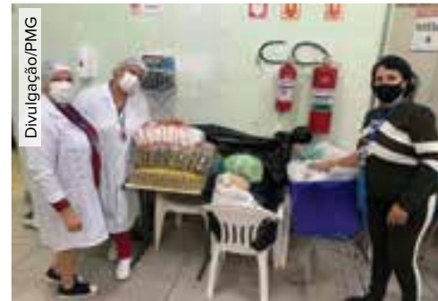
'Vacinação Solidária' recebeu 6,2 toneladas de alimentos na última semana na cidade