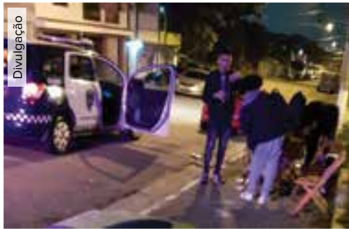
GCM atende 97 chamados de aglomeração e orienta 700 pessoas no fim de semana