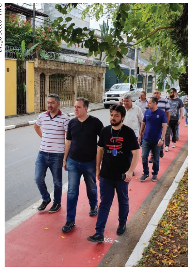
Diego Secco / PMG

Com 1,35 quilômetro de extensão, a ciclofaixa vai da avenida Francisco Conde (Lago dos Patos) até as proximidades da rua São Miguel do Araguaia. "É muito importante que as pessoas tenham mais segurança sempre. Tanto nos momentos de lazer, quanto naqueles em que precisam fazer seus deslocamentos pela região utilizando bicicleta", afirmou