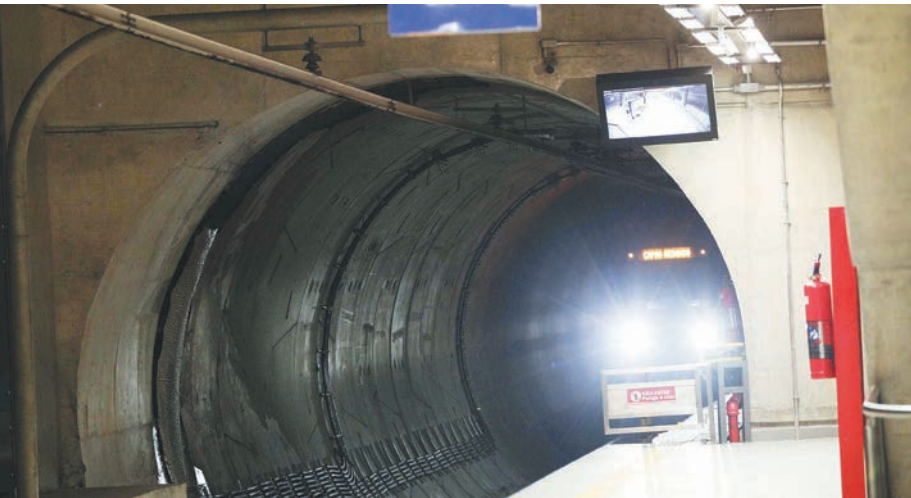
Renato S. Cerqueira/AE

Será um trecho de 8,3 quilômetros, envolvendo oito estações (Orfanato, Água Rasa, Anália Franco, Vila Formosa, Guilherme Giorgi, Nova Manchester, Aricanduva e Penha). A promessa é que essas obras comecem no ano que vem -- mas a data da entrega das novas