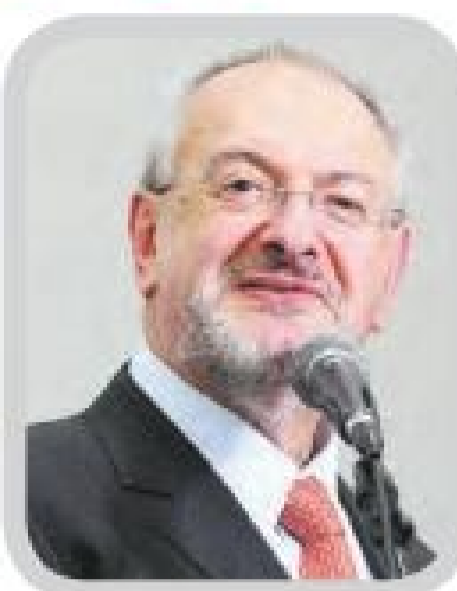
José Renato Nalini Secretário da Educação do Estado de São Paulo