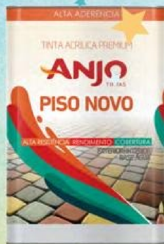
Tinta Acrílica Premium Piso Anjo 18L.