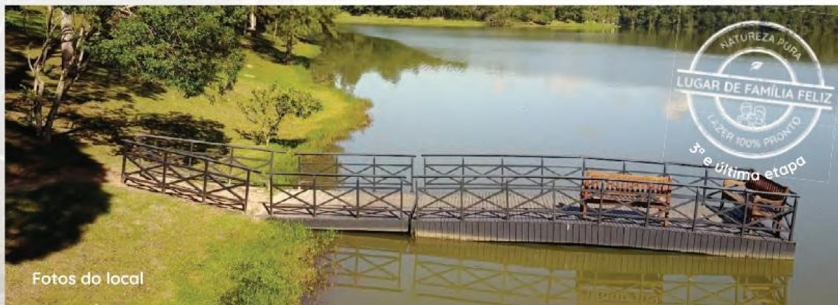
Fotos do local

Entre Arujá e Santa Isabel, terrenos residenciais a partir de 800m 2 , a poucos minutos do centro de Guarulhos