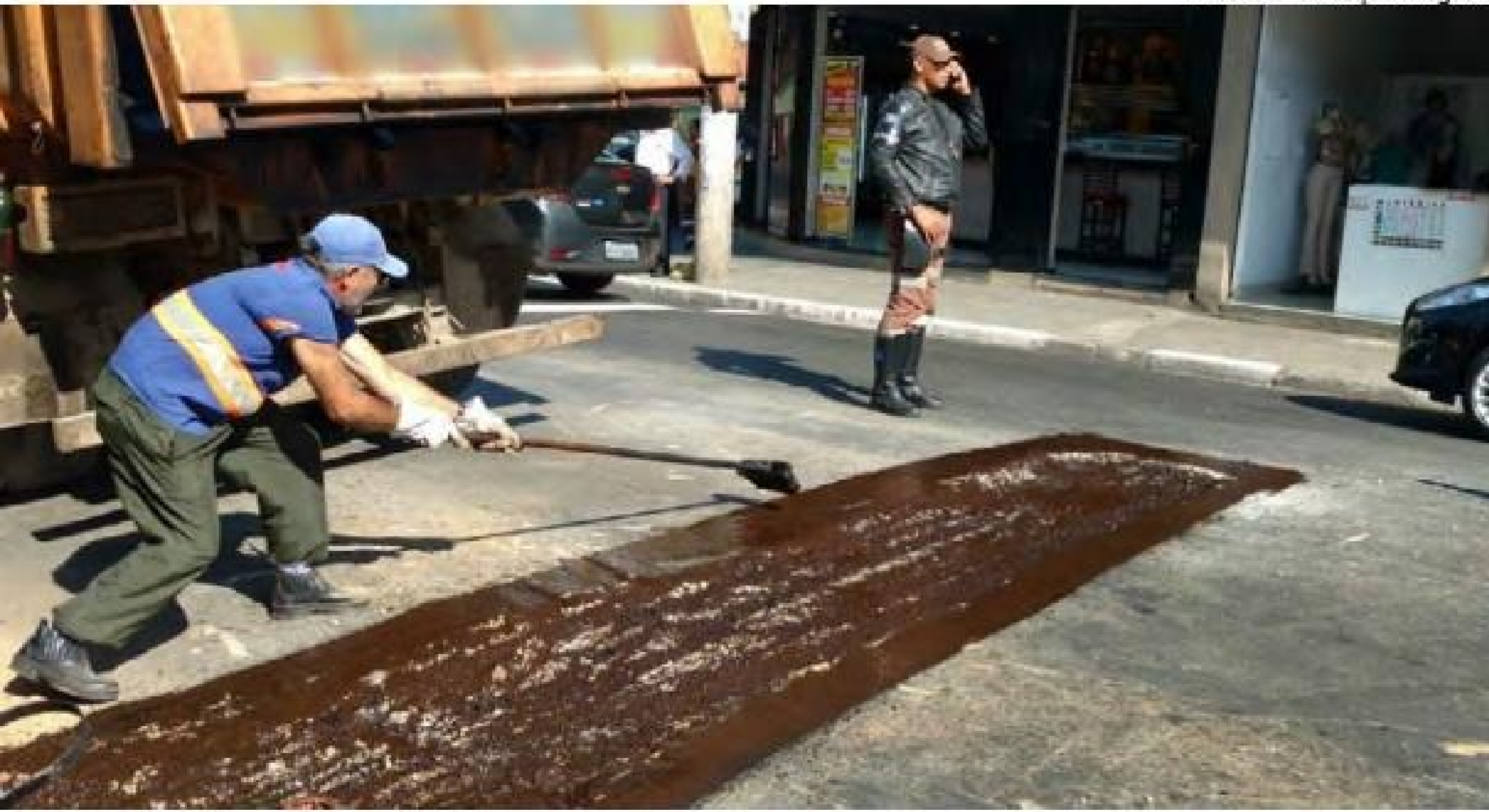
BURACO: Equipe realizou manutenção na rua Nossa Senhora Mãe dos Homens, Centro

Com o apoio dos agentes da Secretaria de Trânsito e Transportes (STT), a Proguaru (Progresso e Desenvolvimento de Guarulhos S/A) realizou na manhã desta quarta-feira, 18, manutenções de vias por meio do serviço de tapa-buracos, na rua Nossa Senhora Mãe dos Homens, Vila Progresso. Outras seis ruas receberam as mesmas ações.