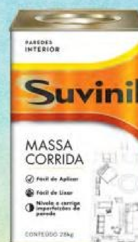
Massa Corrida Suvinil 28kg