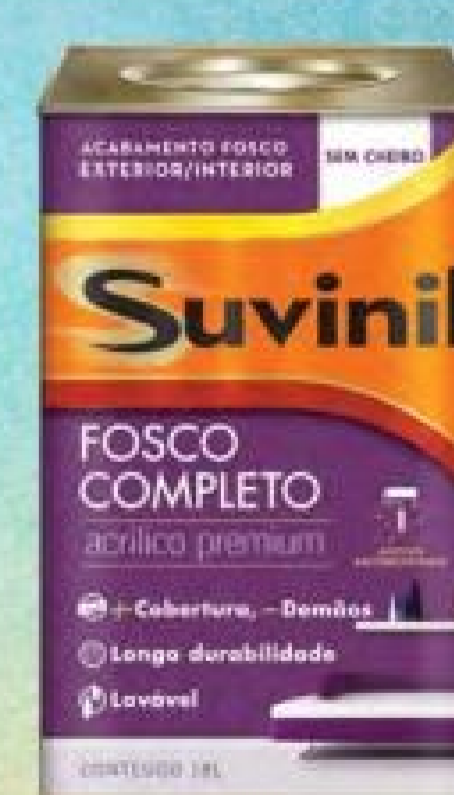
Suvinil Acrílico Fosco Completo Premium Branco 18L.