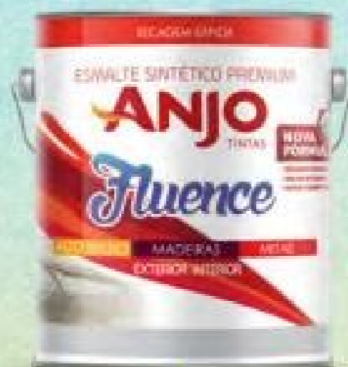
Esmalte Sintético Premium Brilhante Anjo 3,6L.