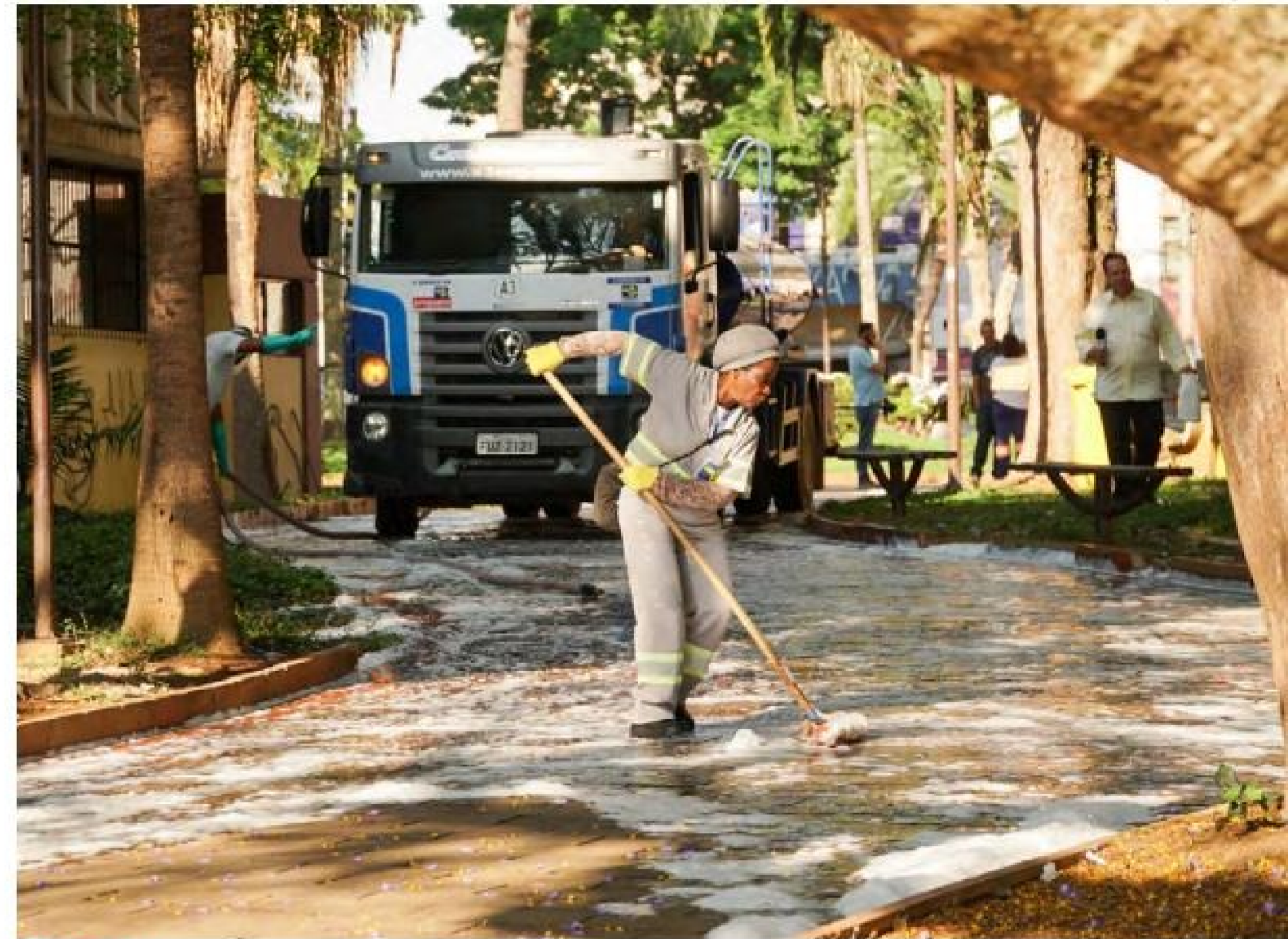
ZELADORIA: Produto utilizado tem a capacidade de eliminar odores do ambiente

Os cidadãos também podem acompanhar os trabalhos realizados diariamente pela empresa por meio do site: www.proguaru.com.br clicando no canal "Programação Diária".