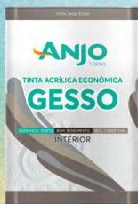
Tinta Acrílica para Gesso Anjo 18L.