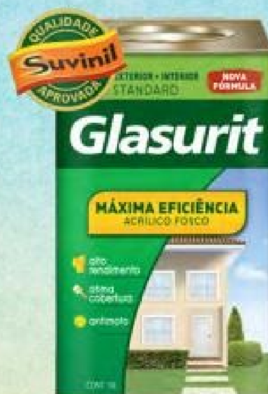
Glasurit Acrílico Máxima Eficiência Branco 18L.