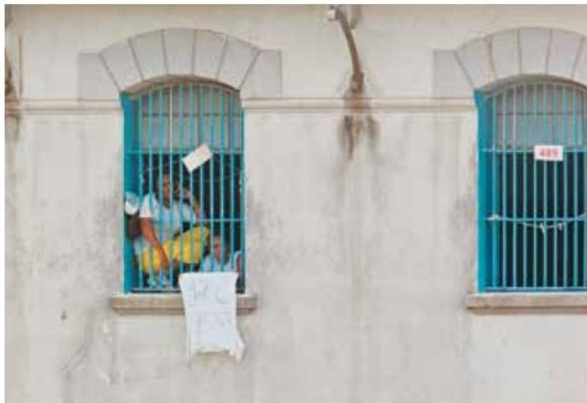
Márcio Fernandes de Oliveira/AE

Com a implosão de parte dos pavilhões, o antigo complexo hoje reúne o Parque da Juventude, a Biblioteca São Paulo, a ETEC Parque da Juventude, onde foi instalado o Centro Memória Carandiru em 2018, e o Museu Penitenciário Paulista.