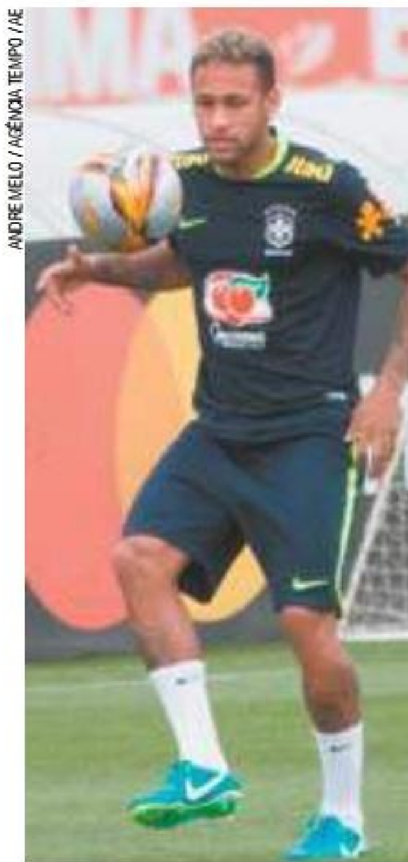
Preservação - Neymar é aposta do Brasil para vencer a Bolívia

Não haverá nenhum treino em solo boliviano. O técnico Tite fará a preleção no hotel em Santa Cruz de la Sierra, na manhã de quinta-feira, e, na sequência, a equipe viaja a La Paz. O jogo começa às 17h. (AGÊNCIA ESTADO)