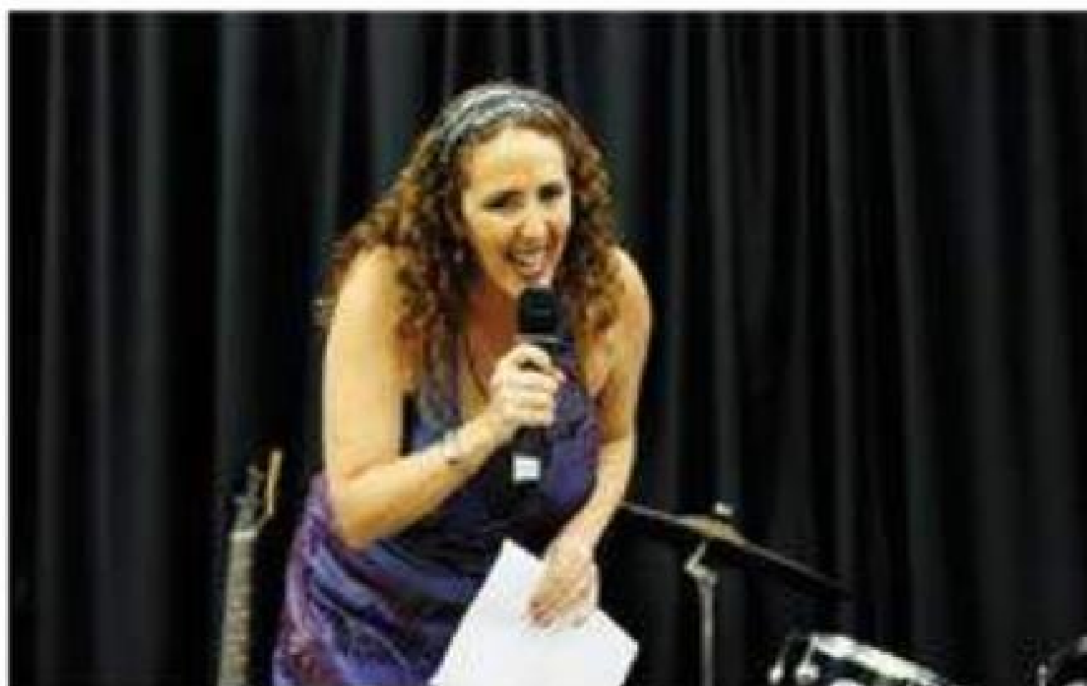
Sánchez: “Saber Inglês valoriza o currículo, aumenta as oportunidades no mercado de trabalho”

Inscrições abertas para novas turmas no Projeto Inglês para São Paulo