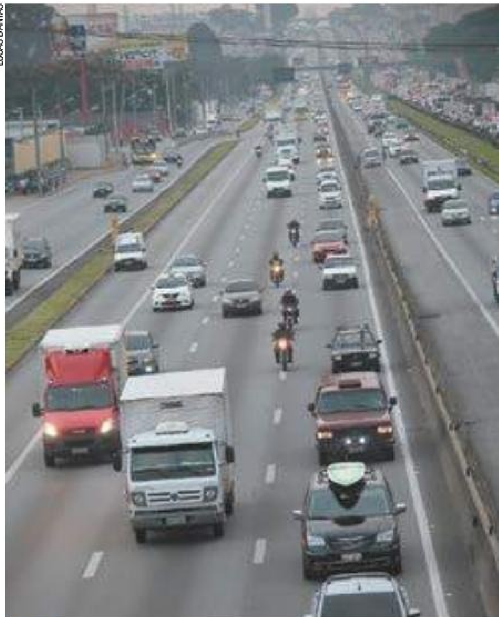
Perigo - Veículo com problema (à esq.) para no acostamento na Via Dutra