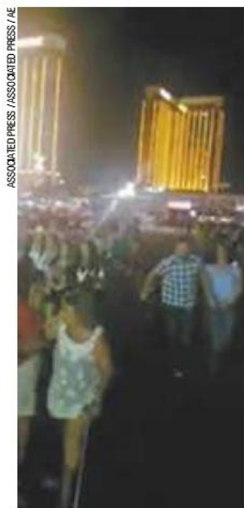
Medo - Multidão corre de atirador que estava no prédio do fundo