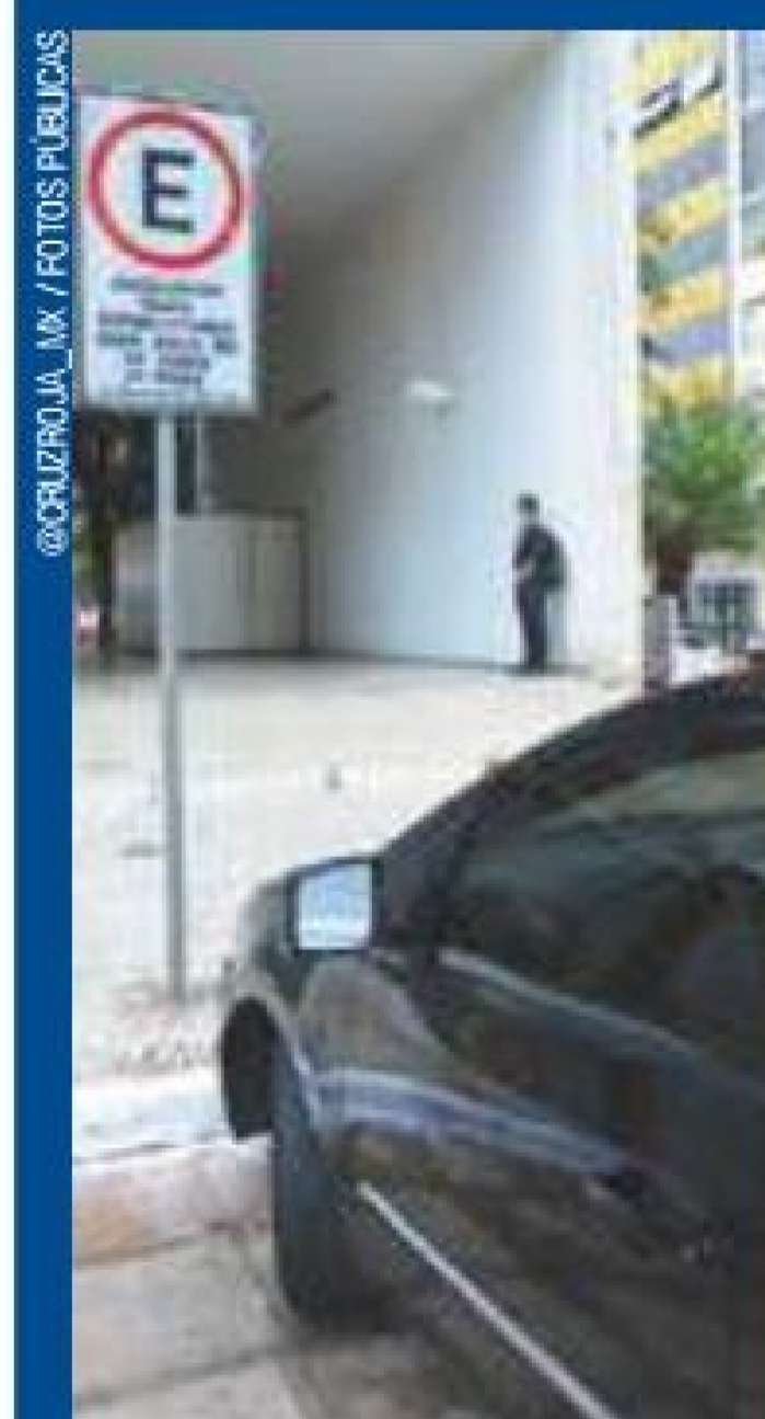
Illegal - Vagas reservadas não são respeitadas na Capital

Prefeitura flagra motoristas que estacionam em vaga especial Pág. 3