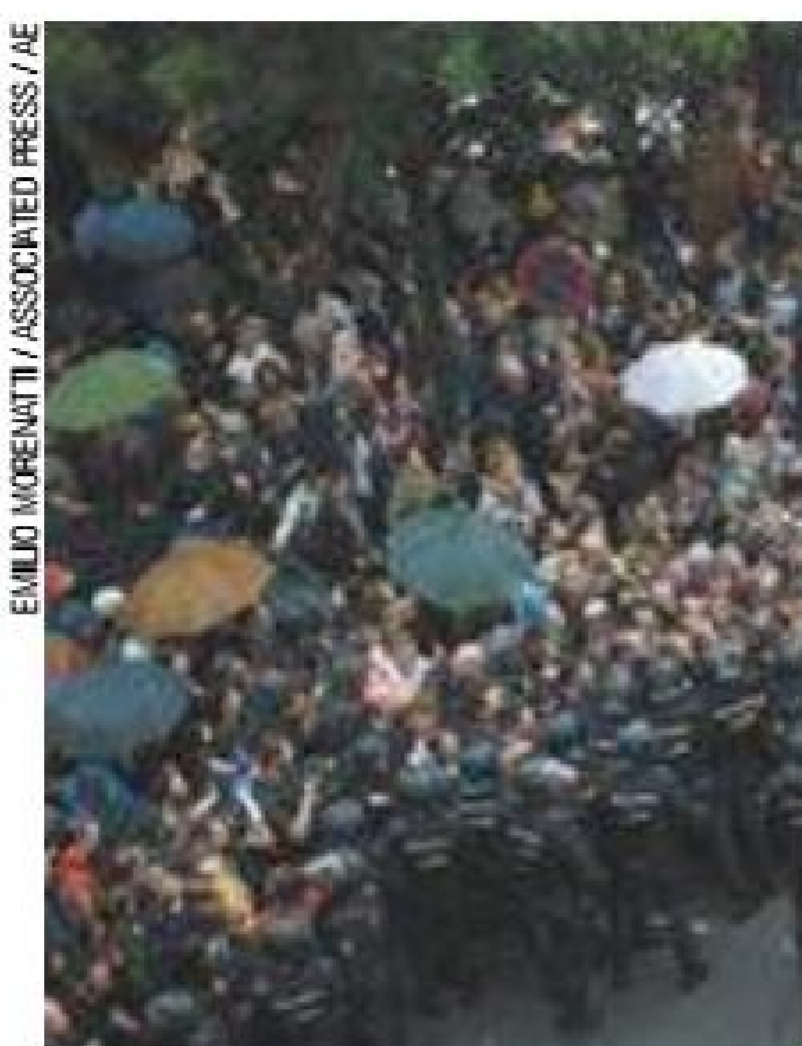
Tensão - Policiais impedem fluxo de manifestação pró-independência

O líder do Partido Socialista Operário Espanhol (PSOE), Pedro Sánchez, se reuniu com o primeiro-ministro Mariano Rajoy e defendeu a abertura de negociações com o governo autônomo. A União Europeia e a ONU