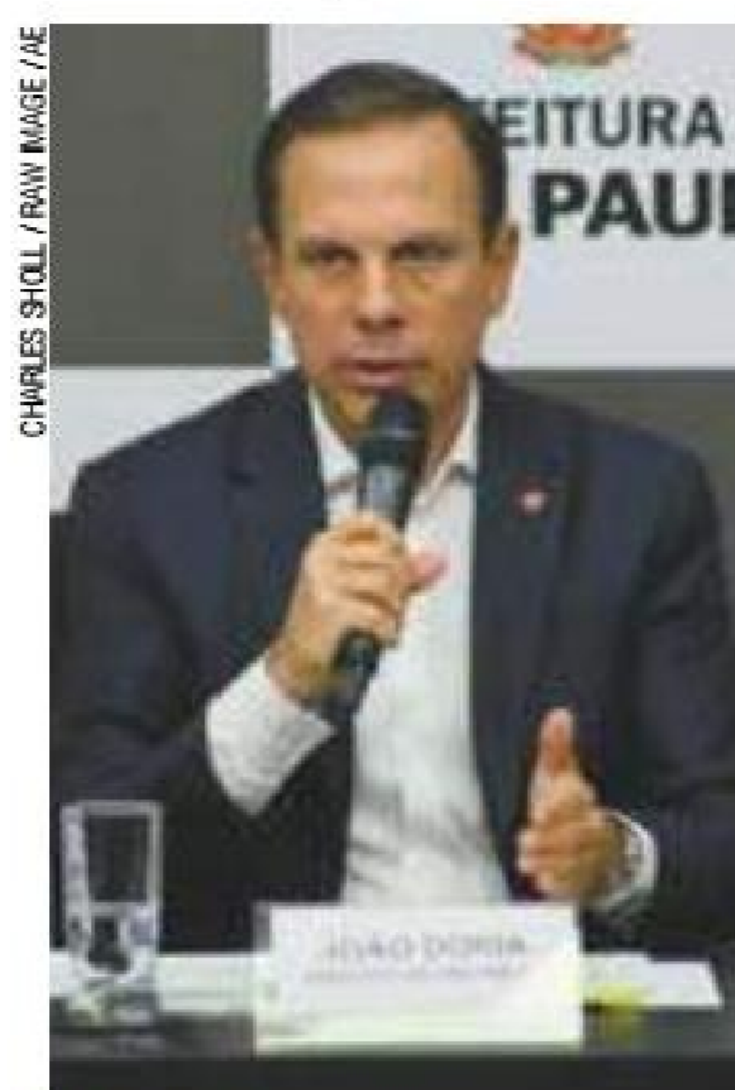
Estratégia - Em ano eleitoral, Doria infla orçamento com investimentos

Para alavancar os investimentos em 2018, a aposta é na alta da arrecadação com impostos, empréstimos e o plano de concessões e privatizações, que inclui o Pacaembu e o Anhembi.