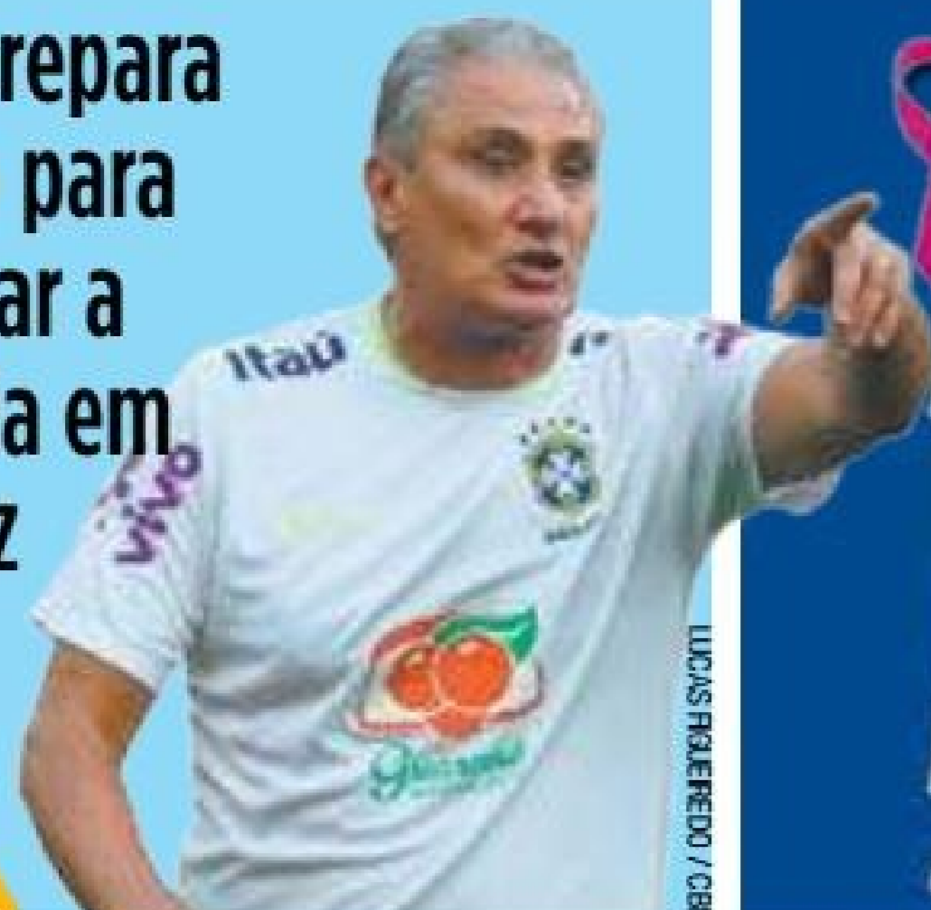
LUCAS FLEITERO / CBF

Tite prepara plano para encarar a Bolívia em La Paz