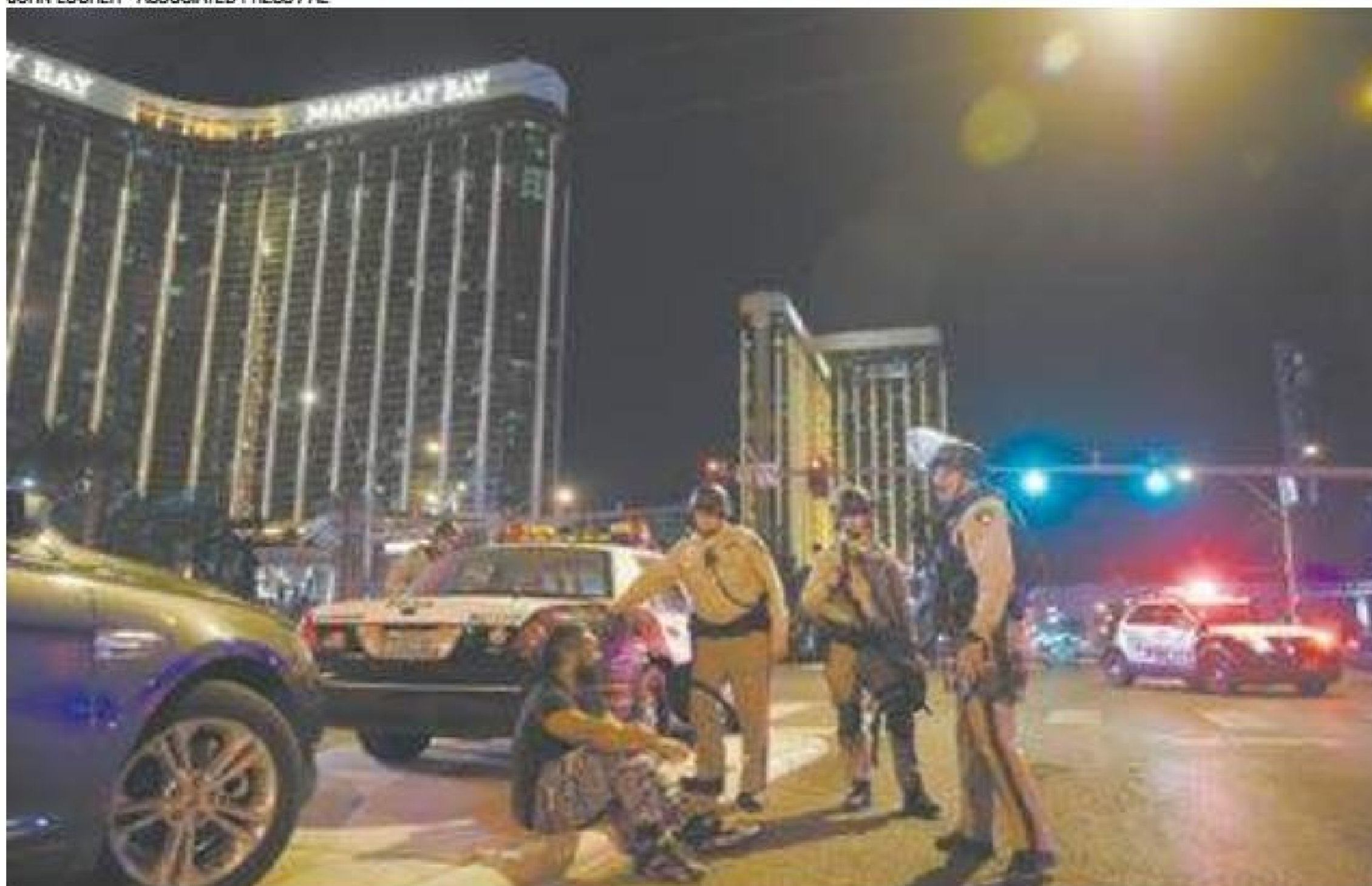
Pânico - Milionário escolheu apartamento de luxuoso hotel para disparar em frequentadores de show