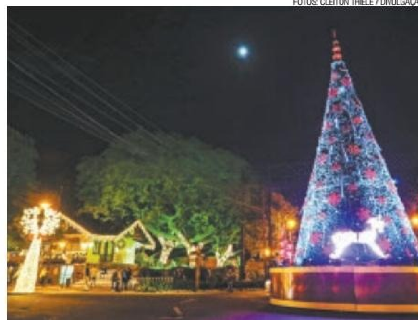
Acolhedora – Decoração natalina encanta turistas que vão a Gramado