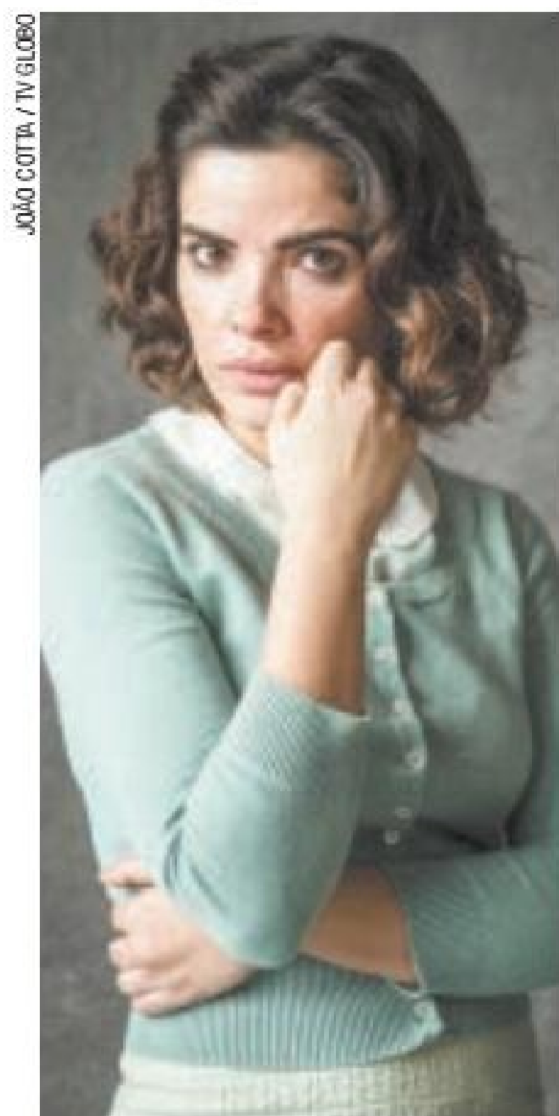
Decepção – Stela voltará a se embriagar por causa de problemas

O padre mandará elas discutirem fora da igreja. Lá, as mulheres trocarão empurrões. Aranha apartará o bate-boca. (RAPHAEL POZZI)