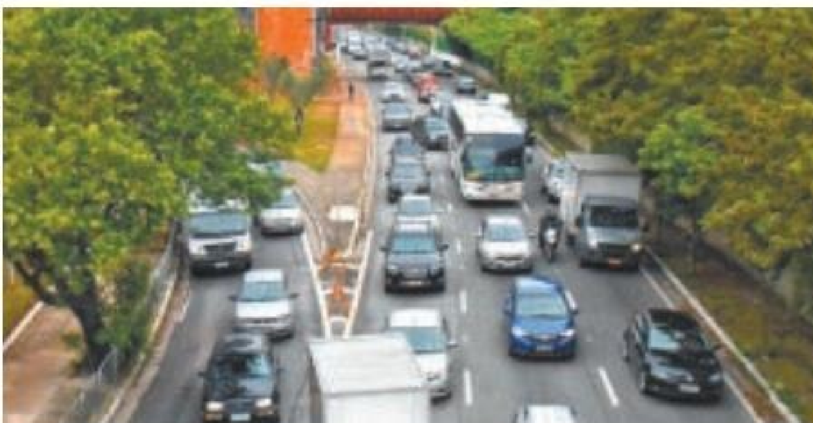
Sufoco – Motoristas seguem com dificuldades na Marginal do Pinheiros

afirmou que descarta a demolição do viaduto.