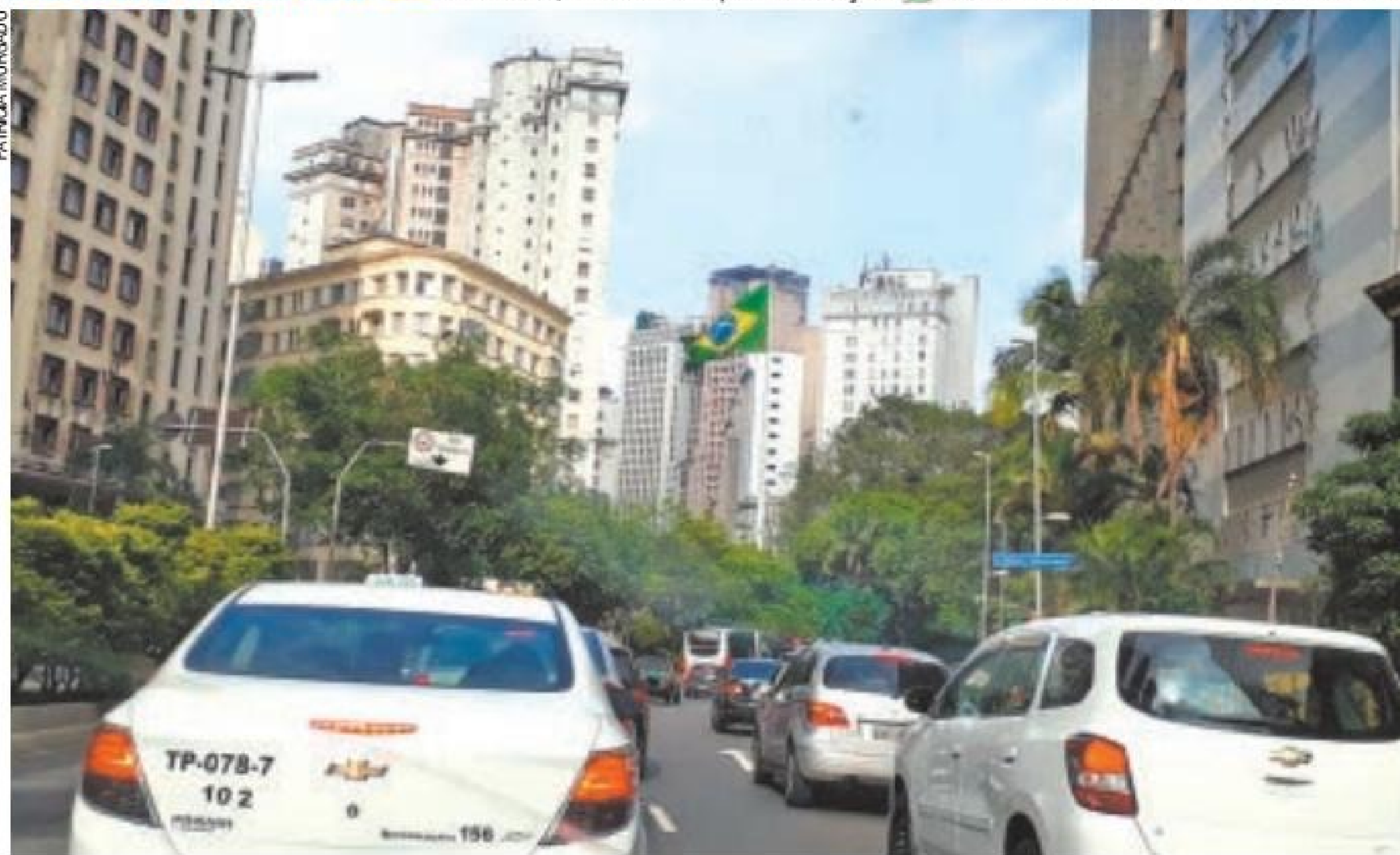
Pauliceia - O trânsito nosso de cada dia da Avenida Nove de Julho, em direção à Praça da Bandeira, no Centro

Caro leitor, envie sua foto para esta seção: 94021-9397 ou redacao@metronews.com.br