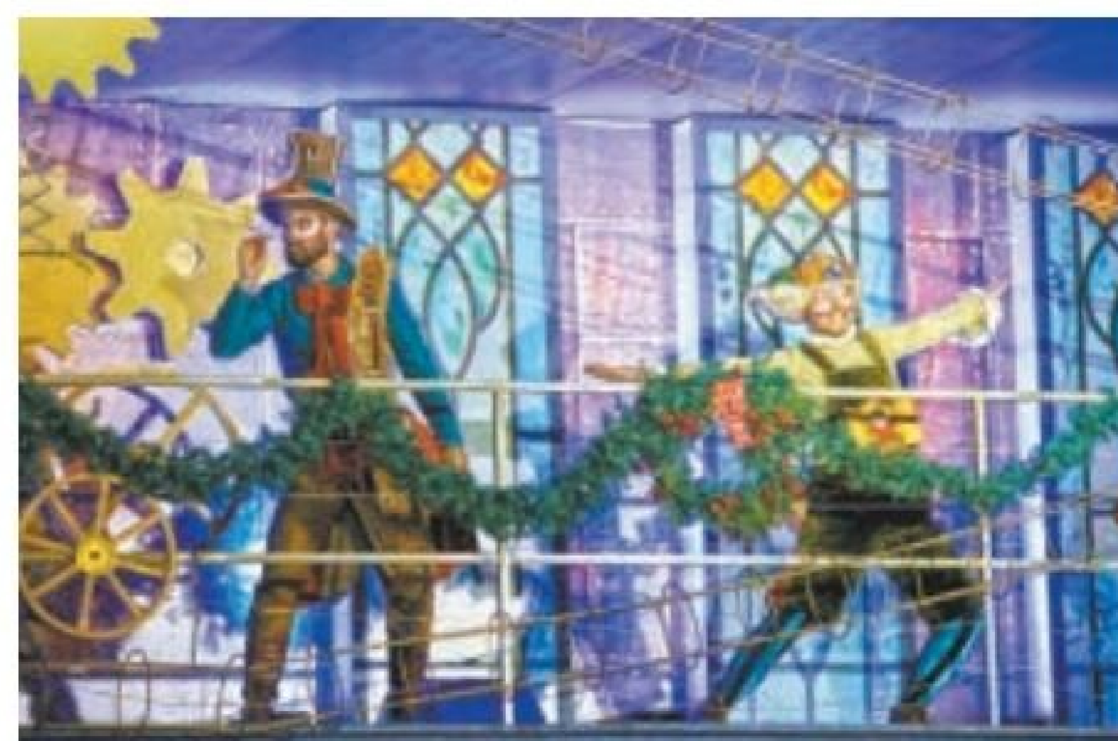
Magia – Personagens pedem energia positiva para acender luzes de Natal