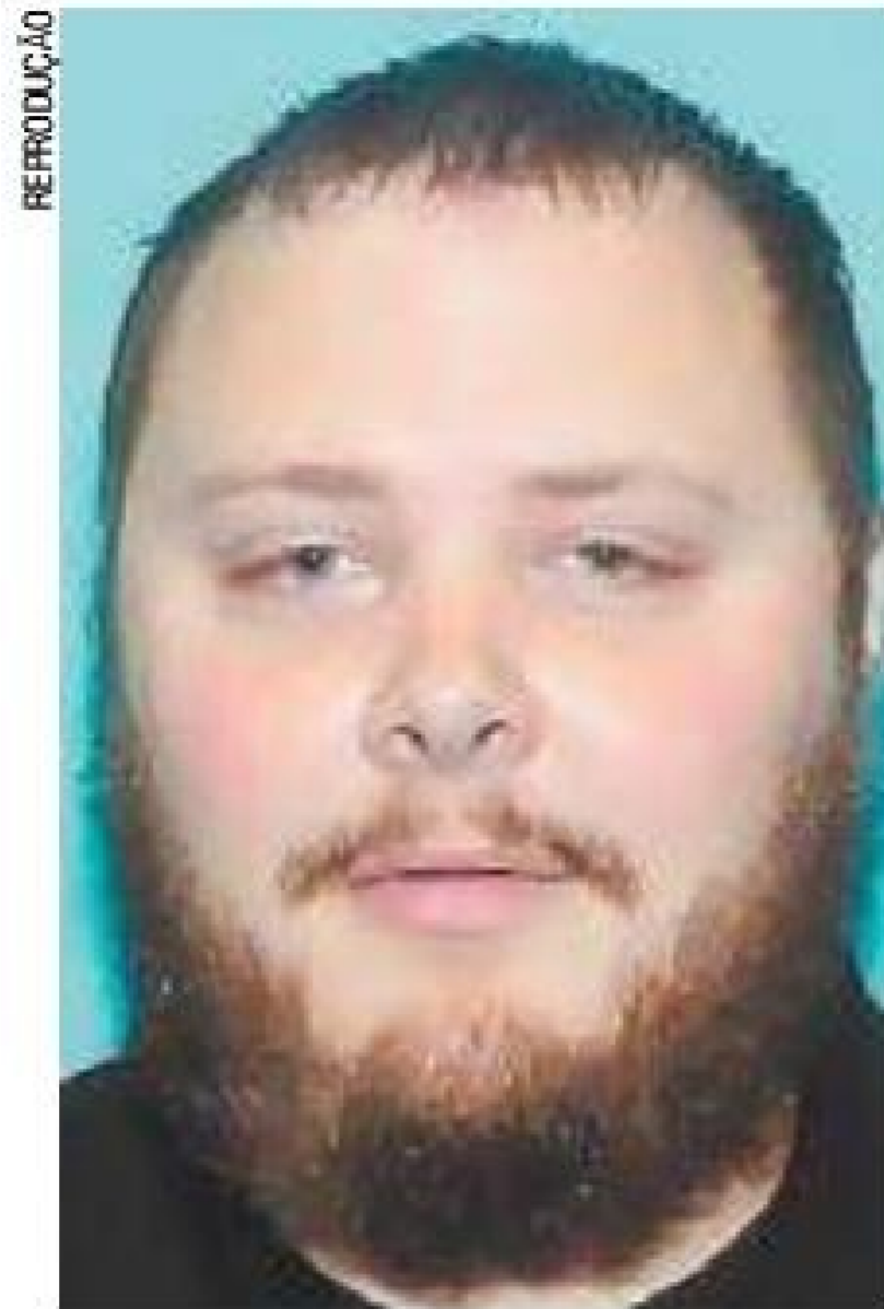
Suicídio - Homem teria tirado a própria vida após atentado