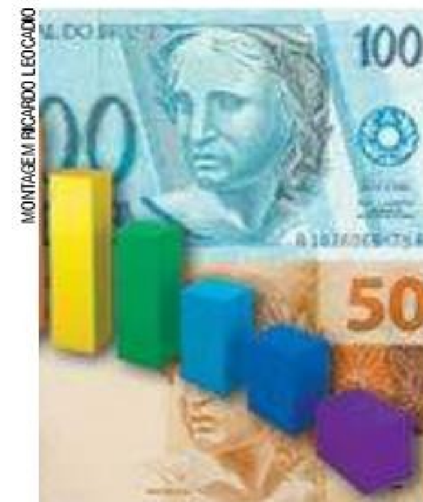
Cálculo - Para alcançar meta, BC usa taxa básica de juros, a Selic

Para alcançar a meta, o BC usa como principal instrumento a taxa básica de juros, a Selic, atualmente em 7,5% ao ano. A expectativa