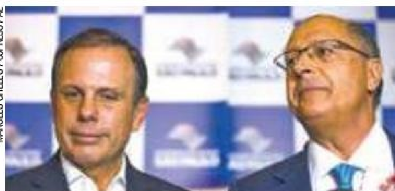
Dobradinha Aliança seria feita para atingir a Lula e a Jair Bolsonaro

O prefeito de São Paulo, João Doria (PSDB), admitiu a possibilidade de ser candidato a vice-presidente da República em uma chapa encabeçada pelo governador de São Paulo, Geraldo Alckmin (PSDB), em 2018. Em entrevista exibida na madrugada de ontem, no programa Canal Livre , da TV Bandeirantes, o tucano declarou que “tudo é possível”. Ele voltou a defender que só uma aliança partidária de centro encabeçada pelo PSDB seria capaz de derrotar o ex-presidente Luiz Inácio Lula da Silva (PT)