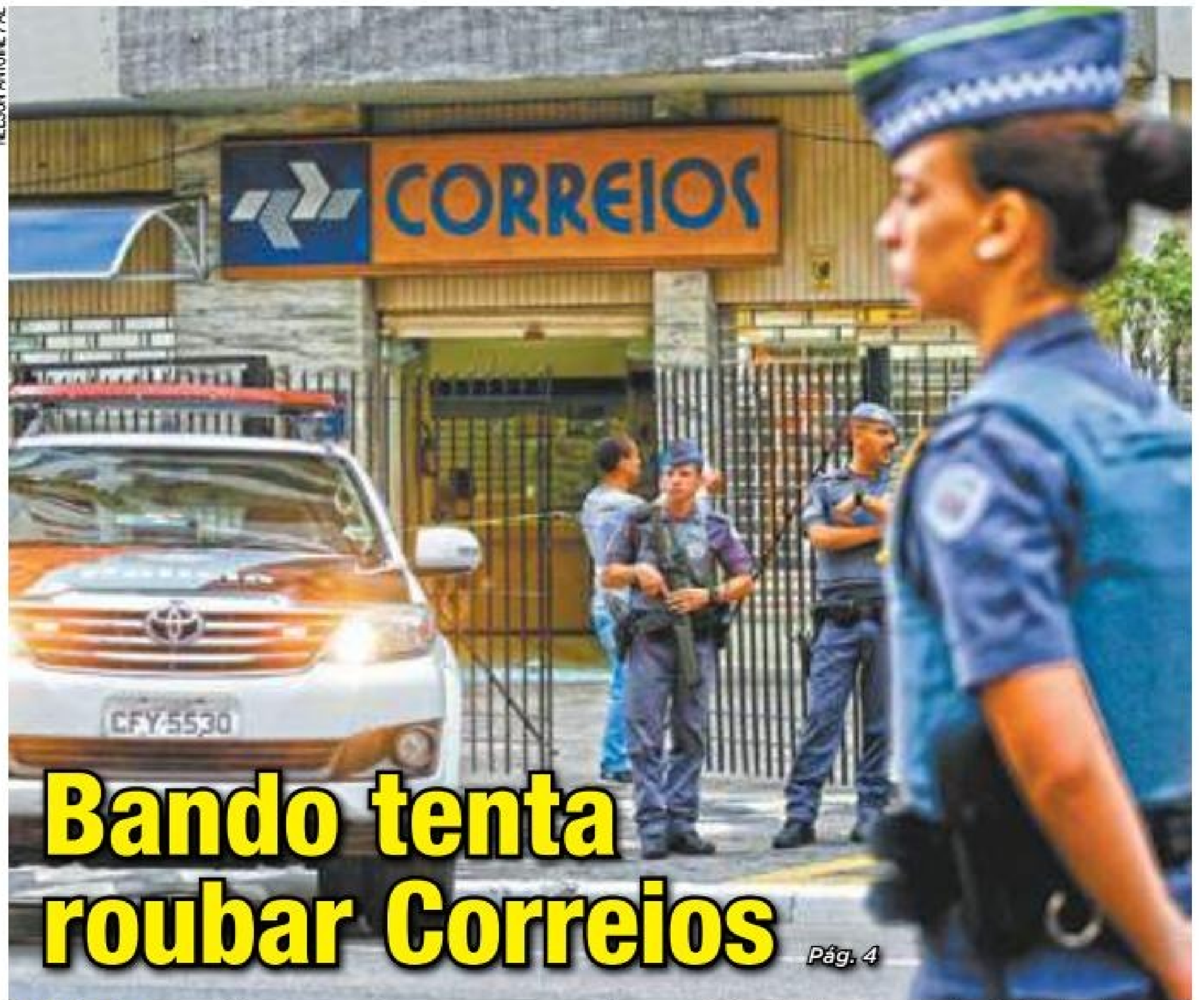
NELSON ANTONIO / AE