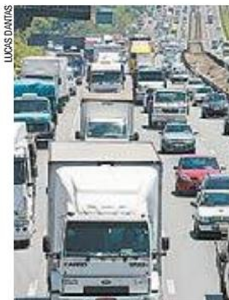
Regra - IPVA é exigência para motoristas licenciarem os veículos

Para efetuar o pagamento, basta se dirigir a uma agência bancária credenciada com o número do Renavam. Alguns bancos realizam esse procedi-