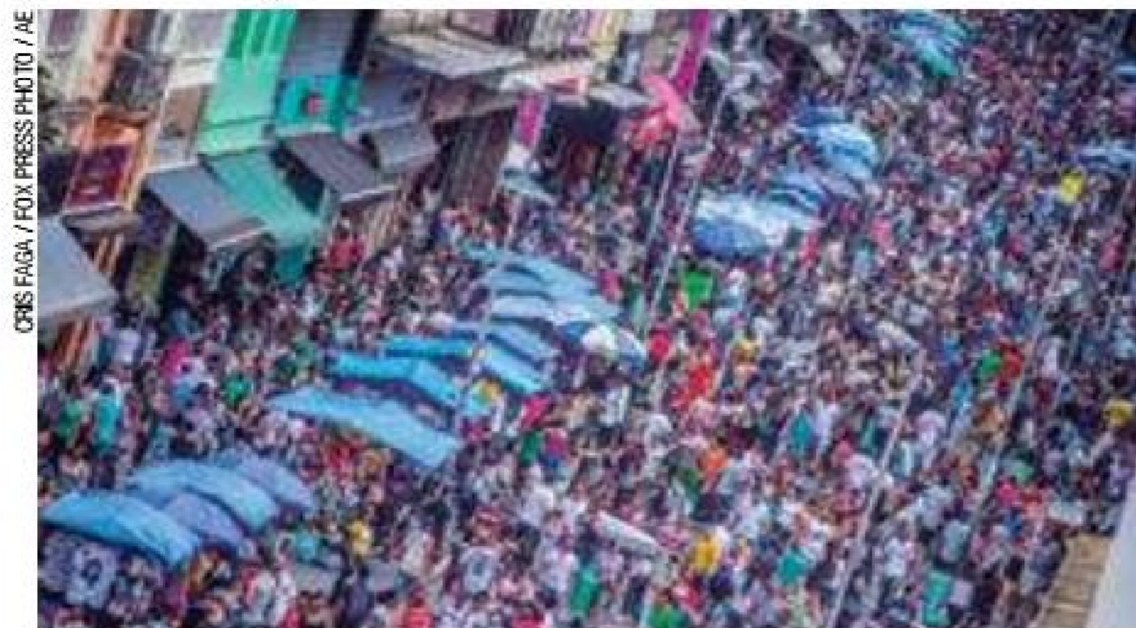
Pujante - Economia da Capital é forte, como revela a Rua 25 de Março

Apesar de a cidade não ter tido um centavo sequer, os outros municípios, em