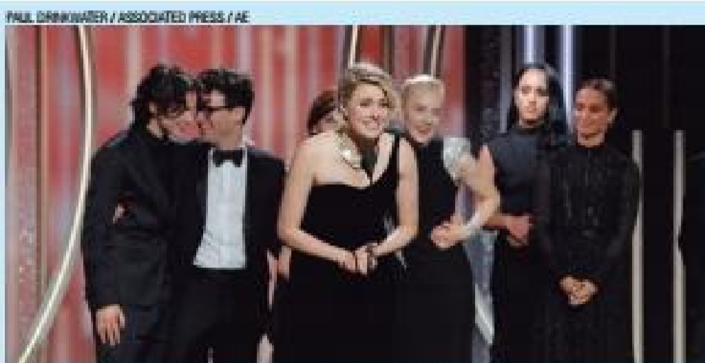
Vitória - Greta Gerwig, diretora de Lady Bird: A Hora de Voar , melhor comédia