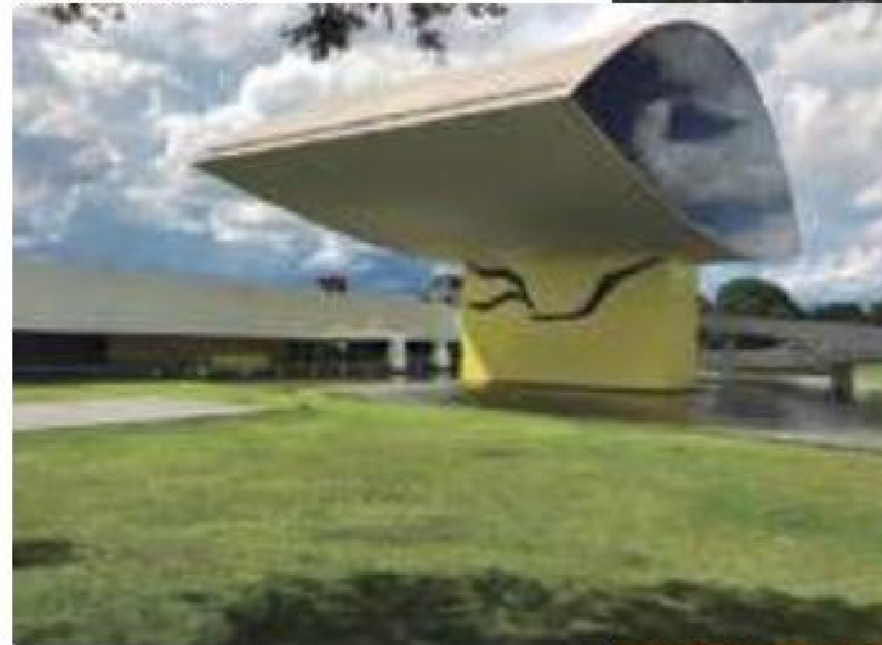
Arquitetura – Museu Oscar Niemeyer é parada obrigatória