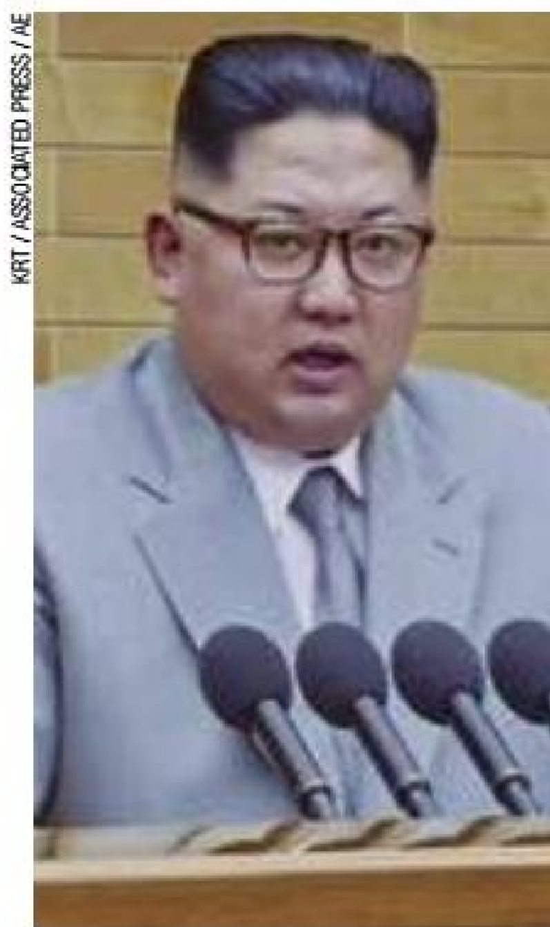
Demorou - Kim Jong-Un aceitou conversar com a rival Coreia do Sul