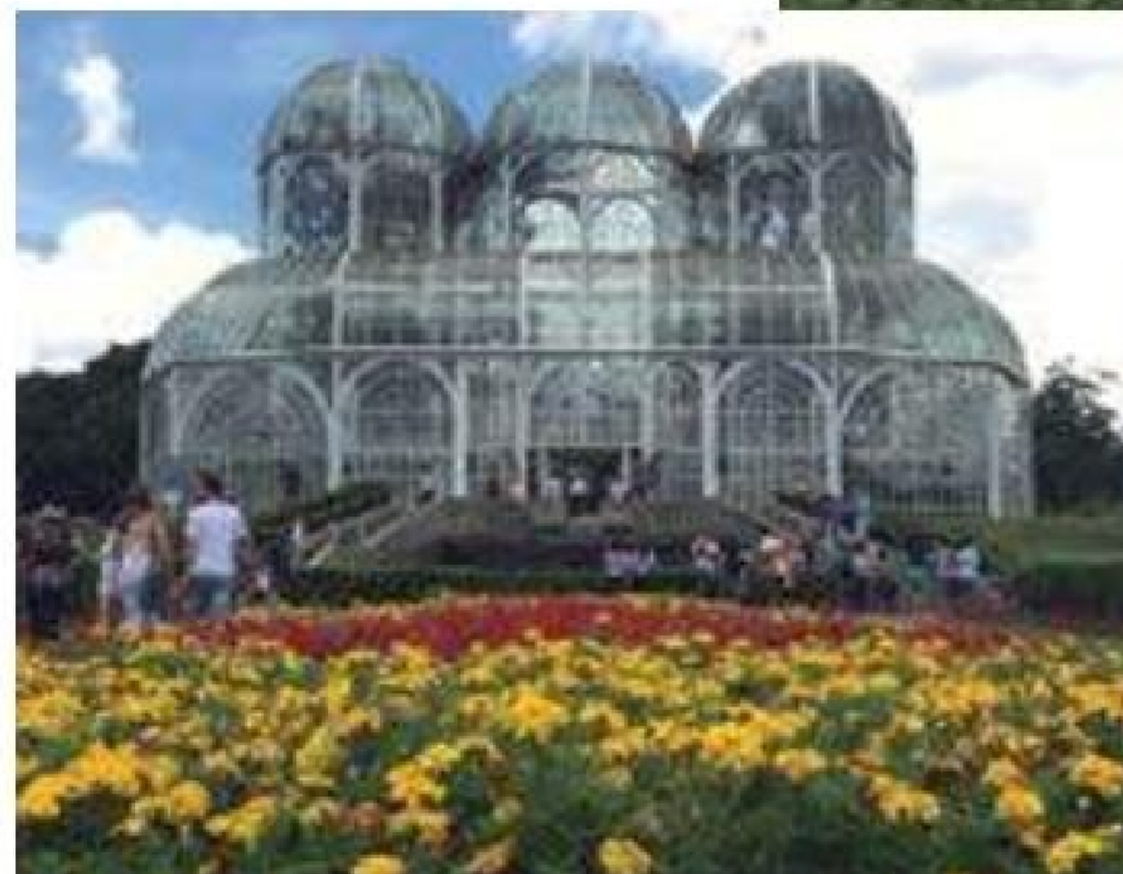
Jardim Botânico – Local possui grande diversidade de plantas