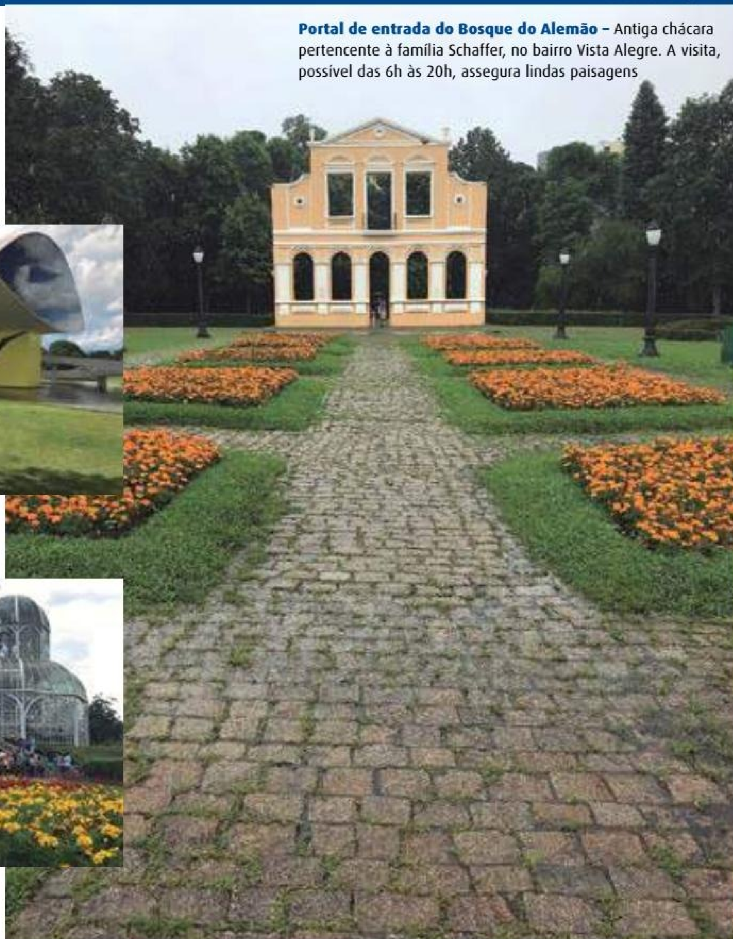
Portal de entrada do Bosque do Alemão – Antiga chácara pertencente à família Schaffer, no bairro Vista Alegre. A visita, possível das 6h às 20h, assegura lindas paisagens