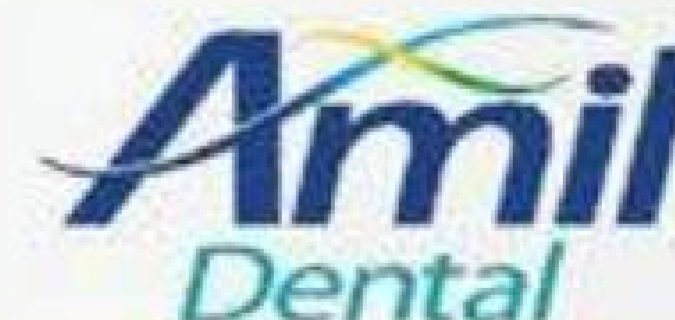
Tabela Amil Dental - Pessoa Física

Referência: Outubro/2017 - Taxa de Inscrição: Não informado