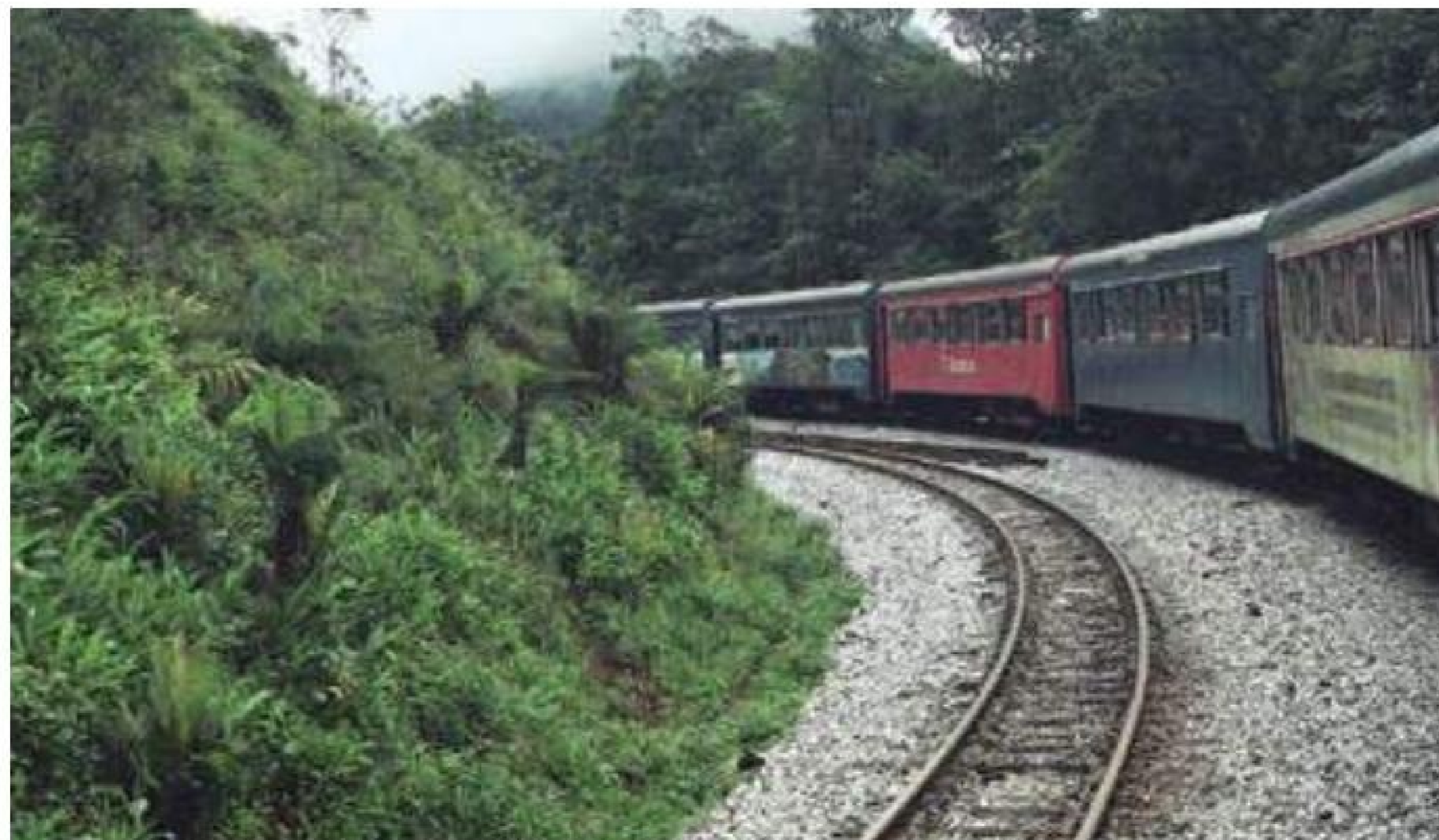
Tradicional – Passeio de trem mostra vegetação densa no trajeto entre as cidades de Curitiba e Morretes

A Praça Tiradentes, no centro de Curitiba, é o ponto de partida para um tour , feito com um ônibus de dois andares, que passa em frente às principais atrações turísticas da cidade. A viagem, que dura cerca de três horas, custa R$ 45 por pessoa. Durante o passeio é possível descer ainda em quatro pontos, para poder conhecê-los de perto, e depois embarcar em outros coletivos – que circulam por toda a manhã e tarde. (AH)