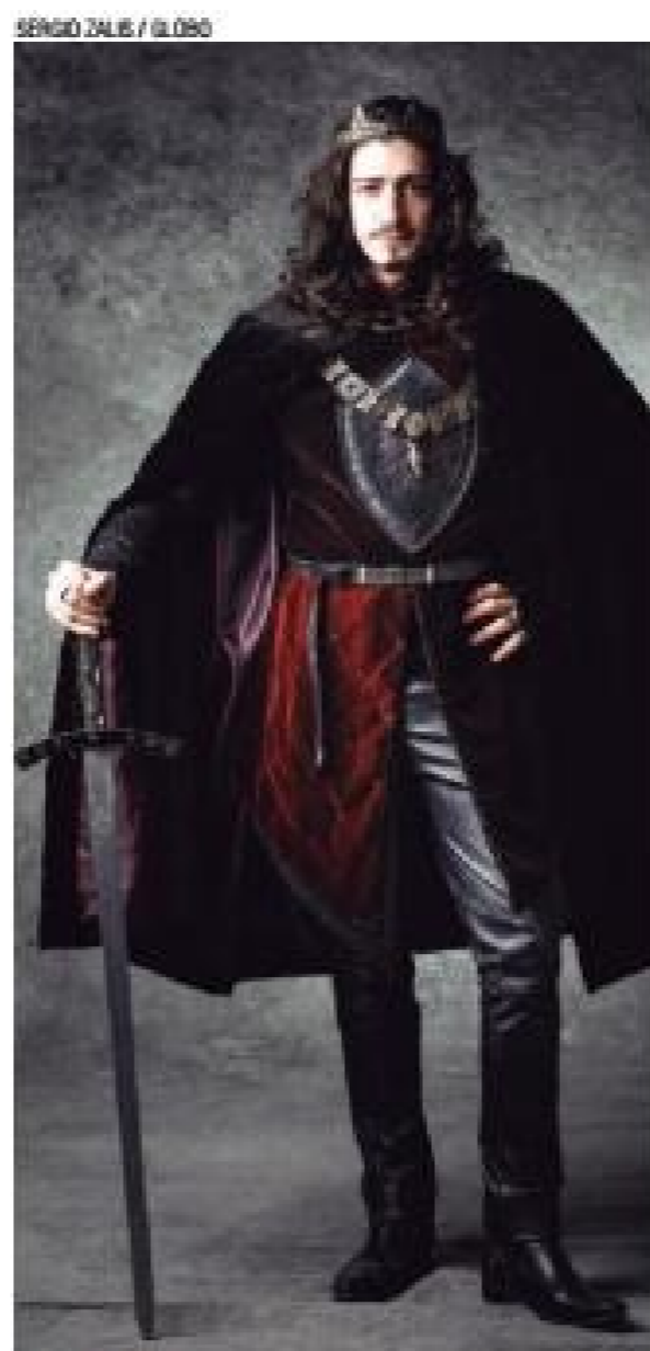
Escolha - Afonso vai ter que decidir se vira rei ou abdica do trono para viver o amor

A novela promete ainda grandes batalhas em um cenário medieval construído totalmente dentro dos estúdios da Rede Globo e pode atrair um público mais jovens, fãs de séries com temáticas que remetem a tempos antigos. Só basta agora ouvir a opinião do público após a estreia.