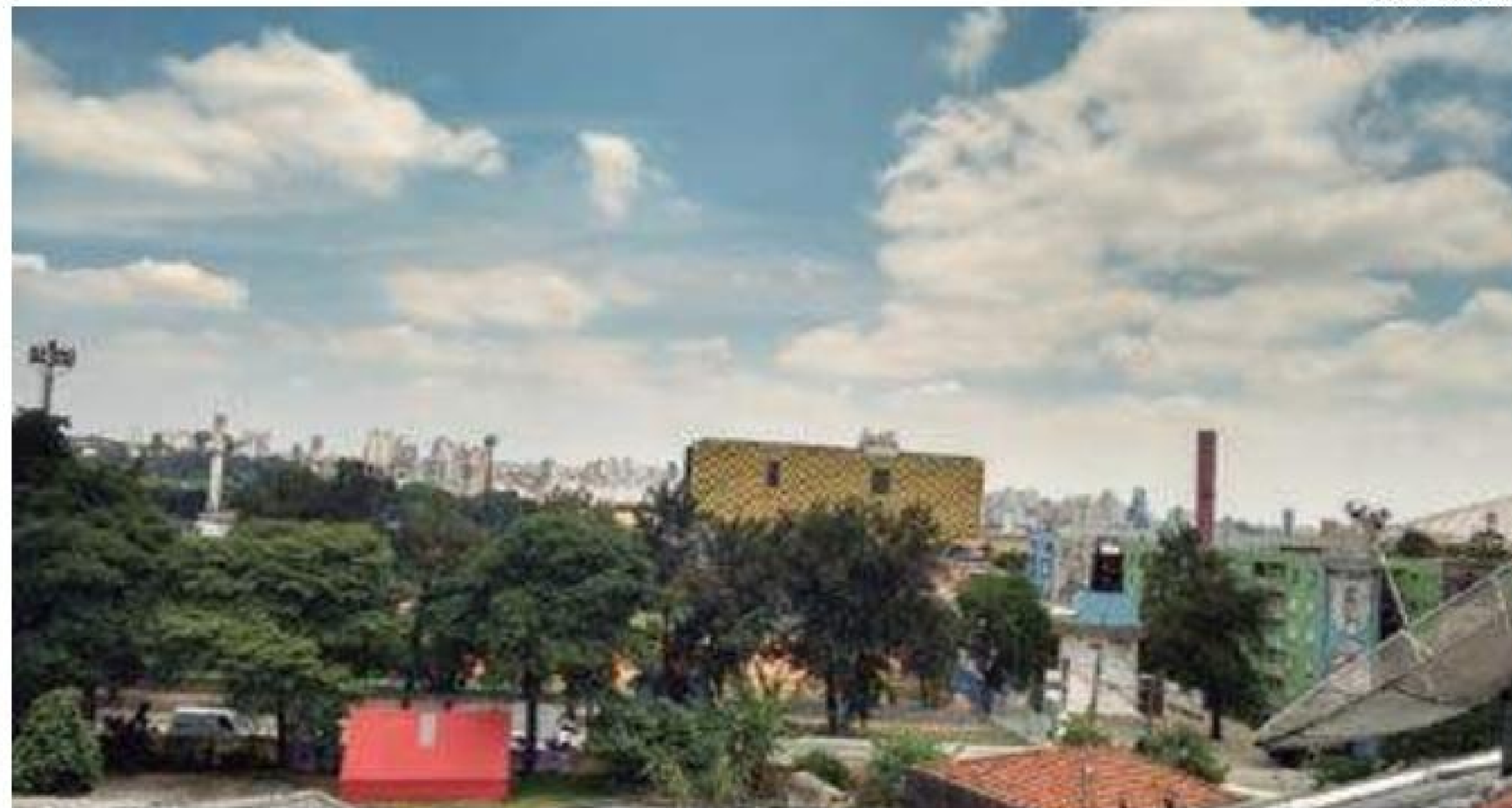
Rumo Norte – Um olhar em direção à Zona Norte da Capital, com vistas ao hotel Holiday Inn Anhembi