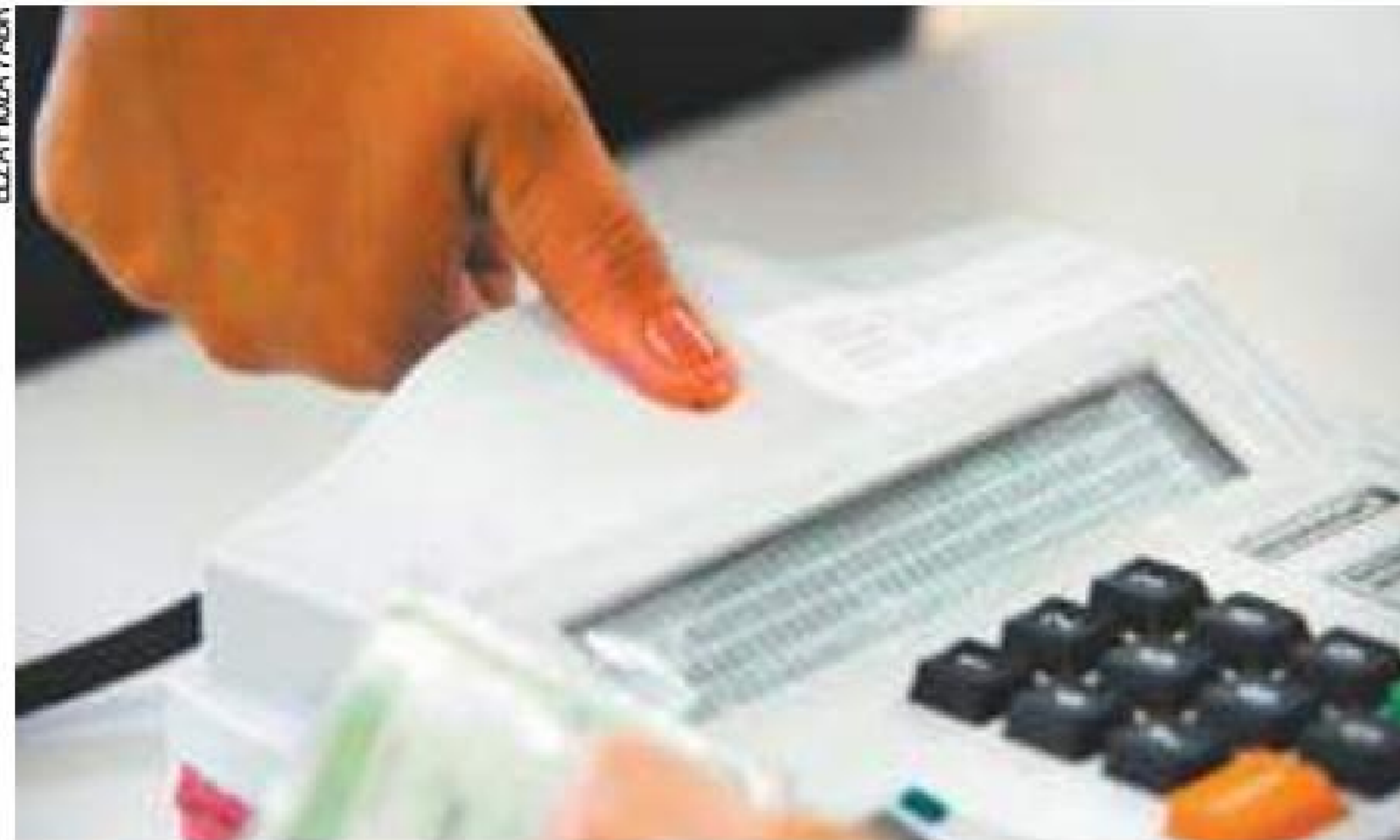
Crime - somente uma pessoa foi flagrada com 52 títulos de eleitor

Segundo o responsável pela secretaria, uma única