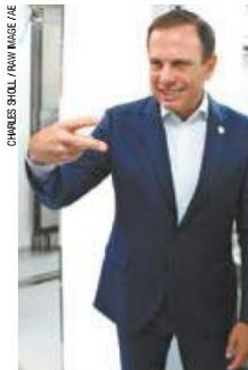
Economia - Prefeito afirmou que deputado “assusta ao mercado”

No evento religioso, Doria alfinetou Bolsonaro, que também visitou a capital paraense. Ao passo que o parlamentar prometeu que “todo brasileiro devia ter uma arma”. Já o tucano afirmou não defender que todo brasileiro tenha uma arma de fogo em casa. “Apoio