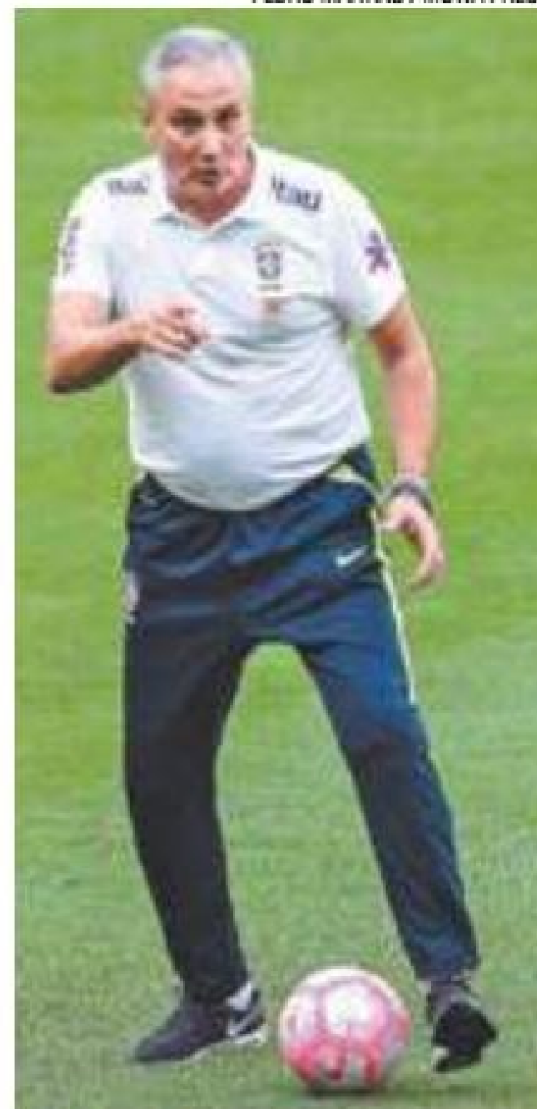
Histórico - Brasil sempre venceu em casa em jogos classificatórios