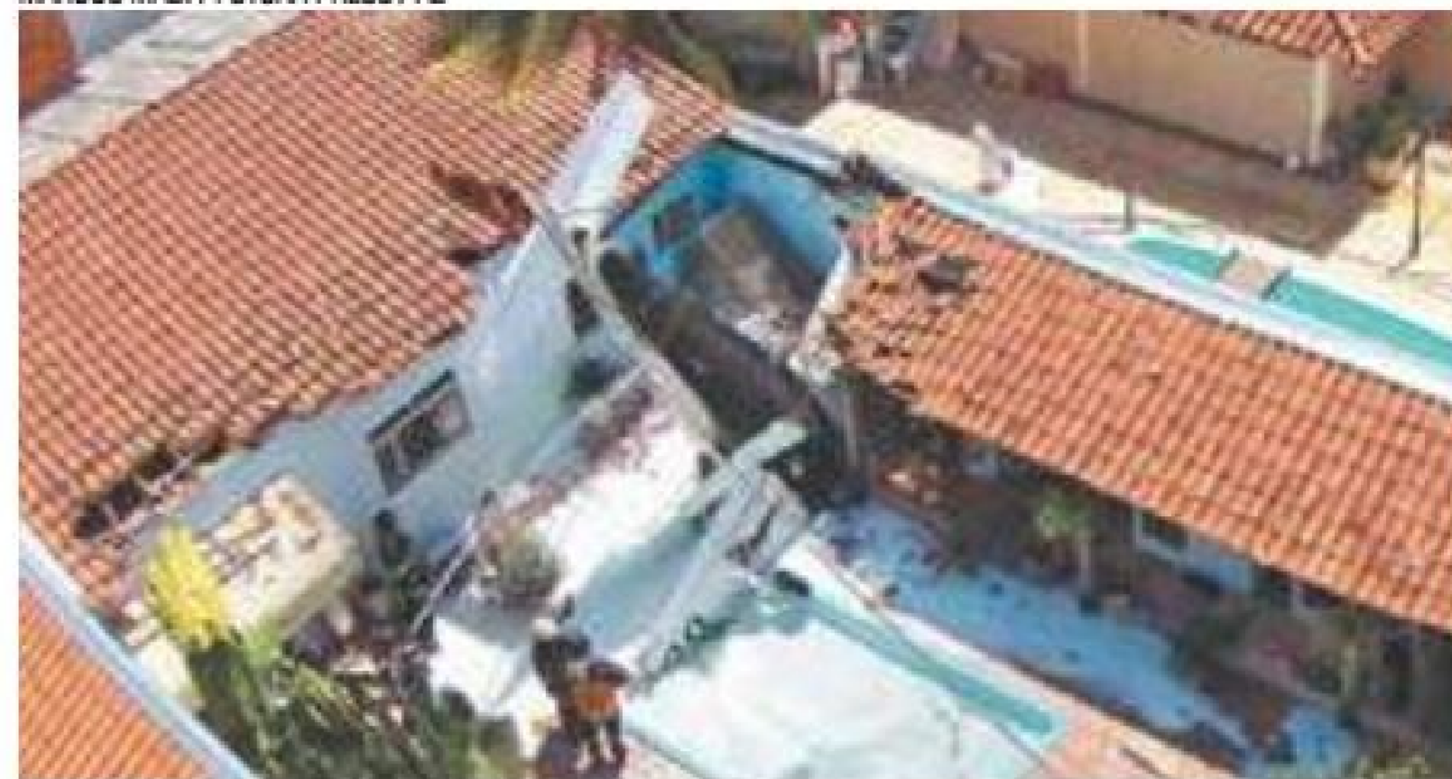
Tragédia - Os três ocupantes do avião morreram, informou Bombeiros