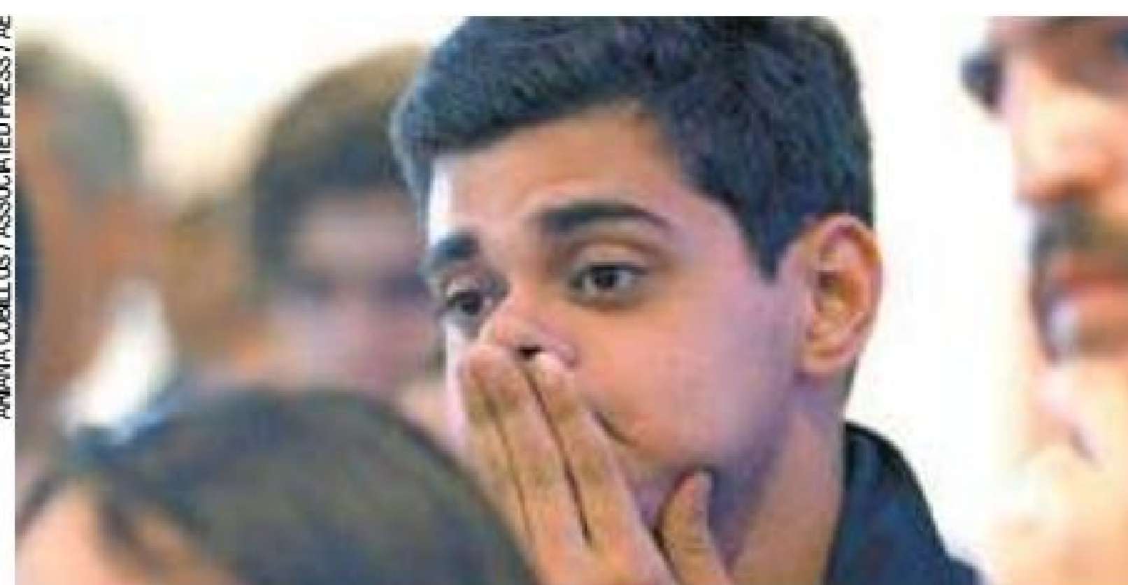
Decepção – Pessoas contrárias a Maduro ficaram surpresas com o resultado

Segundo a MUD, houve diversas frentes de fraude na votação. Entre as irregularidades denunciadas estão a mudança de mesas de votação de última hora em dis-