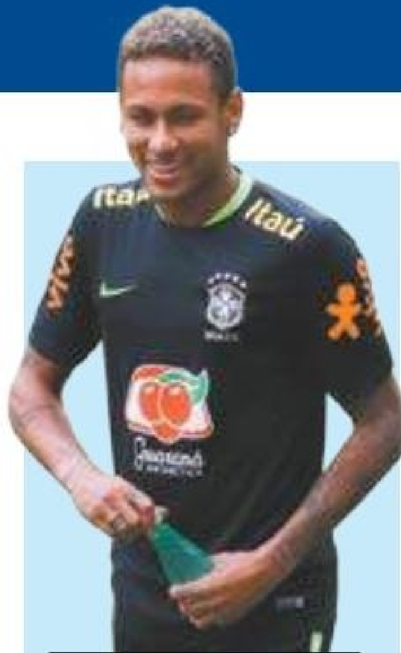
Guardado - Quadro com atriz está na mansão de Neymar

John Mayer – The Search for Everything Dia 18 de outubro, no Allianz Parque, às 21h15 (Show de abertura, às 20h) Rua Palestra Itália, 200, Barra Funda Ingressos: www.livepass.com.br