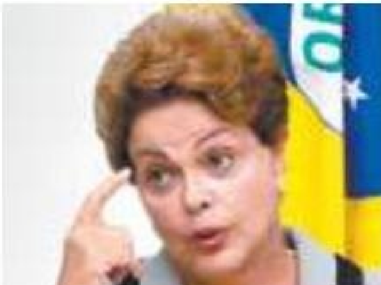
JOSE-CRUZ / AGENCIA BRASIL

As cautelares foram solicitadas por Raquel Dodge, “após as investigações iniciadas na primeira instância, no âmbito da Operação Cui Bono, terem sido enviadas ao Supremo Tribunal Federal”. (AGÊNCIA ESTADO)