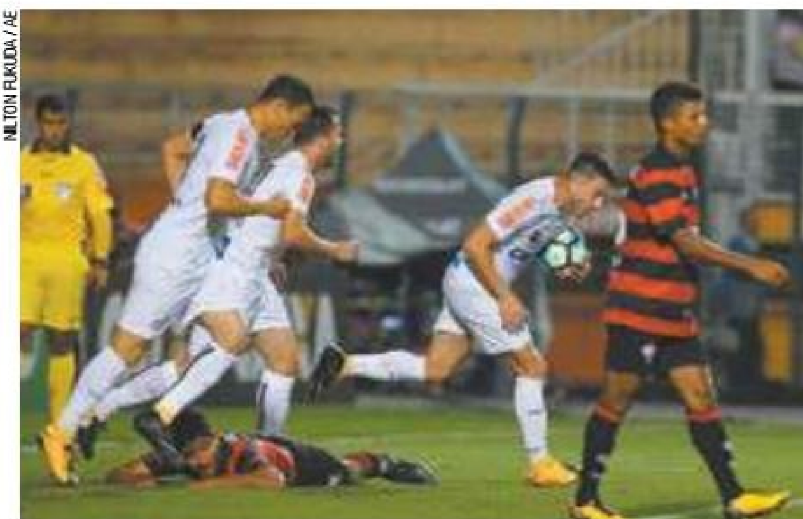
Reação – Peixe buscou o empate duas vezes, mas não conseguiu virar

Aos 22 minutos, David driblou Vanderlei antes de bater para as redes. Aos 36, Zeca cruzou da esquerda e Jean