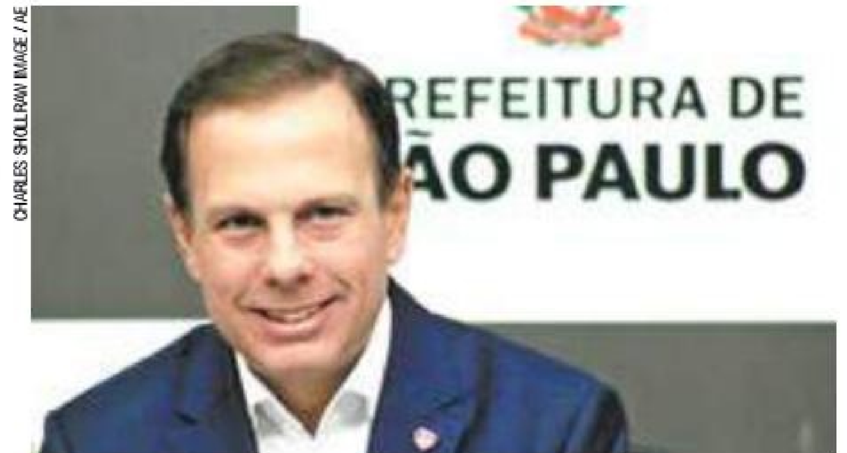
Atento - Doria minimiza desgaste que viagens causaram aos paulistanos

Doria abordou os pontos sensíveis de sua pré-candidatura, mas sempre tomando o cuidado de negá-la. Ao mesmo tempo em que elogia o Movimento Brasil Livre (MBL), que se aproxima do deputado Jair Bolsonaro (PSC-RJ), o prefeito rejeita o rótulo de "direita". "Sou um liberal. A posição mais ao centro é a mais equilibrada", afirmou.