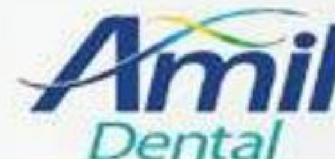
Tabela Amil Dental - Pessoa Física

Referência: Outubro/2017 - Taxa de Inscrição: Não informado