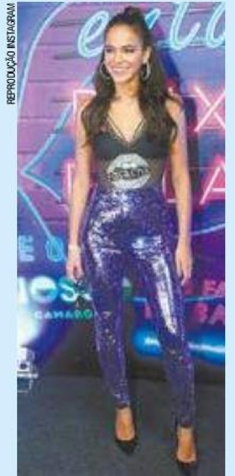
Estilo - Calça Gucci e blusinha exclusiva formam look da atriz

Para finalizar, argolas grandes e o penteado de cabelo meio preso deram um toque divertido ao visual.