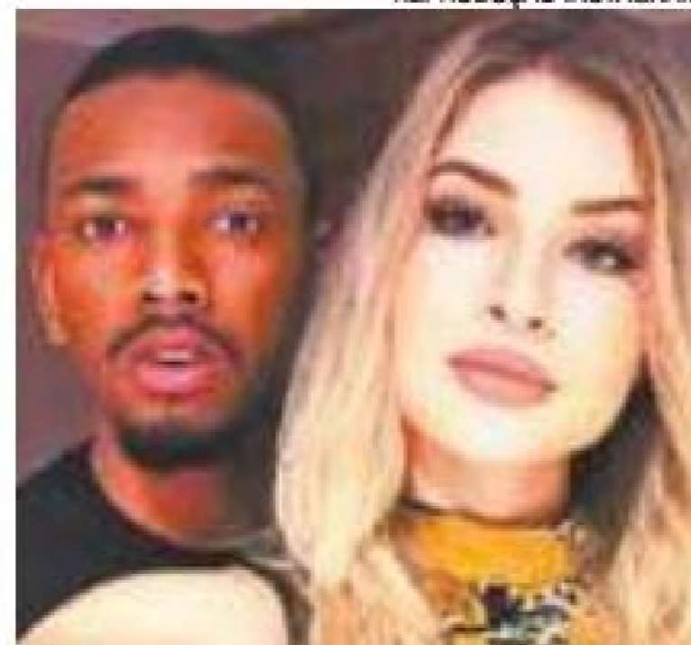
Silêncio - Nenhum dos dois se manifestou sobre a nova notícia