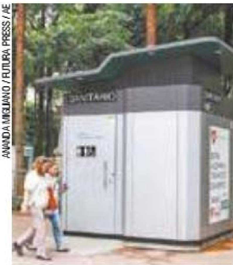
Eventos – Além de feiras, Doria quer banheiros em ações culturais

Serão instalados 67 banheiros na região central, 78 na Norte e 110 na Leste. MAIS 82 sanitários estarão à disposição do público da Zona Sul e 63 na Oeste. Os locais dos outros 100 banheiros poderão ser definidos pelo vencedor da