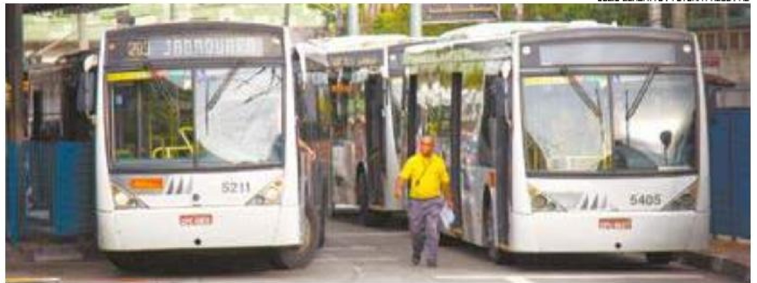
Atrasos – Mais de 190 mil pessoas foram prejudicadas pela paralisação de ônibus em cidades da Grande SP

concorrência, desde que aprovado pela SPObras, responsável pelo mobiliário urbano. Os banheiros móveis devem atender à reivindicação de feirantes. A Capital tem 117 feiras em dias úteis e 190 aos finais de semana. (EURICO CRUZ)