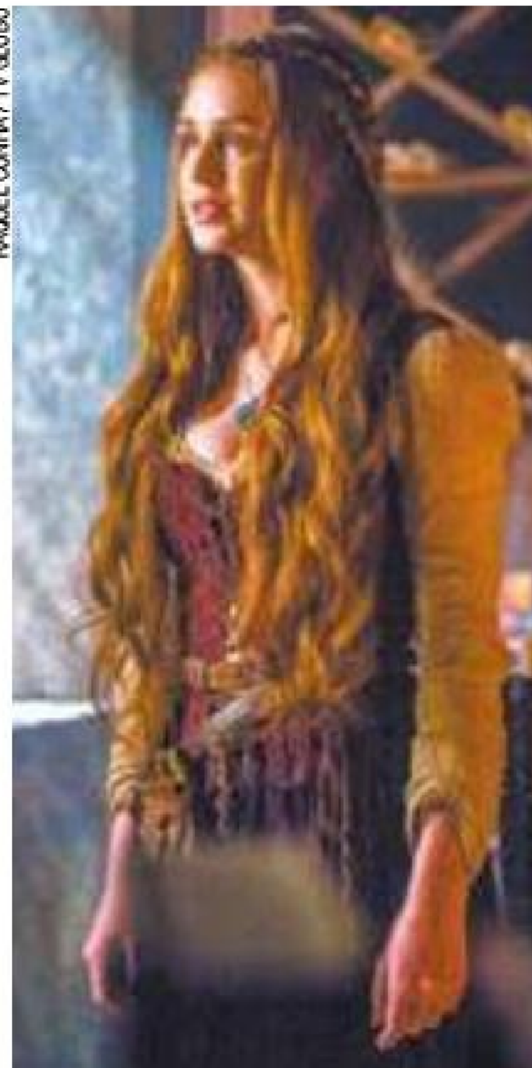
Decepção - Amália abandonará romance com Virgílio novamente

Antes disso, Amália, ainda sem memória, vai marcar a data de casamento com Virgílio. O vilão vai pagar o concerto de barracas dos feirantes após um ataque de bandidos, o que deixará a mocinha derretida de amores por ele. "Nós seremos muito felizes, pode ter certeza disso", se orgulhará o comerciante, antes de toda a confusão ser desfeita. (RAPHAEL POZZI)