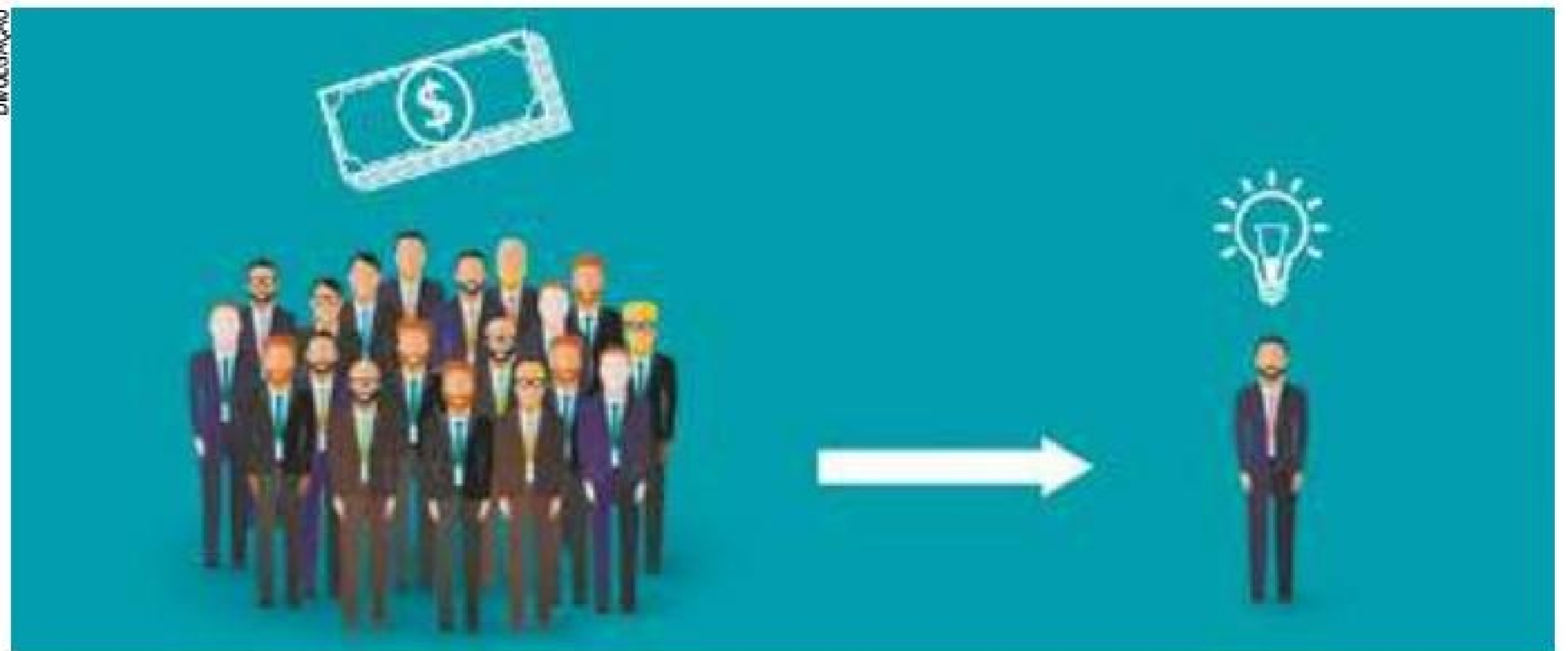
Crowdfunding - Autores podem expor ideias e pedir recursos para doadores em troca, ou não, de recompensa

Recurso pode ser utilizado com foco em ações de filantropia, cultura, artes, games , entre outras opções