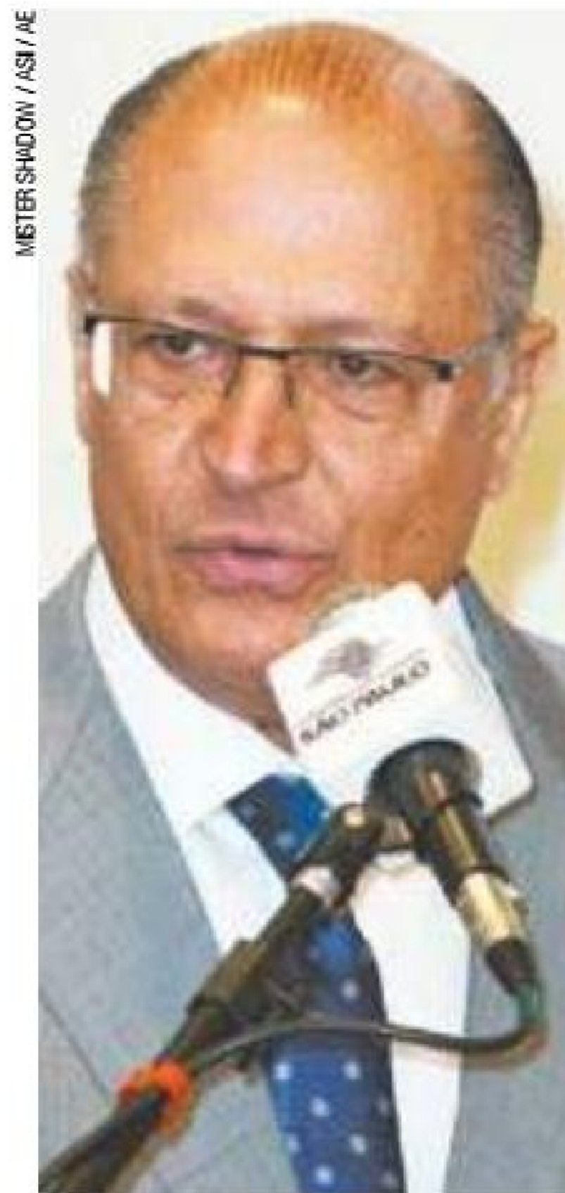
Mercado - Decisão de Alckmin fortalece conversa com empresários

Alckmin disse ainda que os pré-candidatos da legenda, que incluem o prefeito João Doria, devem conversar e chegar a um acordo sobre a data das prévias. A proposta do presidente estadual do partido, Pedro Tobias, defende que o primeiro turno ocorra no dia 18 de março e o segundo, no dia 25 de março. (AGÊNCIA ESTADO)