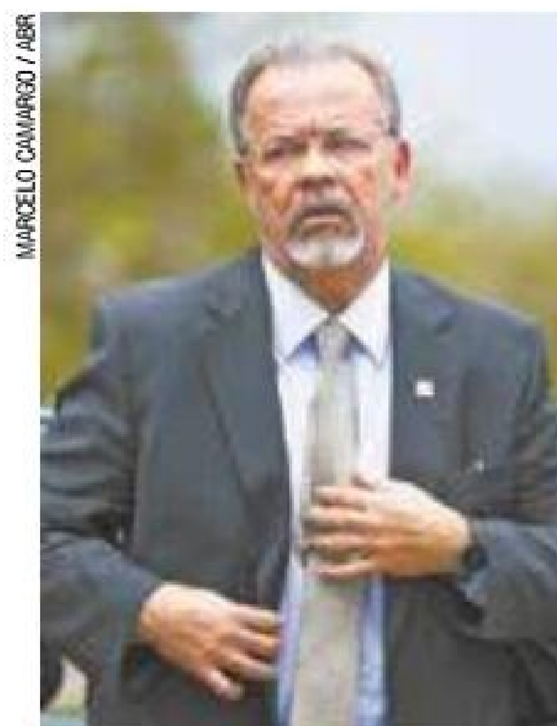
Engano - Jungmann disse que tudo não passou de um "mal-entendido"

O ministro reforçou que a operação conjunta entre as