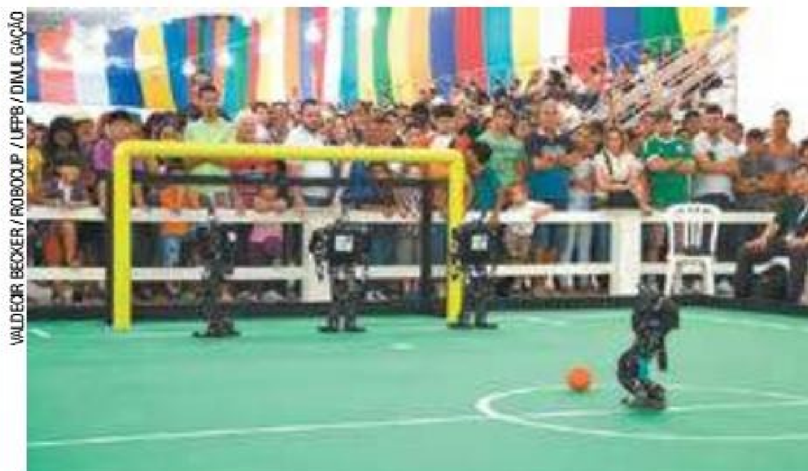
Parceria - Projeto é feito com pesquisadores da Unicamp e da Unifesp

Um projeto desenvolvido pela Universidade de Campinas (Unicamp), em conjunto com Universidade Federal de São Paulo (Unifesp), usa diversos tipos de processos de aprendizagem e constrói robôs que são estimulados em ambientes com simuladores de alta fidelidade, introduzindo algoritmos de aprendizagem e transferin-