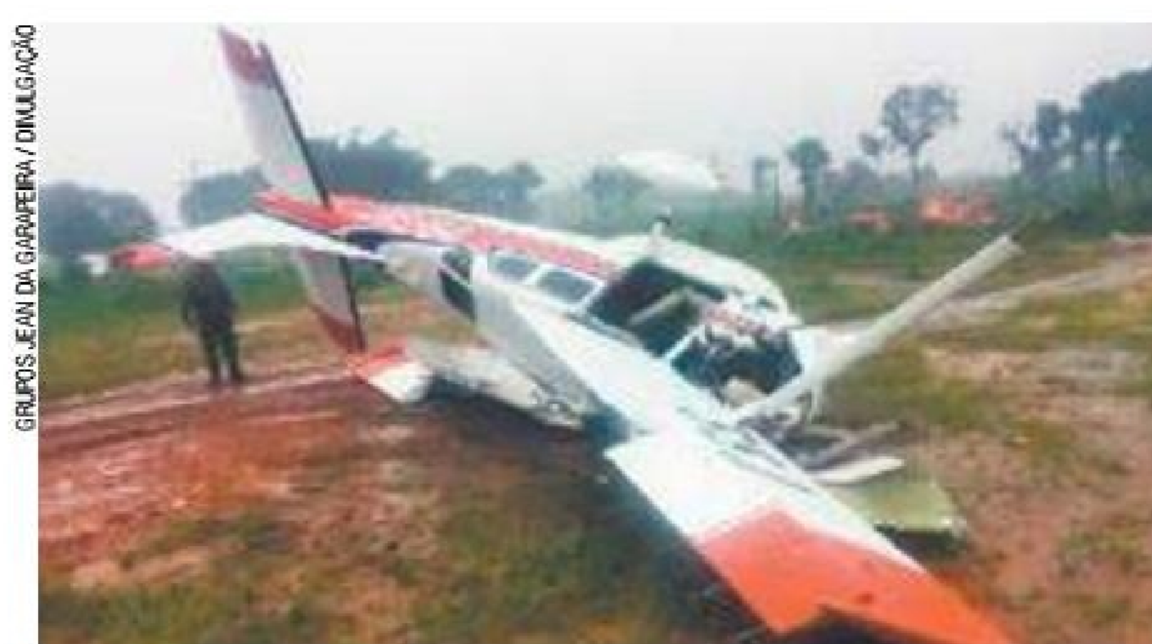
Tragédia – Acidente ocorreu durante comemoração ao Dia do Aviador

ta das 18h30 em uma área residencial próxima ao aeroporto local, de onde o monomotor havia partido poucos minutos antes com três passageiras, piloto e copiloto. Desgovernado, o avião caiu “de bico” em um terreno de mato e os corpos foram lançados para fora. Ninguém foi atingido no solo.