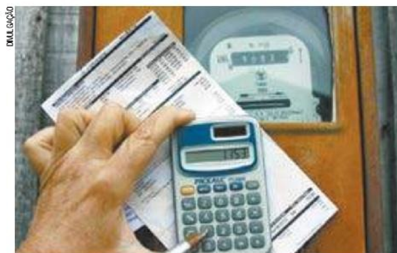
Gastos – Uso de usinas termelétricas é fator que ajuda no aumento

“É o que mais importa, olhando para o futuro, qual é de fato a condição de atendimento da carga”. Segundo Rufino, isso poderia evitar uma bandeira verde como a observada em meados do ano, quando já se esperava uma hidrologia desfavorável durante o período seco e um forte consumo dos reservatórios. A nova metodologia, disse ele, deve entrar em vigor no ano que vem. (AGÊNCIA ESTADO)