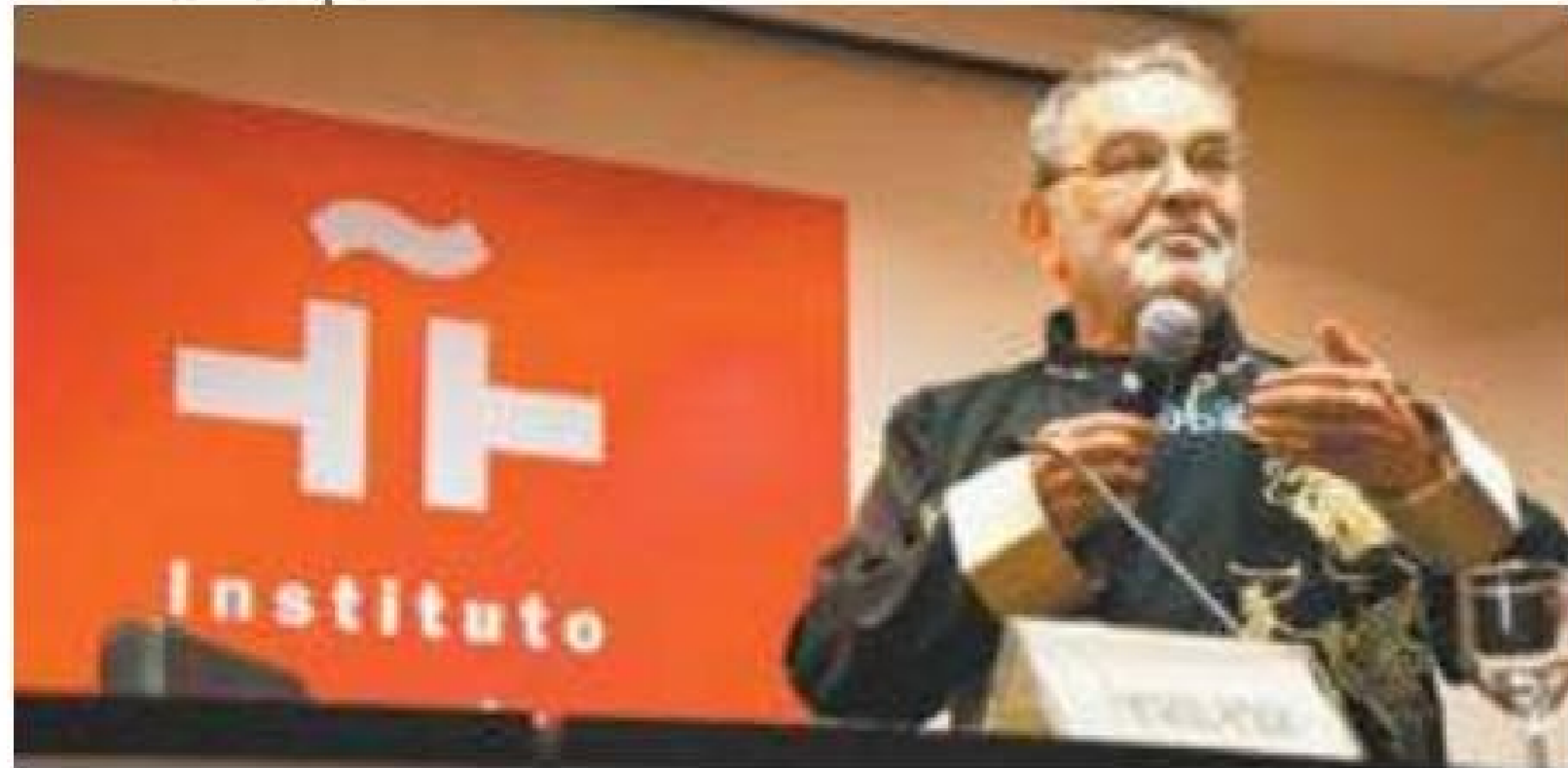
De graça - Amanhã será feita a leitura do texto Carta de Amor