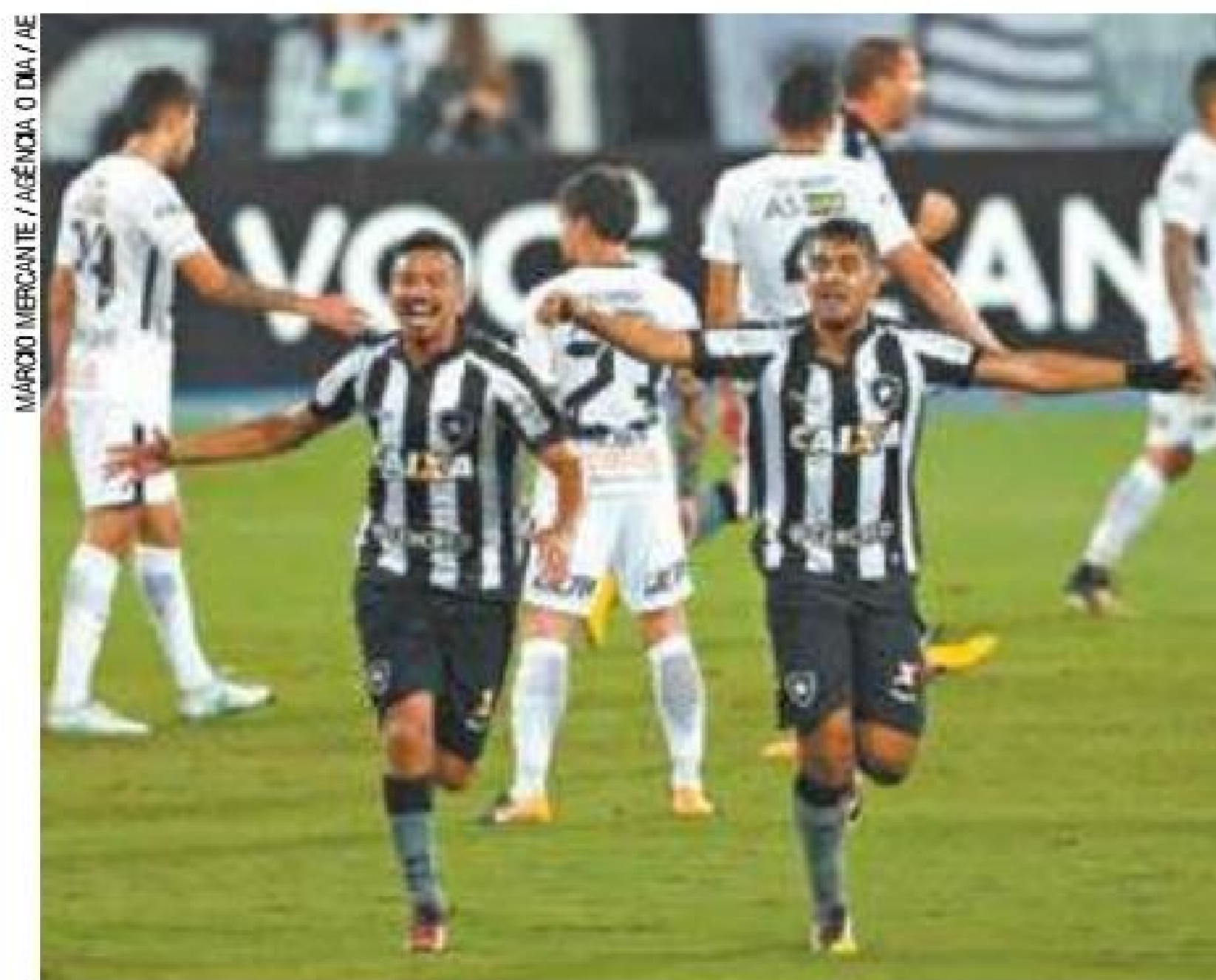
Água fria – Botafogo garantiu três pontos, mas Corinthians ainda lidera

O Corinthians foi a campo com novidade na escalação. Fábio Carille decidiu colocar Marquinhos Gabriel no lugar do paraguaio Romero,