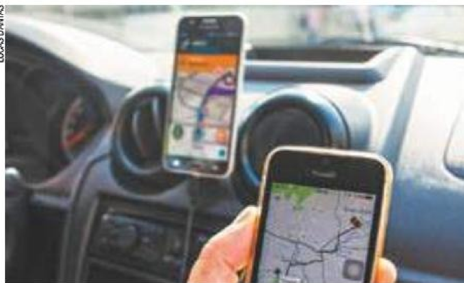
Insegurança - Motoristas e passageiros têm dúvidas sobre mudanças

A reportagem percorreu a cidade durante três horas, com paradas no Terminal Rodoviário do Tietê, na Zona