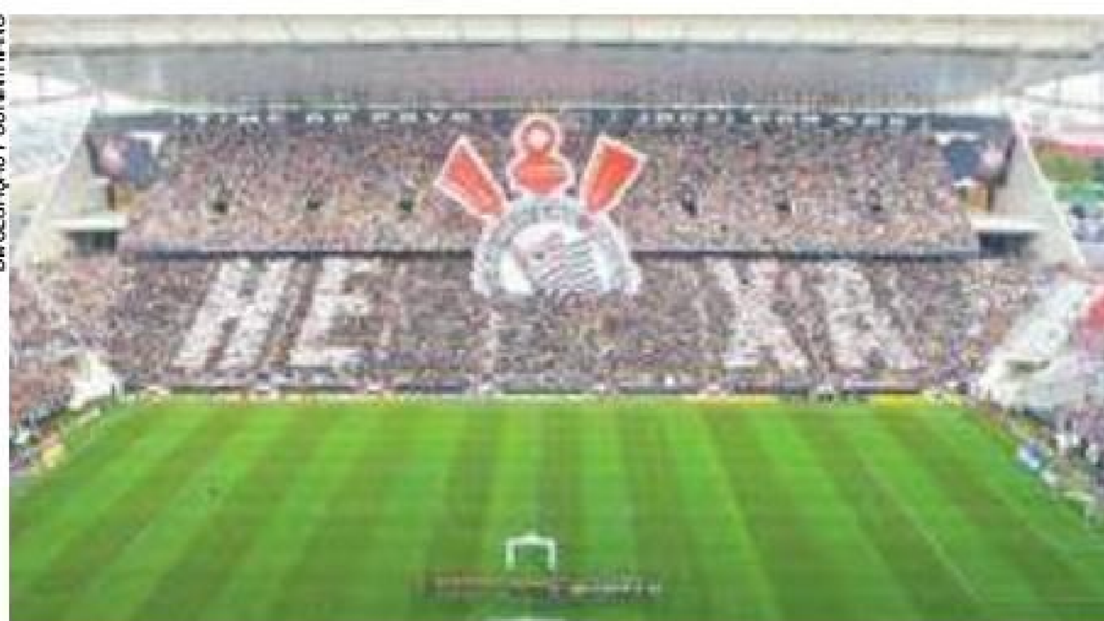
Desafio - Candidatos reconhecem que Arena é a principal pendência

Eleição para a escolha de presidente do Timão entra na reta final Pág. 12