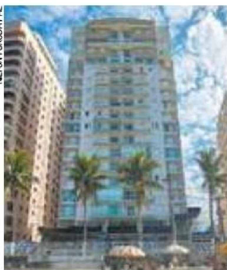
Alvo - Triplex será utilizado para reduzir prejuízo da Petrobras

O magistrado mandou oficiar a 2ª Vara de Execução de Títulos Extrajudiciais da Justiça Distrital de Brasília, para que se levante o processo em que o imóvel foi penhorado.