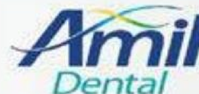
Tabela Amil Dental - Pessoa Física

Referência: Outubro/2017 - Taxa de Inscrição: Não informado