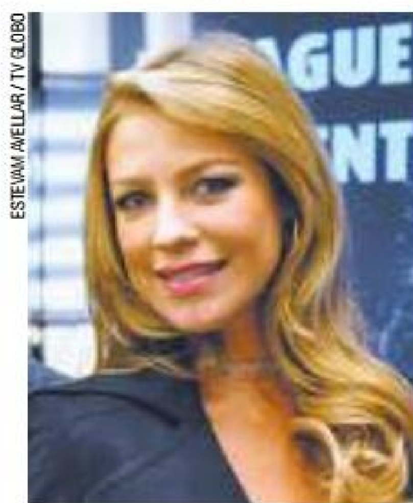
Mudança - Atriz afirma que terá melhor qualidade de vida na Europa

"A gente vai morar em Cascais, porque o Pedro [Scooby, seu marido, que é surfista] tem que morar num lugar de frente pra praia. A