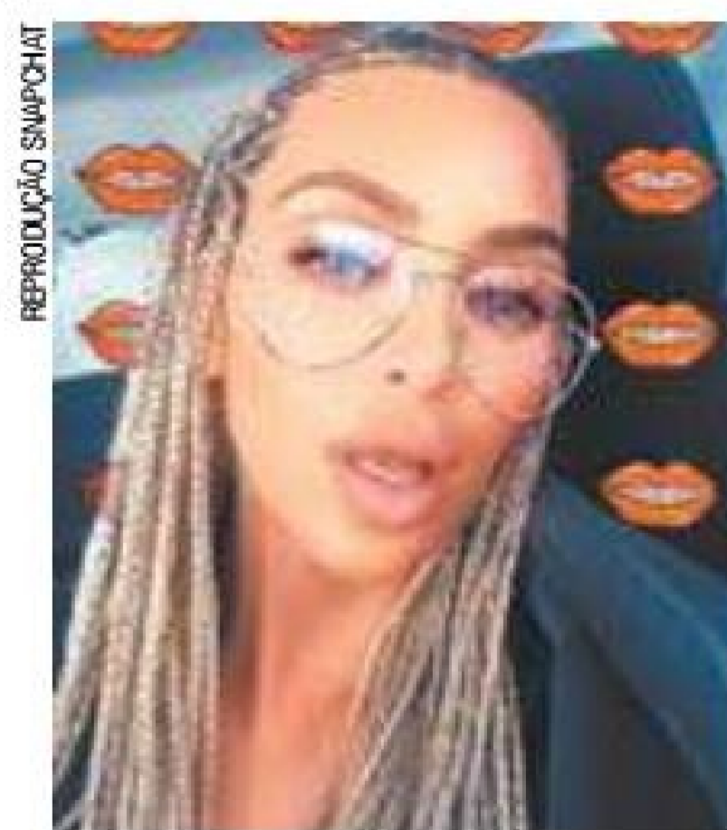
Polêmica - Movimentos negros criticaram referência dada por Kim

No Twitter, internautas criticaram a socialite e a associação com a artista branca. "Primeiro, f... Kim Kardashian por usar trancinhas e chamá-las de 'tranças da Bo