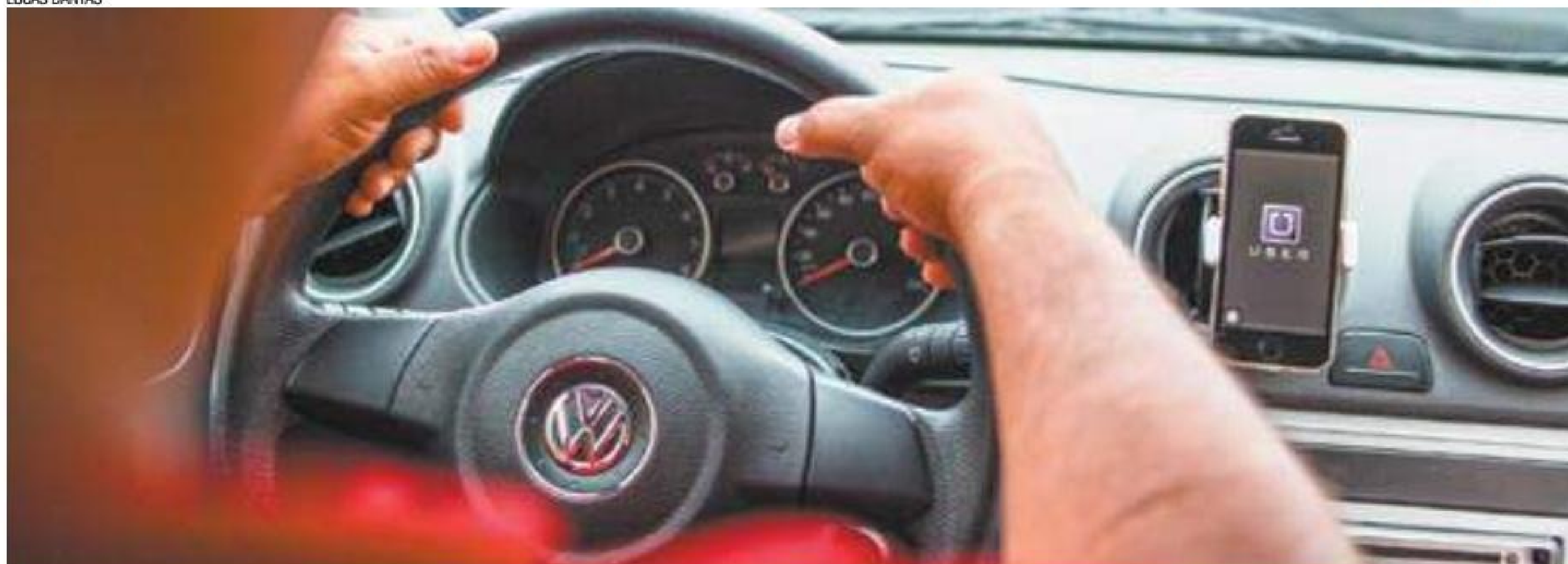
Incertezas - Motoristas trabalharam ontem com cópias de liminares nos veículos para apresentar a fiscais, no caso de serem parados