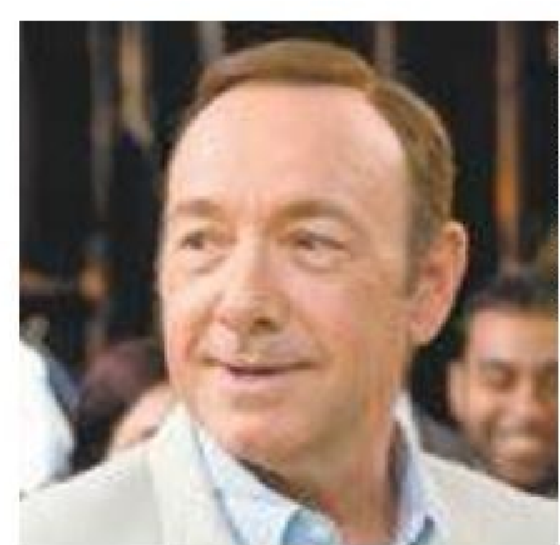
Alvejado - Spacey é criticado por justificar assédio com opção sexual

A Netflix não se posicionou oficialmente. No último domingo, 29, o ator Anthony Rapp deu uma entrevista ao BuzzFeed afirmando que Kevin Spacey o teria assediado durante uma festa quando ele tinha 14 anos. Kevin pediu desculpas e afirmou que vive como gay.