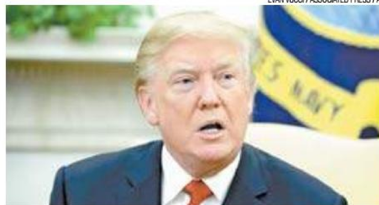
Em baixa - Trump não consegue alavancar Governo e sofre denúncias