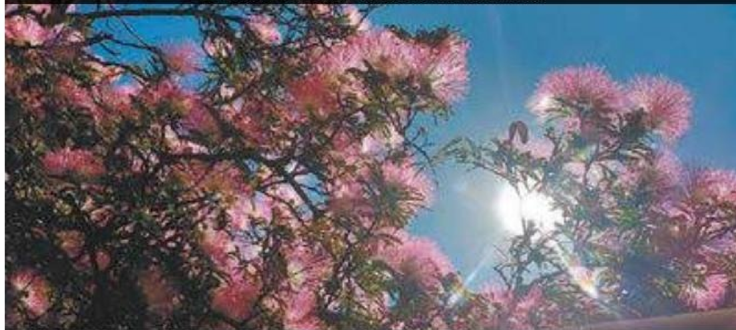
Efeito – A leitora Isa Caroline decidiu registrar a beleza da luz do Sol em contraste com os galhos floridos