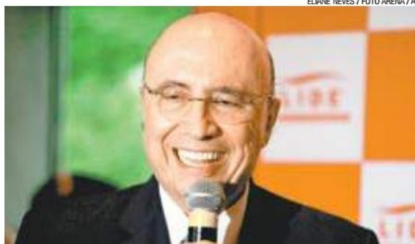
Otimista – Meirelles confia que 2018 terá maior recuperação econômica