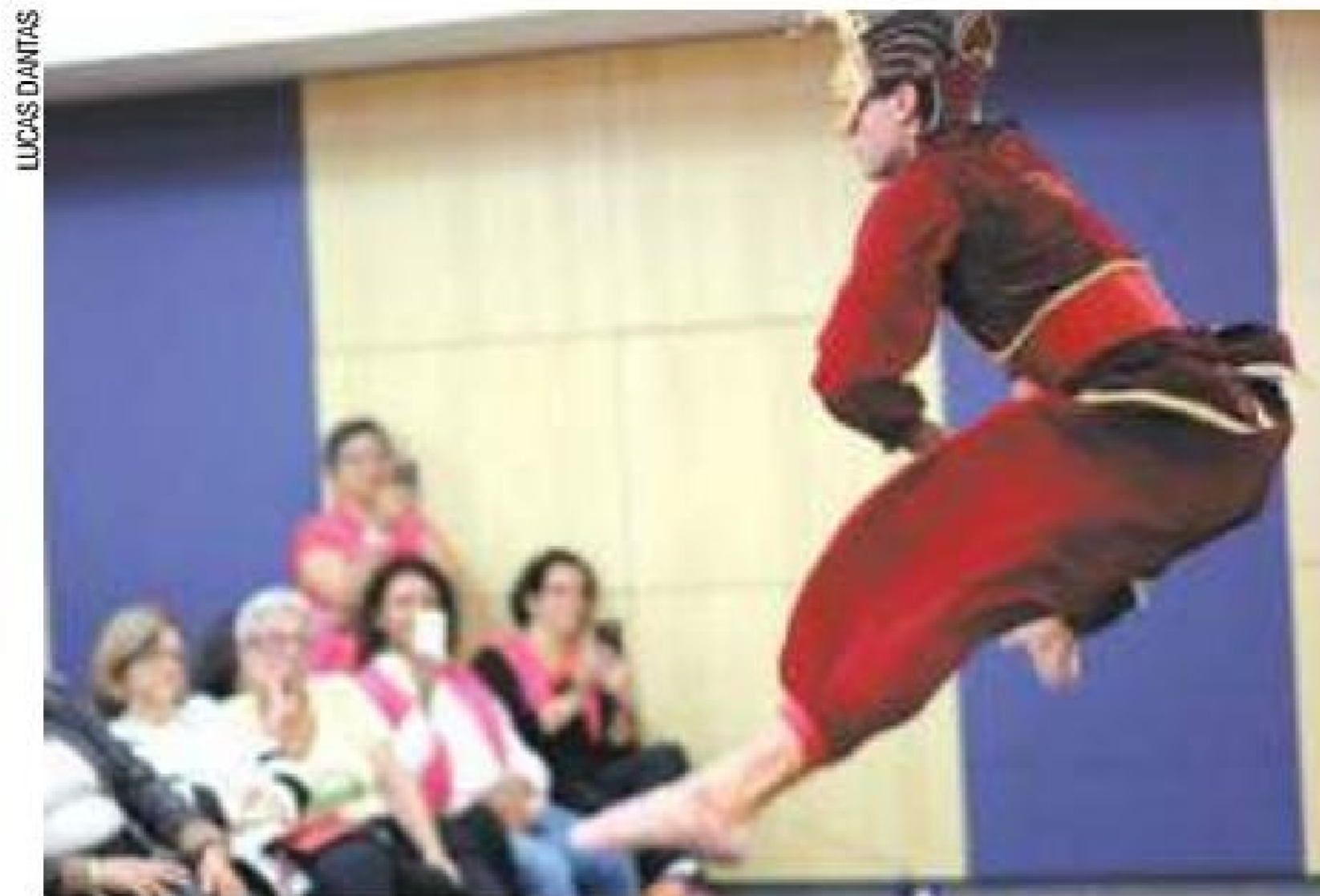
Balé – Pacientes, estudantes e médicos acompanharam os eventos