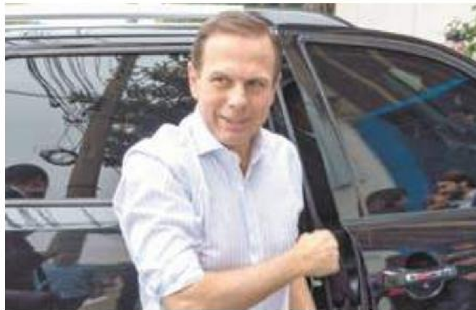
Na dúvida - Doria é cotado para disputar Presidência e Governo do Estado