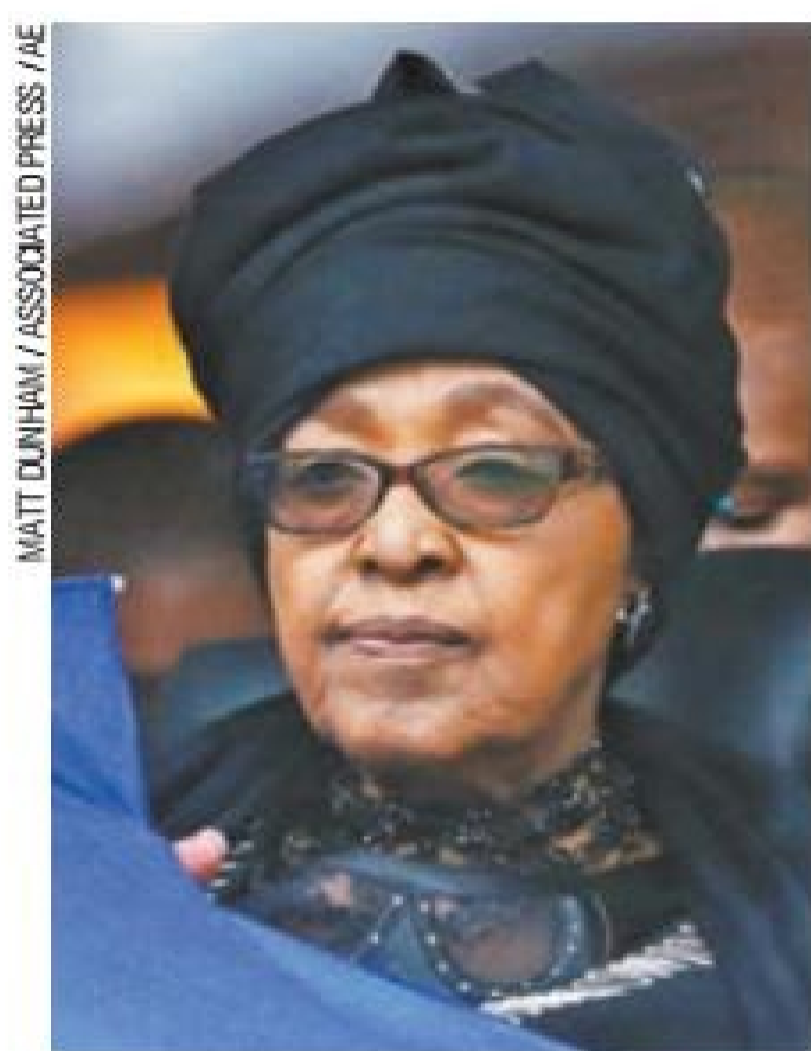
Ativismo – Winnie tomou para si a luta pela liberdade de Mandela

Descrita por muitos sul-africanos como "Mãe da Nação", ela foi casada com Mandela durante 1958 e 1996, período que engloba os 27 anos em que o ex-presidente esteve preso. Winnie e Mandela se separaram em 1992, dois anos depois da libertação de seu marido. (AGÊNCIA ESTADO)