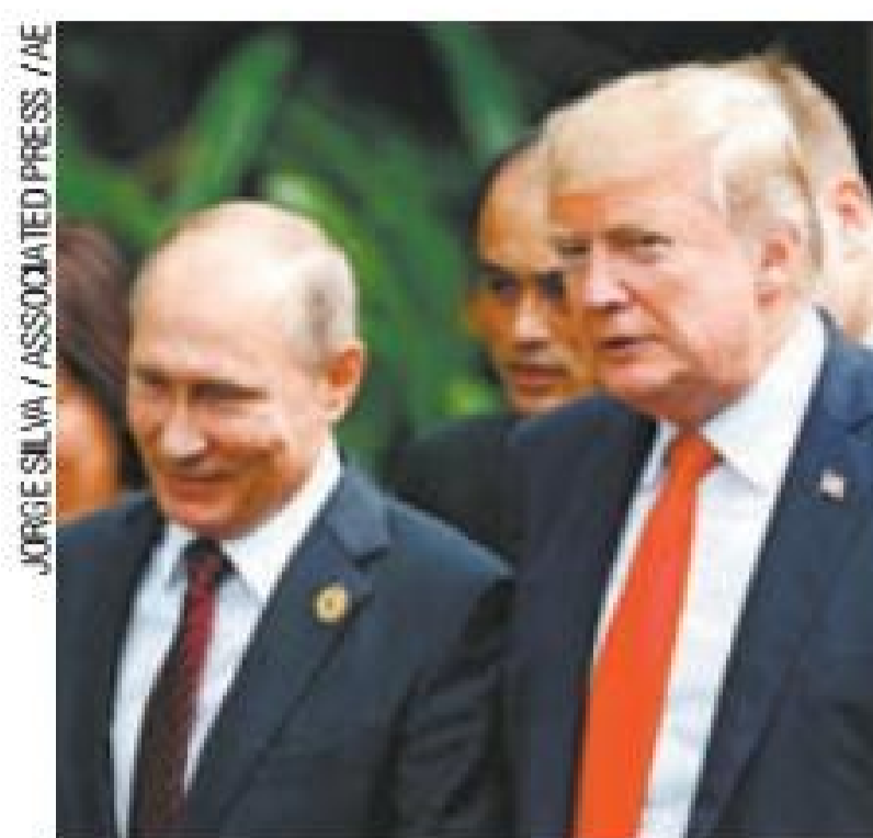
Chamada – Convite foi de Trump ocorreu em ligação em 20 de março

Segundo o assessor, os governos não tiveram tempo de começar a organizar uma reunião antes que os EUA se unissem ao Reino Unido e a mais duas dúzias de aliados para a expulsão de diplomatas russos, em um movimento que culpa Moscou pelo