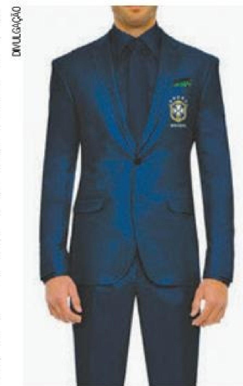
Elegância – Conjunto foi criado pelo famoso estilista Ricardo Almeida

Desde esse período, os moletens entraram em cena. Só que, este ano, a Confederação Brasileira de Futebol (CBF) resolveu retomar a tradição e valorizar a elegância. Um conjunto assinado por Ricardo Almeida, que está entre os principais estilistas do País, foi desenhado exclusivamente para a seleção brasileira.