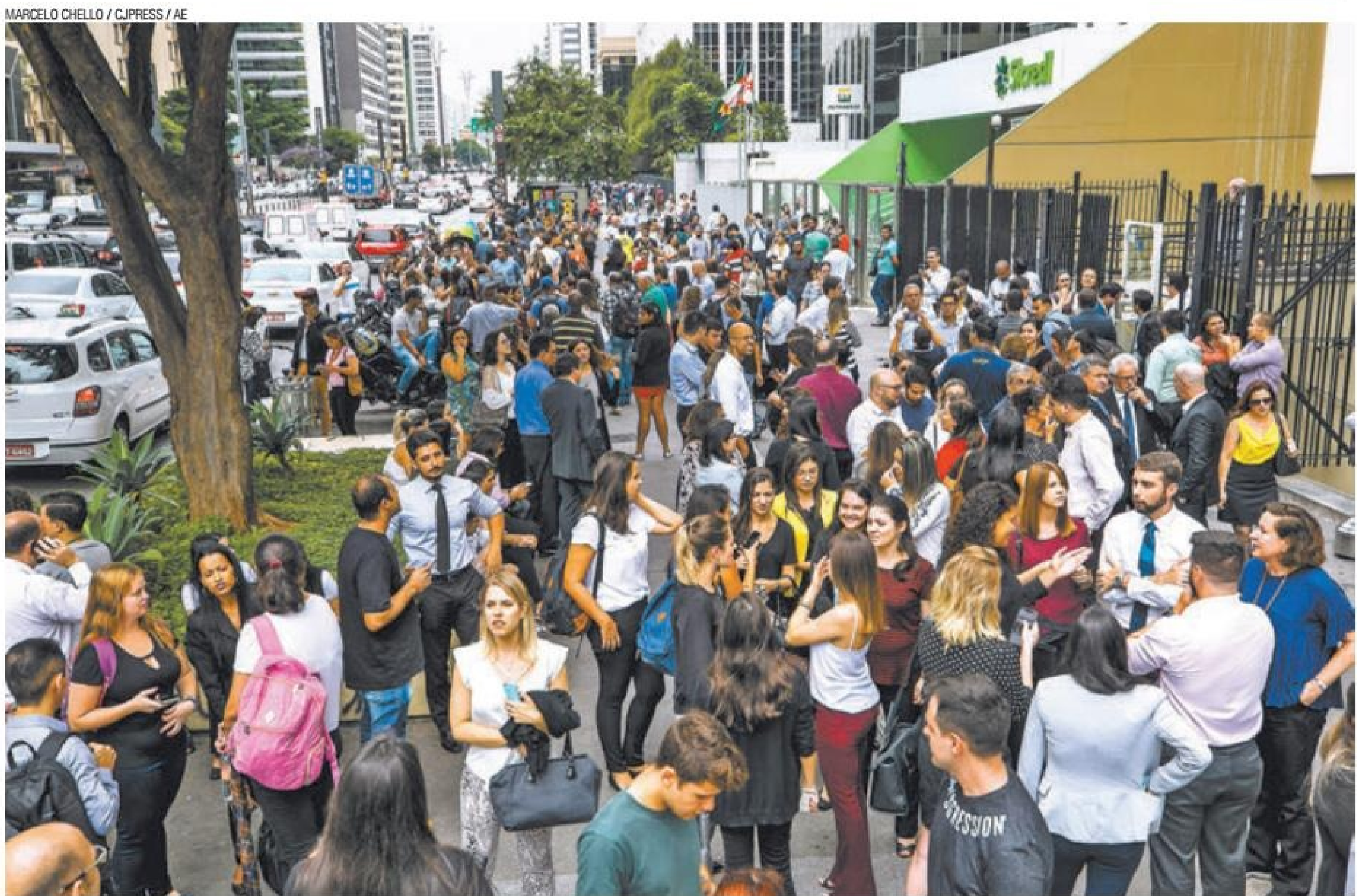
Medo - Funcionários que trabalham em andares mais elevados de edifícios da Avenida Paulista sentiram o tremor e evacuaram prédios imediatamente

Diversos pontos da cidade e de outros Estados sentiram os efeitos do terremoto de magnitude 6,8 na Escala Richter, ocorrido na Bolívia. Não houve registro de feridos e o Centro de Sismologia minimizou situação Pág. 3