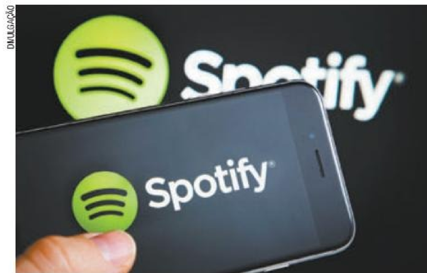
Ações – decisão da empresa abre portas até para pequenos investidores

uma companhia deixa as ações existentes flutuarem e permite que o mercado encontre um preço, sem bancos que servem como subscritores para definir preços ou alocar ações para grandes investidores.