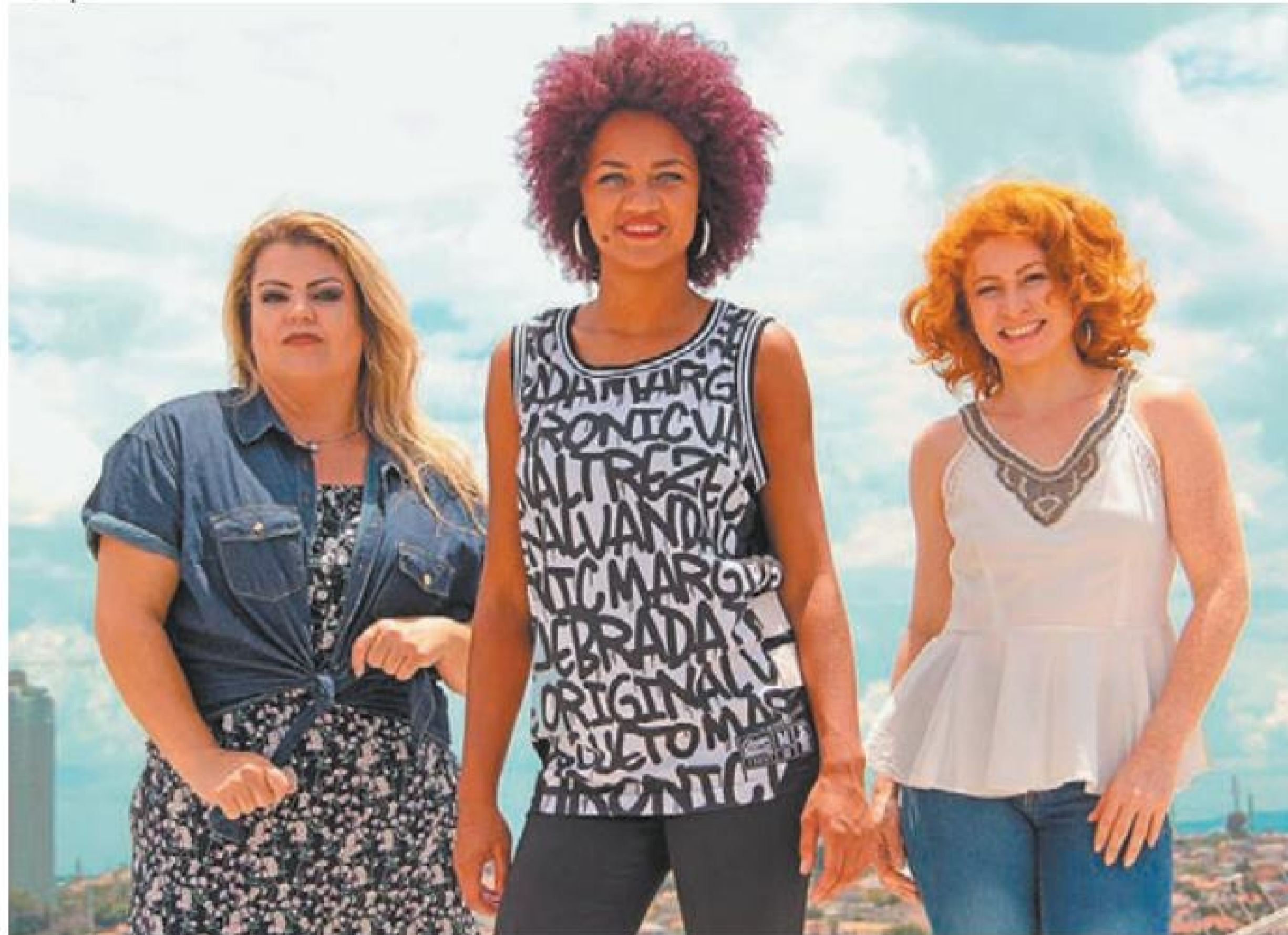
Essência - projeto chega à quarta edição e mantém intuito de buscar a verdadeira beleza da mulher brasileira