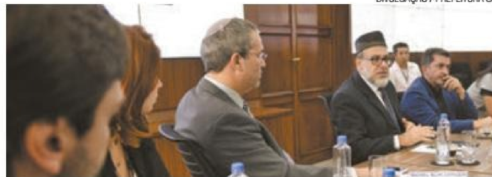
Apoio - Religiosos defenderam o acolhimento dos refugiados políticos