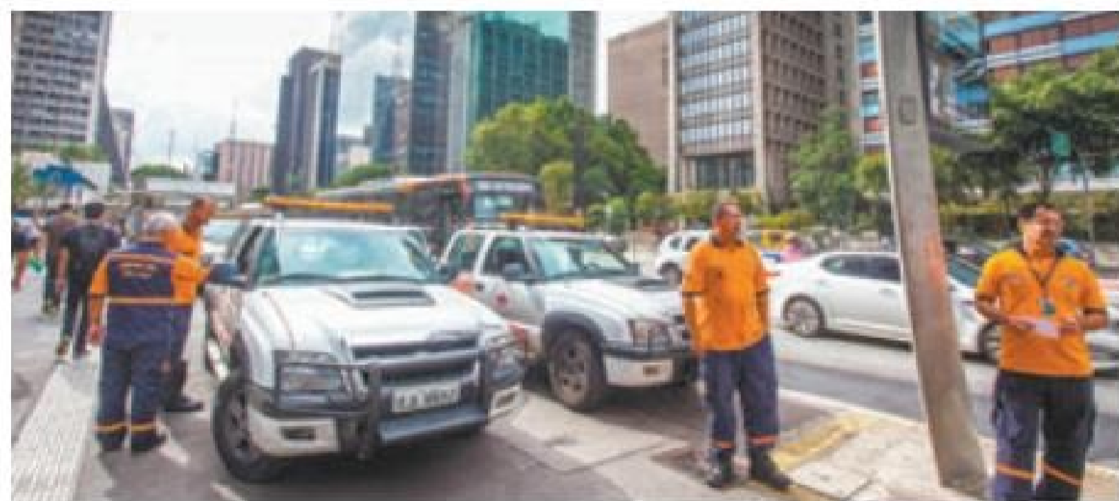
Ocorrências - Defesa Civil compareceu, mas não registrou chamadas