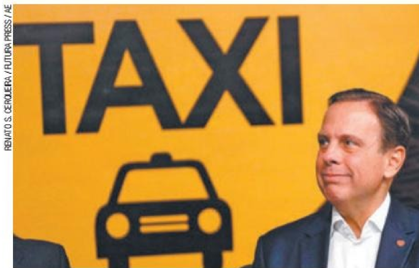
Afago - Doria volta a se aproximar de taxistas antes de deixar o cargo

Ao pedir uma corrida, os usuários poderão localizar os carros mais próximos, escolher o serviço por faixa de desconto, estimar o valor a