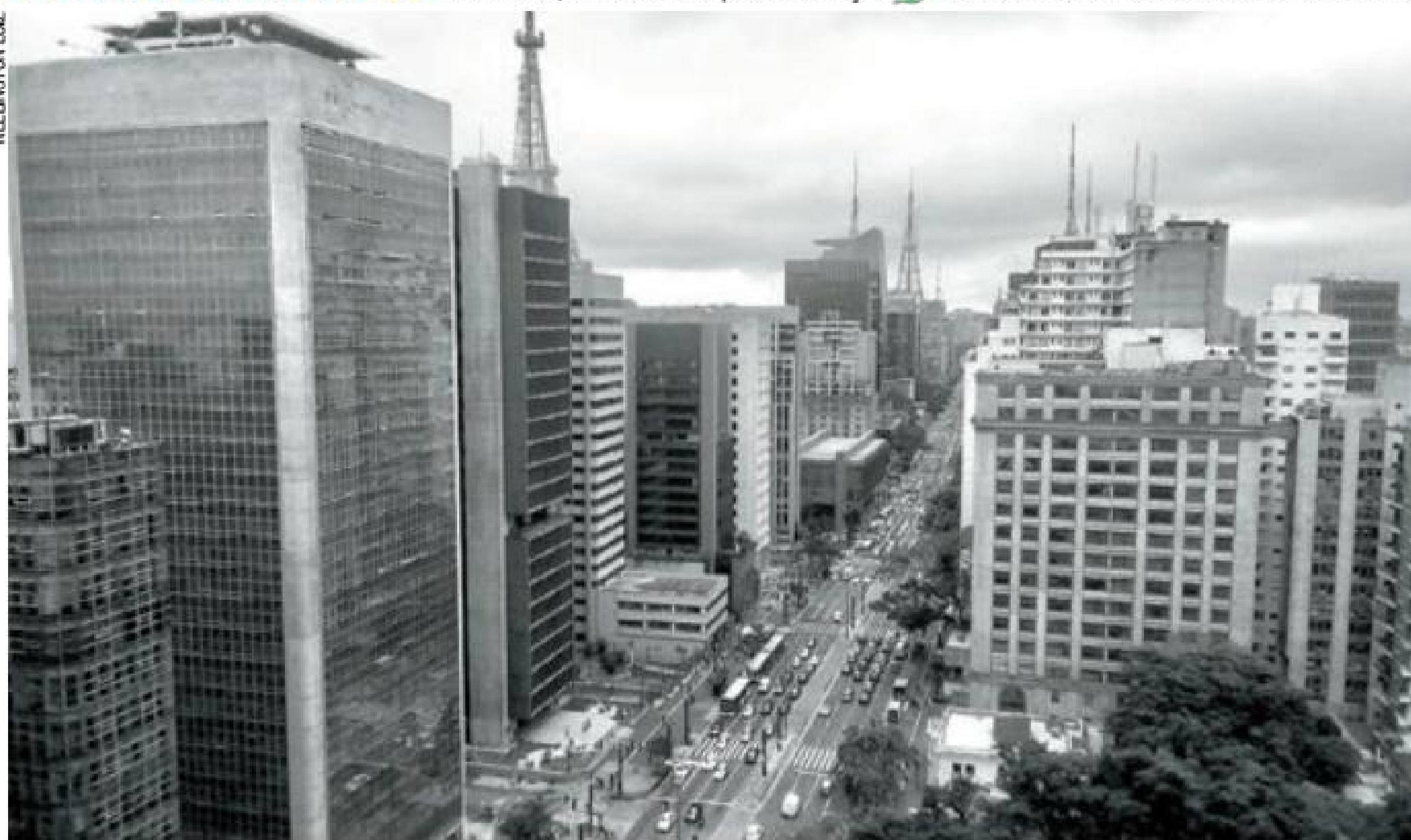
Espigão – Na década de 1960, a Paulista iniciou processo de verticalização e os casarões deram lugar aos arranha-céus

Caro leitor, envie sua foto para esta seção: 94021-9397 ou redacao@metronews.com.br