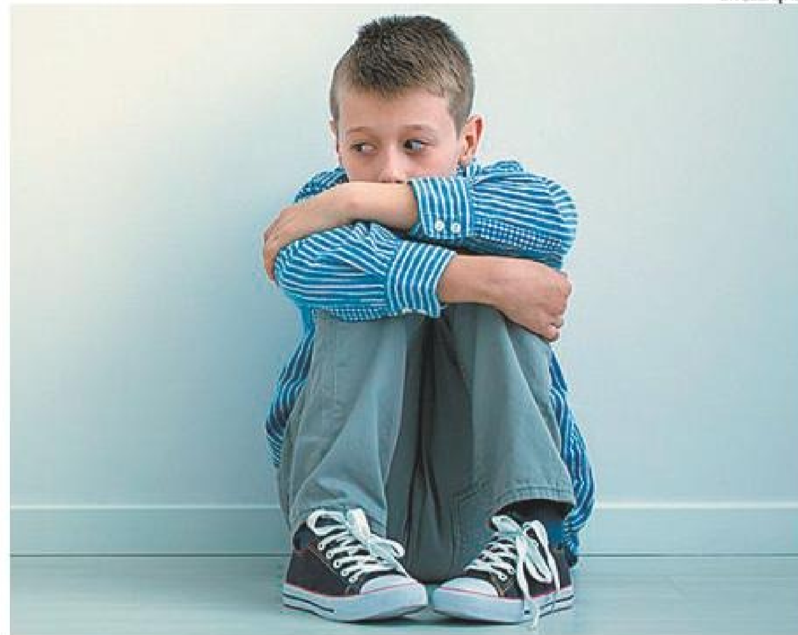
Transtorno – Autismo afeta sistema nervoso e prejudica entendimento