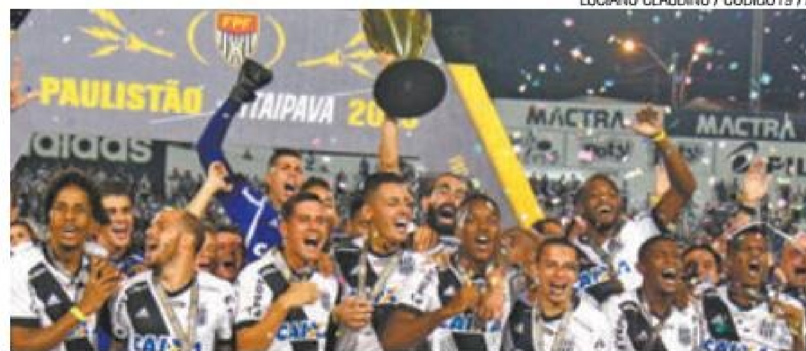
Prêmio – equipe de Campinas levou o prêmio de R$ 360 mil pelo título