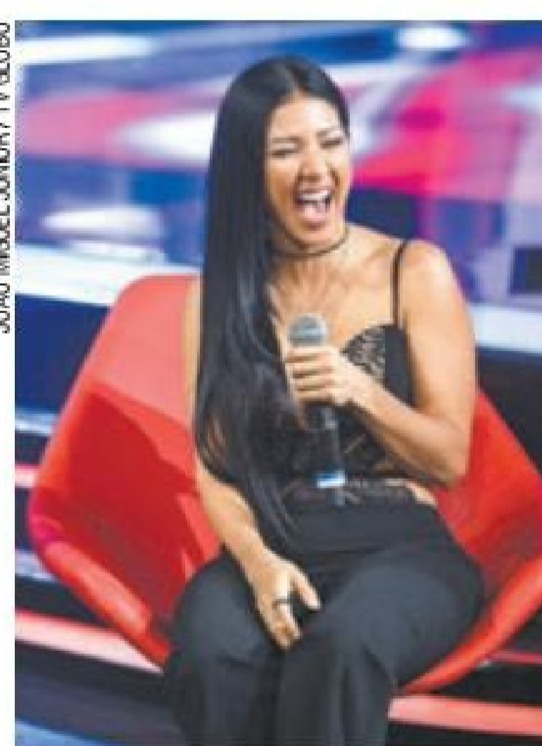
Interpretação - Sertaneja fingiu desmaio em adeus de participantes

linhos Brown, correndo para ajudá-la a levantar. "Você que está em casa não se assuste são coisas que só acontecem no The Voice Kids ", falou Marques, aos risos. Ao se levantar, Simaria ainda deu três pulos no palco. (AE)