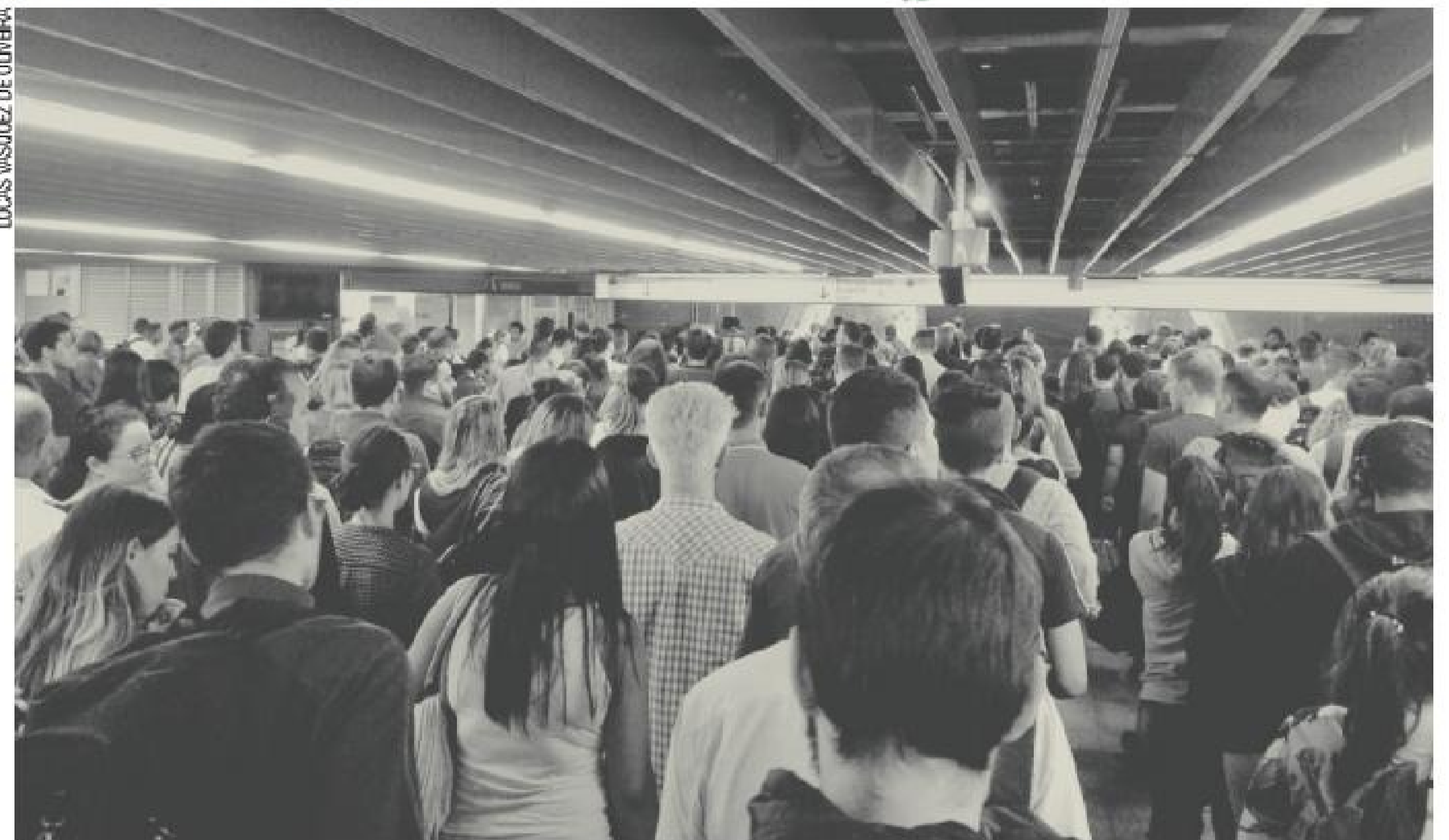
Sem atalho – Nos horários de pico no Metrô, não adianta correr; é preciso paciência para seguir no fluxo

Caro leitor, envie sua foto para esta seção: 94021-9397 ou redacao@metronews.com.br