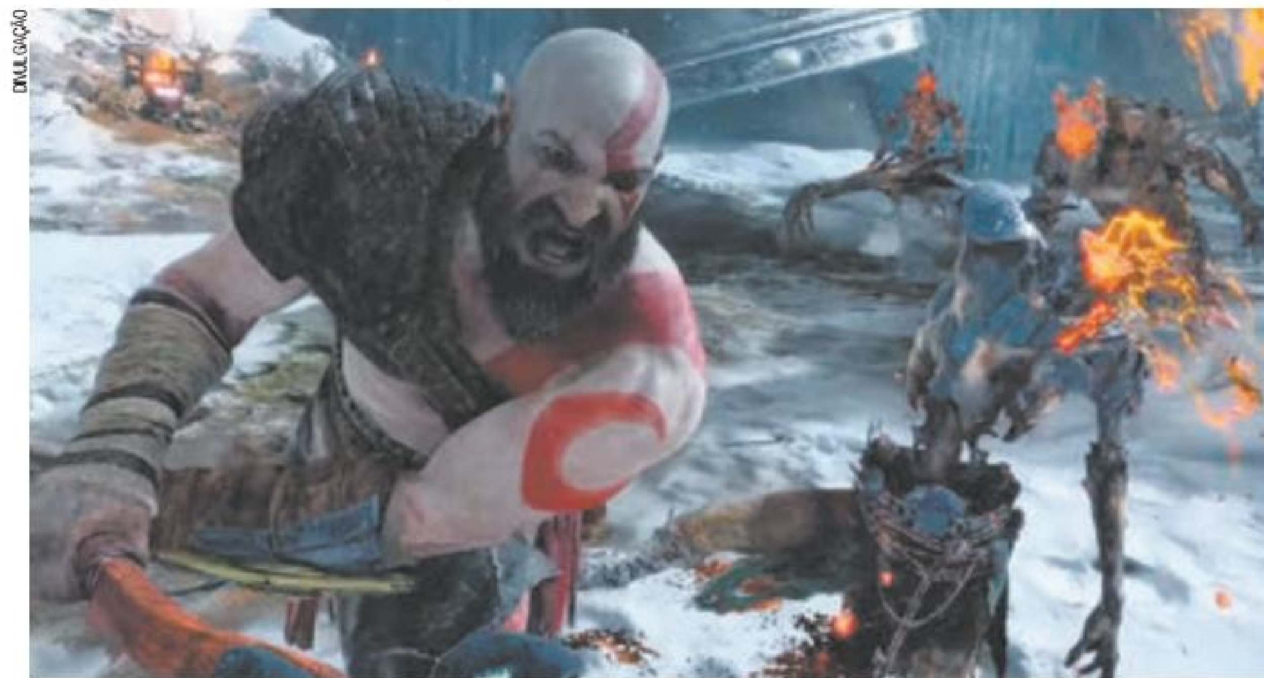
Mudança – Enredo é baseado na mitologia nórdica, diferente dos games anteriores, que focava nas histórias gregas

Uma notícia que agradou os fãs do jogo é o fato de que o jogo não permitirá microtransações, ou seja, não será preciso usar dinheiro de verdade para adquirir novos itens ou equipamentos durante a história do jogo. A informação foi dada por Cory Barlog, diretor do jogo. Em seu twitter. (DA REDAÇÃO)