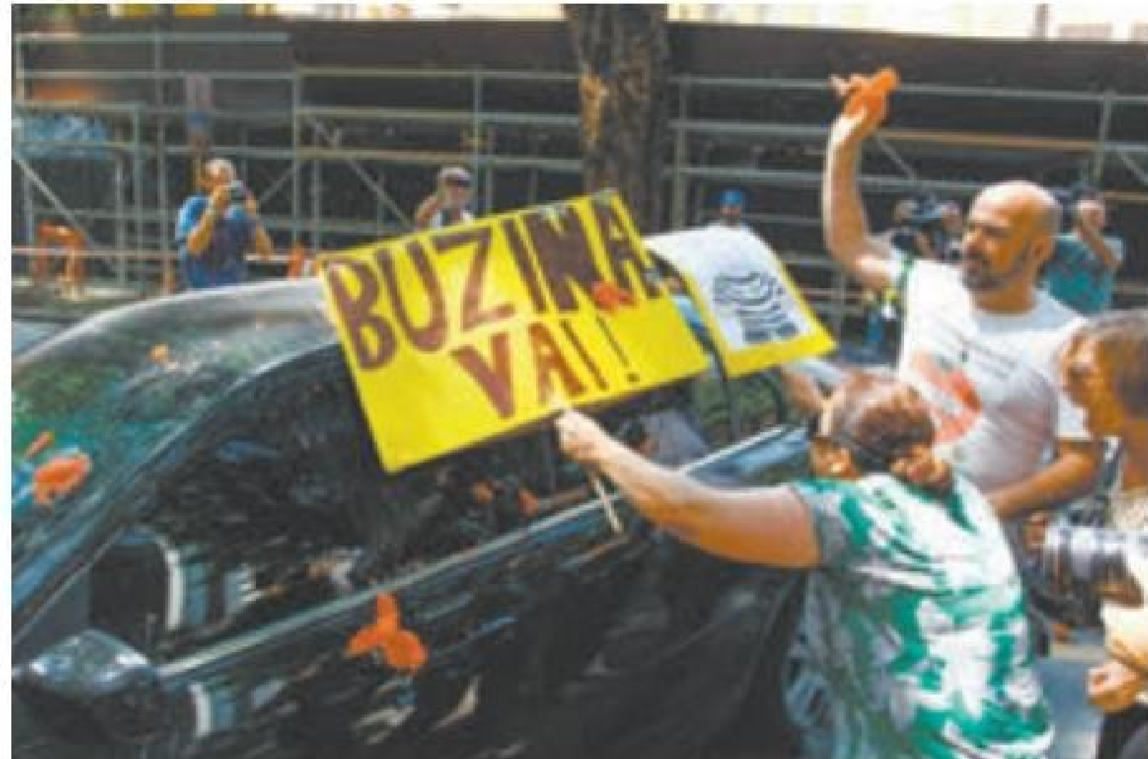
Hostilidade - Manifestantes tacaram tomates no carro do ministro, ontem