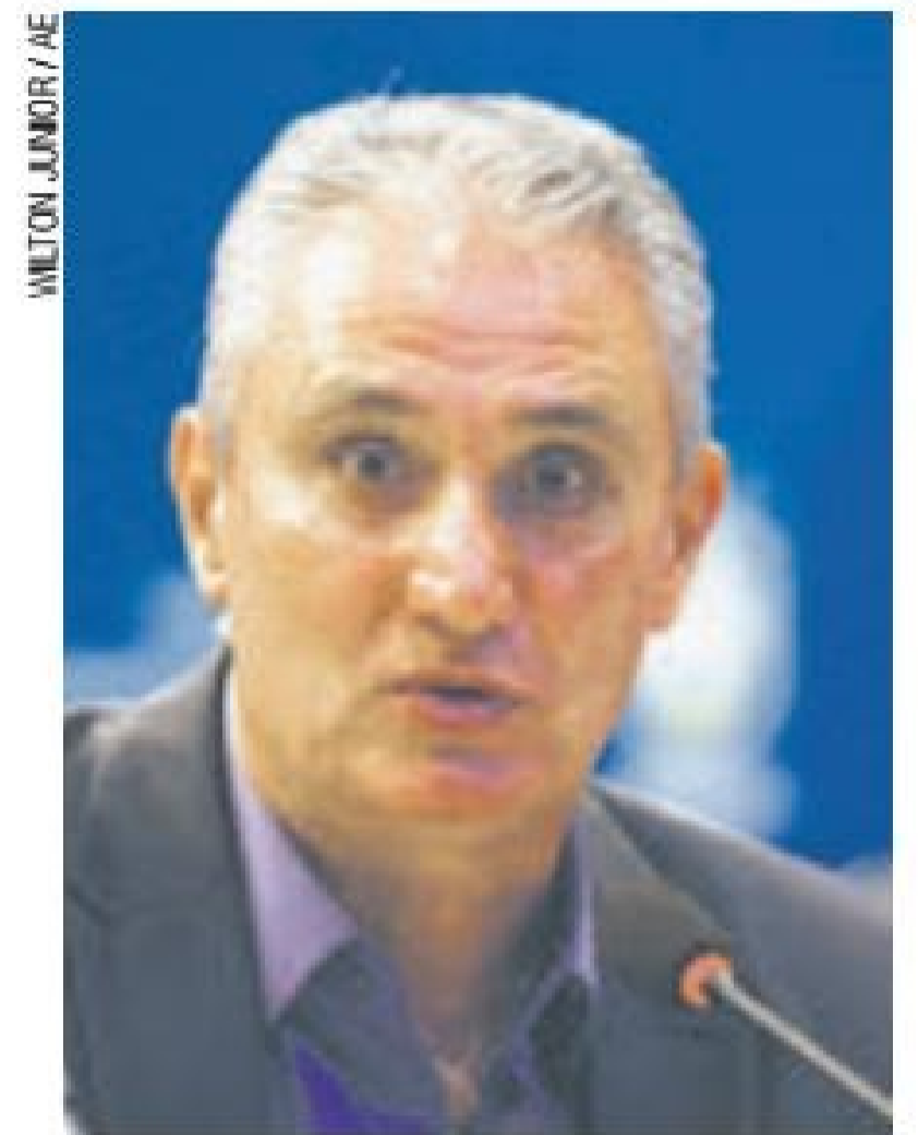
Concentração - Tite define as últimas vagas para a Copa

gação brasileira embarca para Viena, na Áustria. Após um treino na cidade, o time nacional faz um amistoso com os donos da casa, no dia 10.