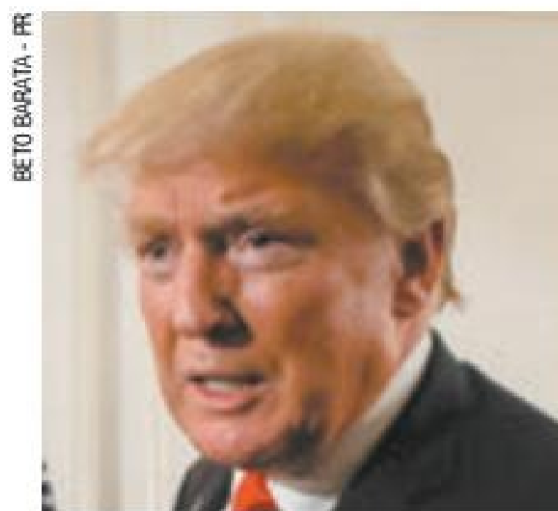
Criticado - Entidades de direitos humanos reclamam de Trump