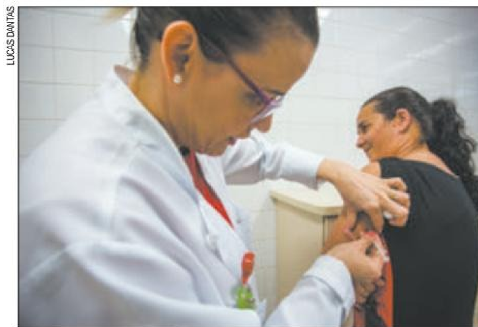
Responsabilidade - Servidores da Saúde vão prosseguir com campanha

A campanha promovida pela Secretaria Municipal de Saúde abrangia inicialmente 54 distritos. Agora, o município ampliou a aplicação para as 466 salas de vacinação dos 96 distritos da Capital. O fornecimento da vacina ocorrerá até 30 de maio. O último balanço, divulgado na sex-