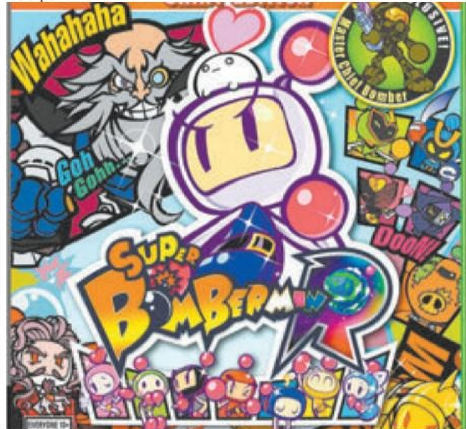
Expectativa – Konami atende fãs ao preparar versão para várias plataformas