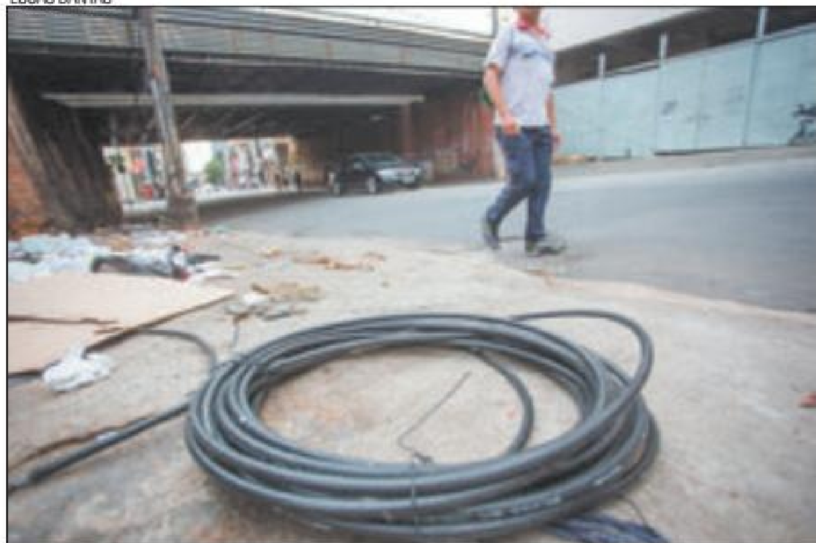
Incômodo - Fios estão jogados pelas calçadas e atrapalham pedestres