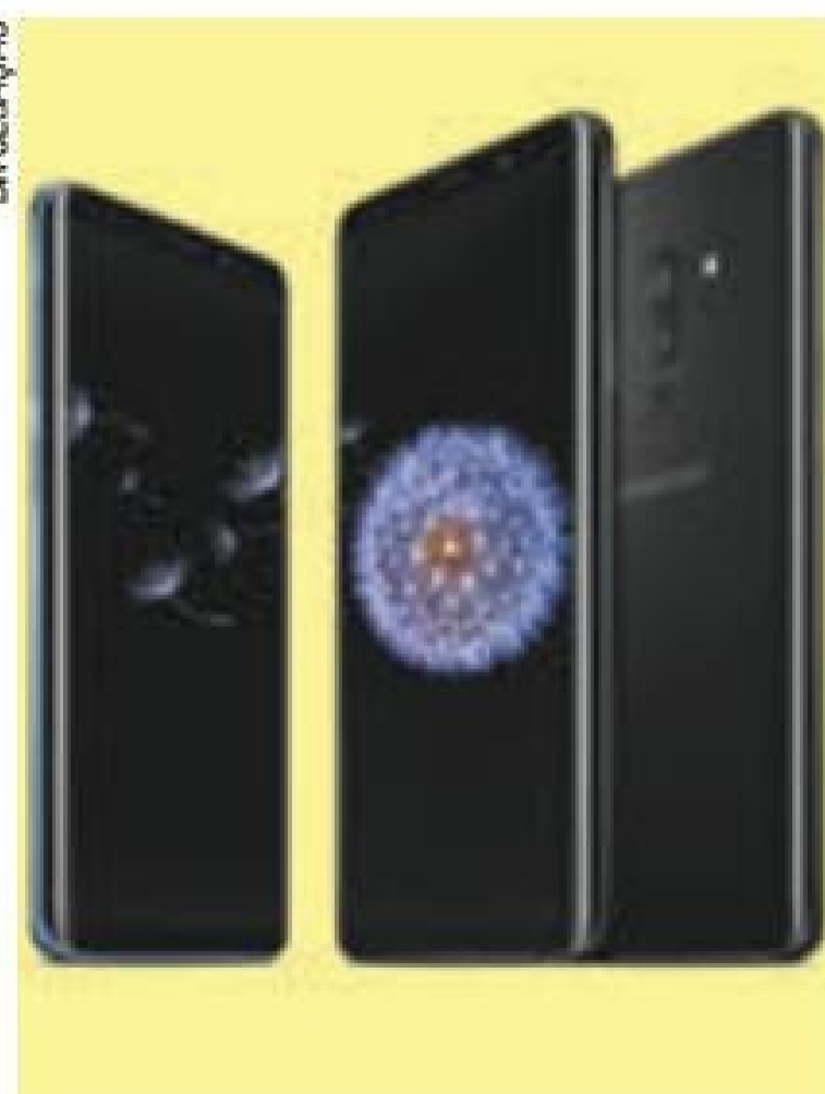
Projeto – Modelo tenta competir com as versões tops da Apple