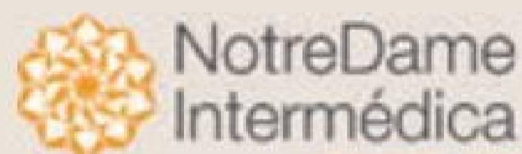
Tabela NotreDame Intermédica (Sem Copart.) - Empresarial - A partir de 2 vidas

Referência: Outubro/2017 - Taxa de Inscrição: Isenta PME