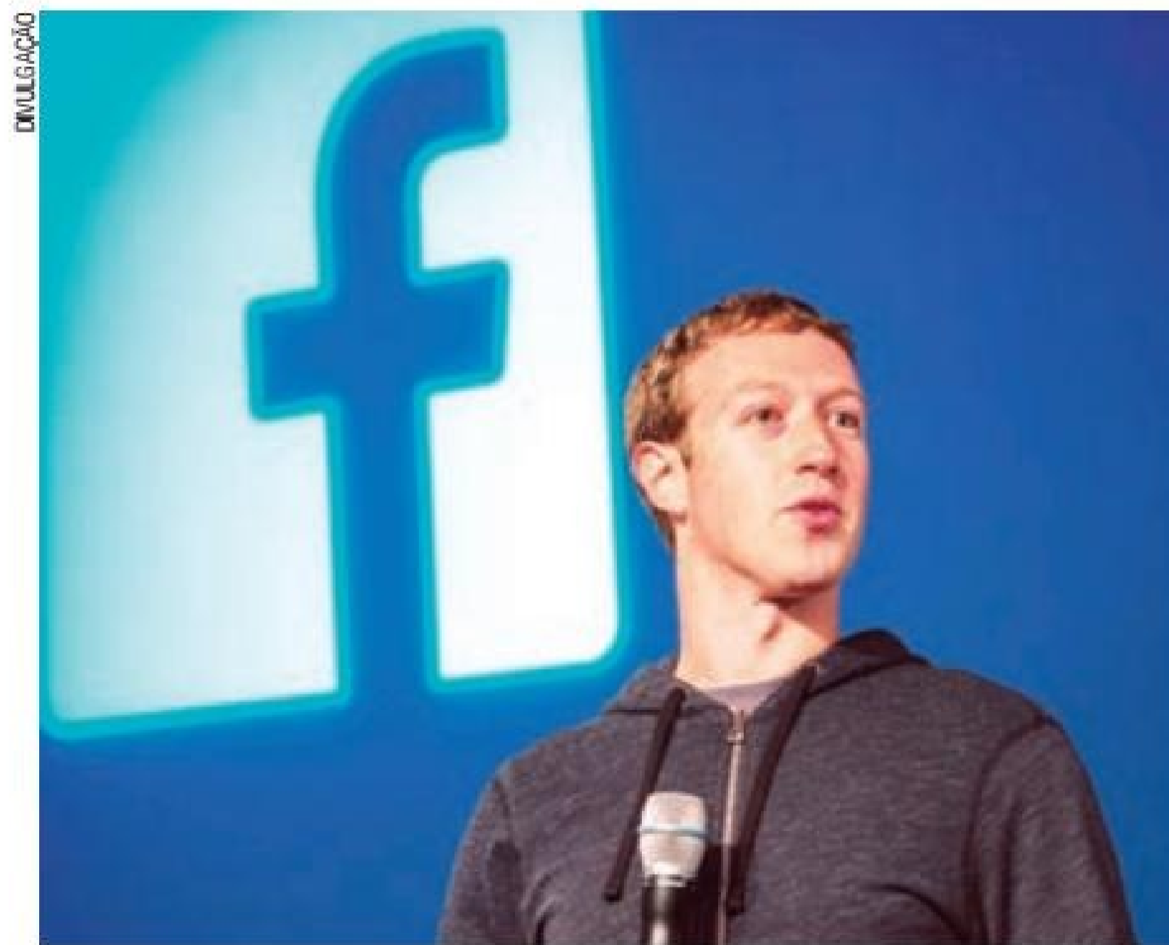
Seriedade – Zuckerberg trava batalha contra usuários de perfis falsos

Segundo avaliação da própria empresa, é possível que nove a cada 10 mil posts tenham algum conteúdo que possa violar as condutas exigidas pela companhia. O material é removido tanto por inteligência artificial quanto por supervisores da rede social que atuam para localizar