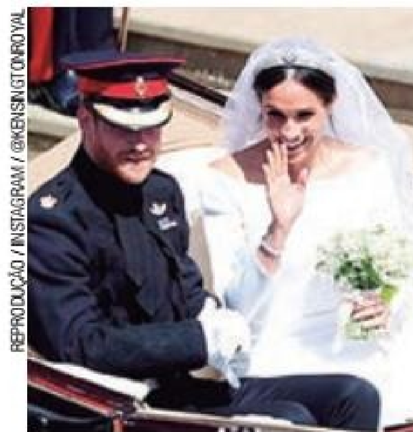
Tradição - Meghan repetiu o gesto criado por Elizabeth Bowles-Lyon

A tradição de depositar o buquê de casamento no túmulo começou em 1923, quando Elizabeth Bowles-Lyon, mãe da rainha Elizabeth II, fez o gesto antes do casamento com o futuro rei George VI. Ela quis homenagear seu irmão mais velho, Fergus, que morreu em batalha. (AE)