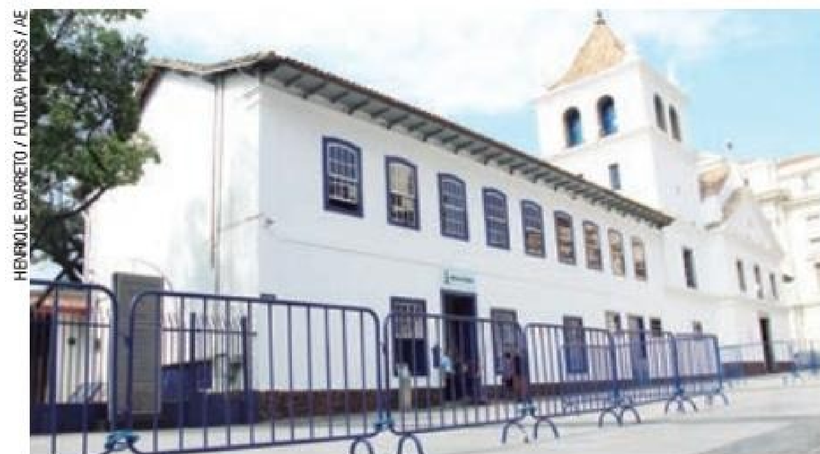
Prevenção - Grades servem para tentar inibir ação de pichadores