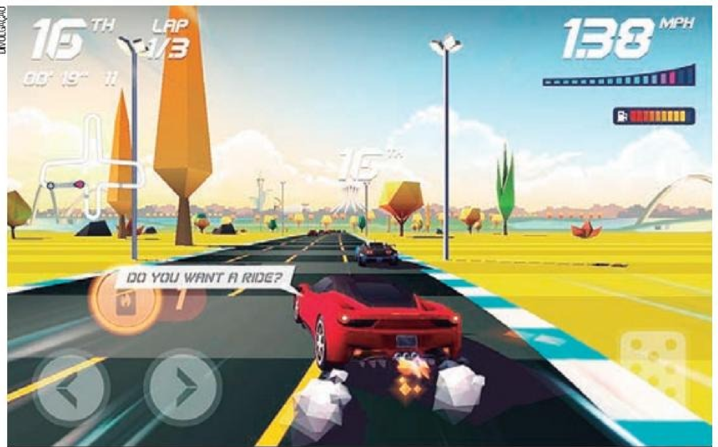
Popular – Jogo inspirado no clássico "Top Gear" custa apenas R$ 50, bem abaixo de outros do mesmo estilo