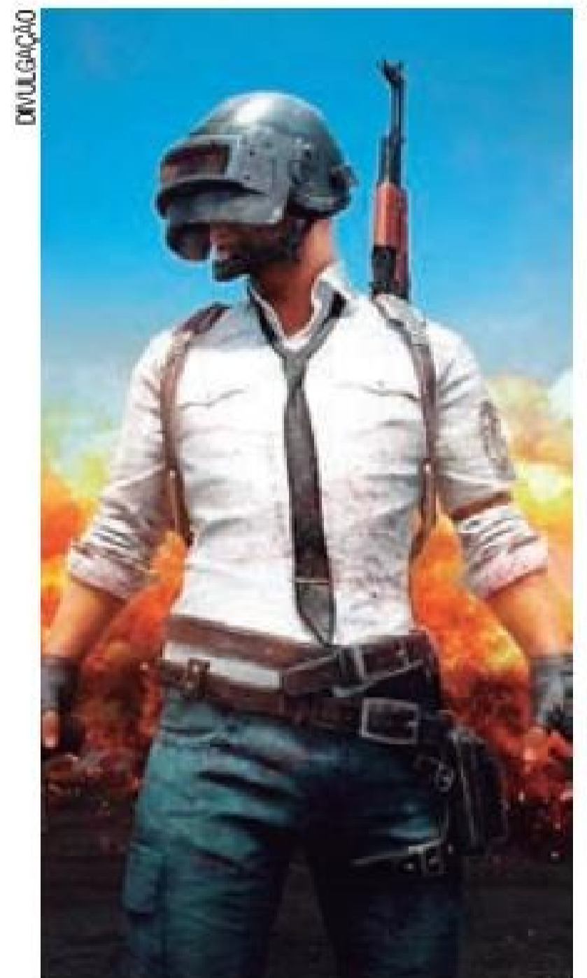
Febre – Jogo possui fãs em todo o mundo e foi lançado à Microsoft

O jogo foi lançado originalmente para os games