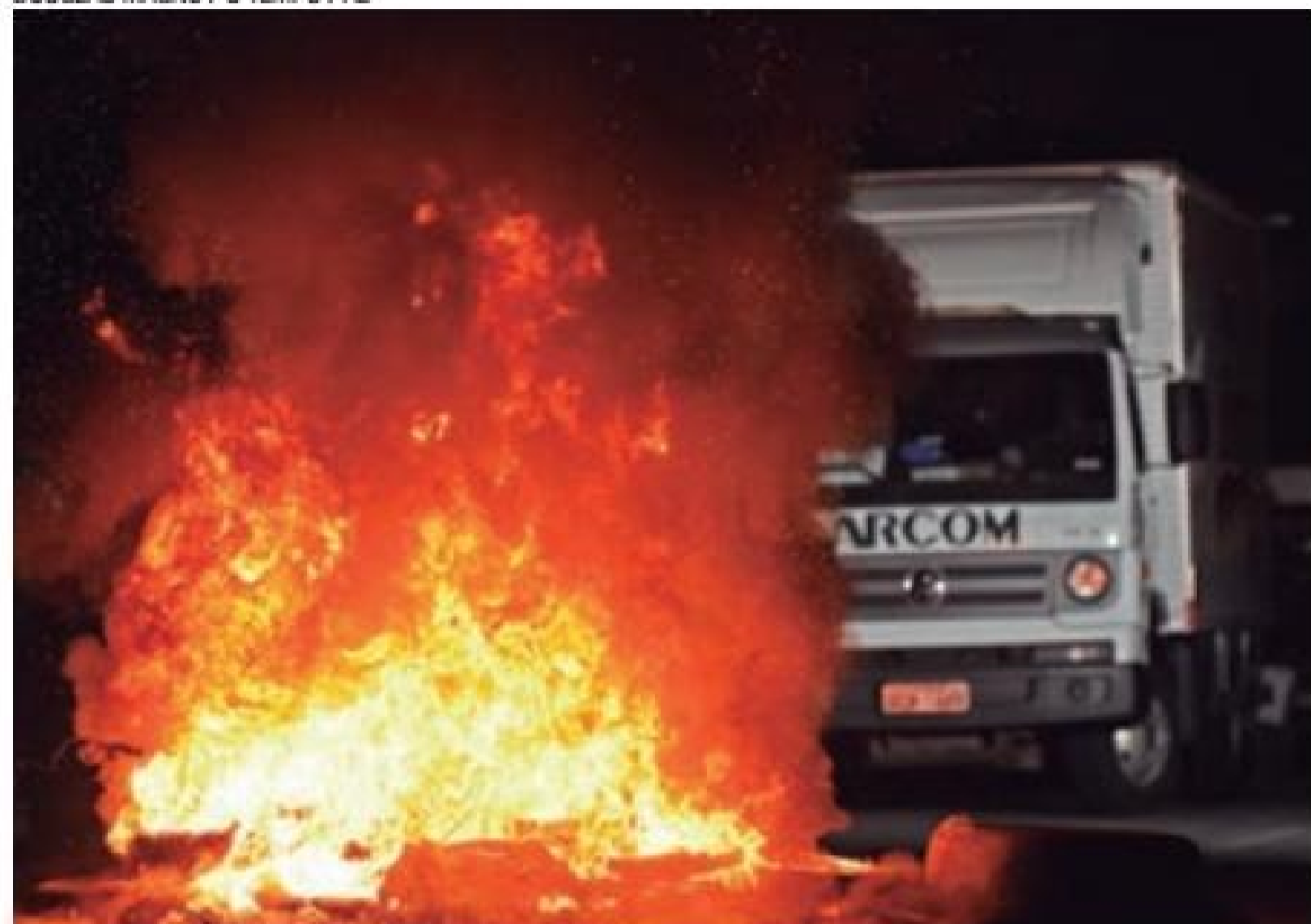
Na marra - Manifestantes atearam fogo em objetos para fechar vias