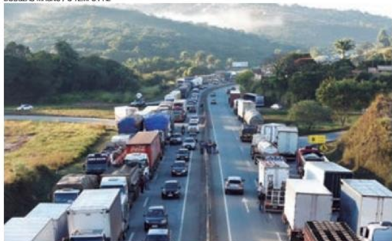
Pressão - Caminhoneiros reclamam também da cobrança de pedágio