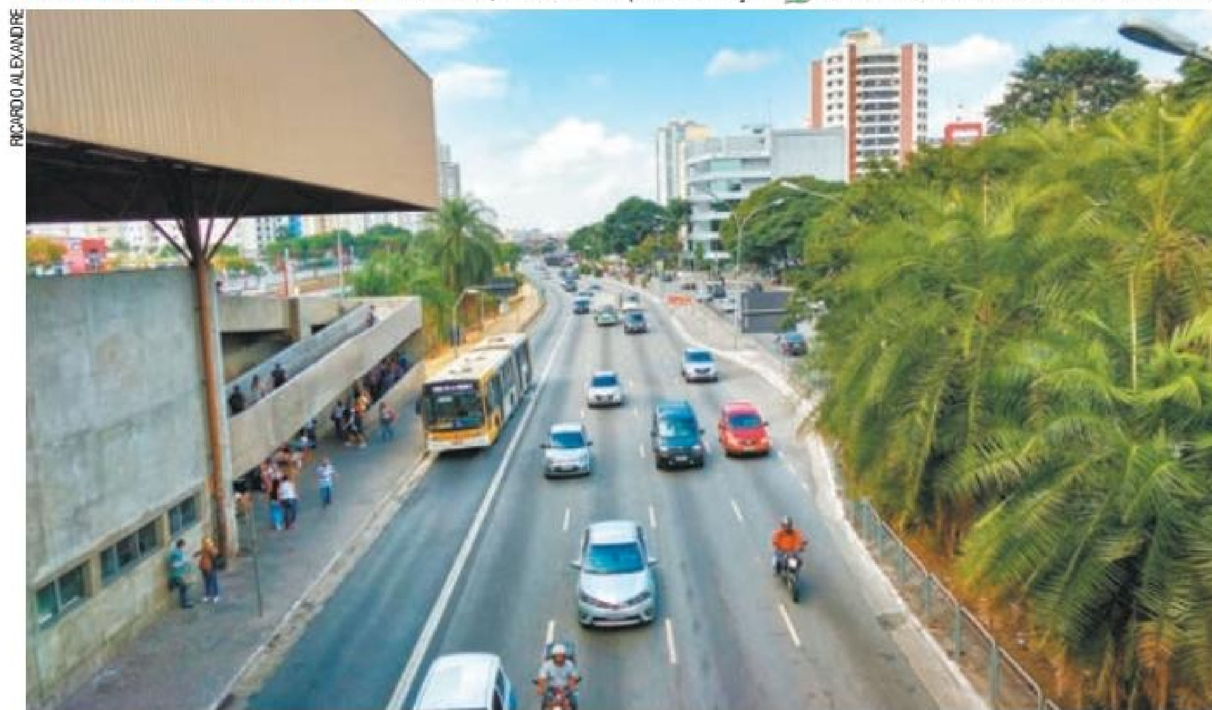
Favorável – Por volta das 13h, a Radial Leste, próximo ao Metrô Tatuapé, flui, bem diferente dos horários de pico

Caro leitor, envie sua foto para esta seção: 94021-9397 ou redacao@metronews.com.br