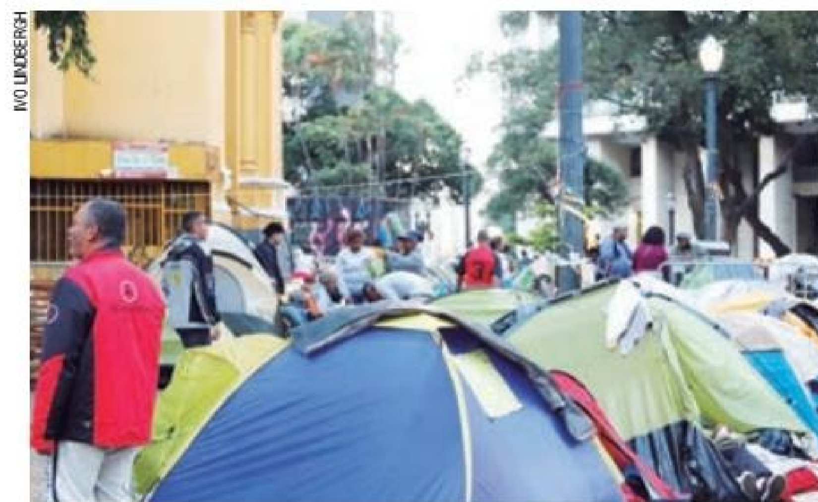
Truculência – Ocupantes alegam que cadastro da Prefeitura é uma fraude