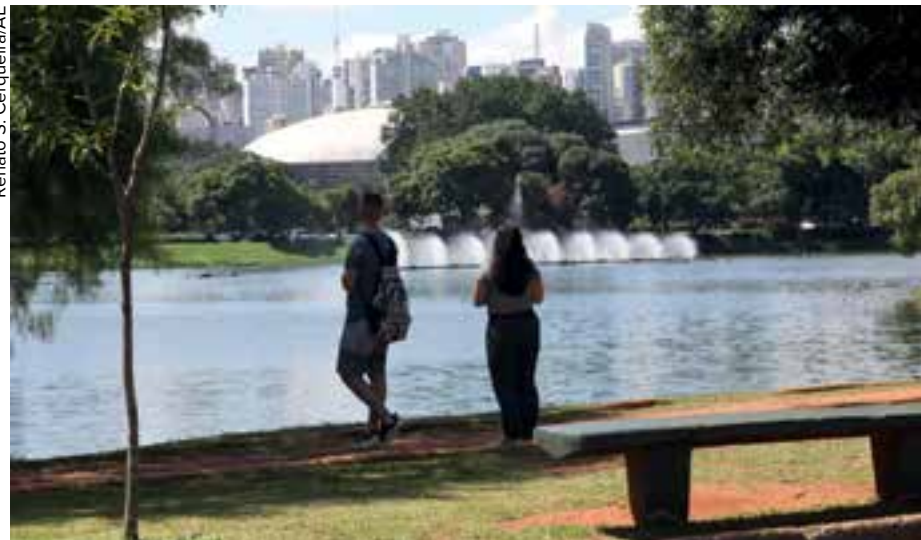
Renato S. Cerqueira/AE

Na quarta-feira, 10, segundo o CGE, a frente fria se desloca rapidamente em direção ao litoral fluminense, mas ainda deixará muitas nuvens e chuva em áreas do Estado paulista,