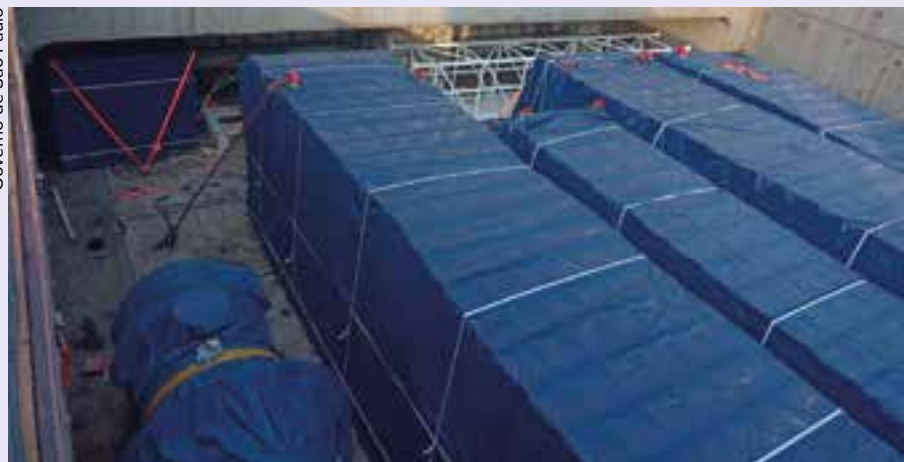
Governo de São Paulo

O Main Drive tem 7,8 metros de comprimento e 6,65 metros de largura. O deslocamento através das rodovias do Sistema Anchieta Imigrantes (SAI) e do Rodoanel será feito a uma velocidade de 5