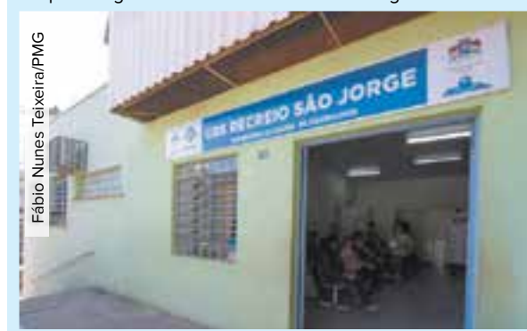
Fábio Nunes Teixeira/PMG

UBS Recreio São Jorge: estrada David Corrêa, 1766, Recreio São Jorge