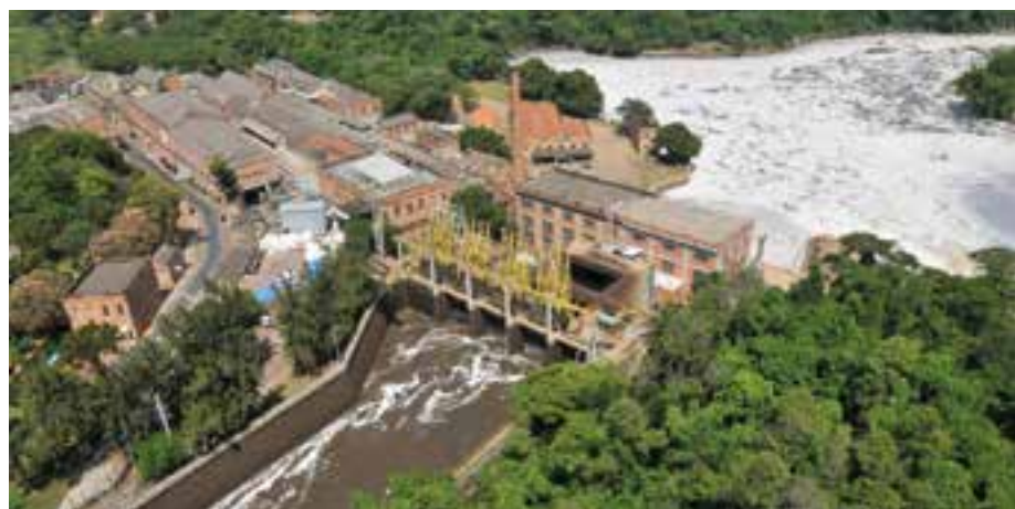
Governo de São Paulo

“Por se tratar de norma punitiva, com previsão de vultosa pena pecuniária, a questão reveste-se de balizas próprias do Direito Sancionador, não se podendo aplicar de forma indistinta penalidade como se o ato se revestisse de absoluta ilegalidade”, argumentam os advogados.