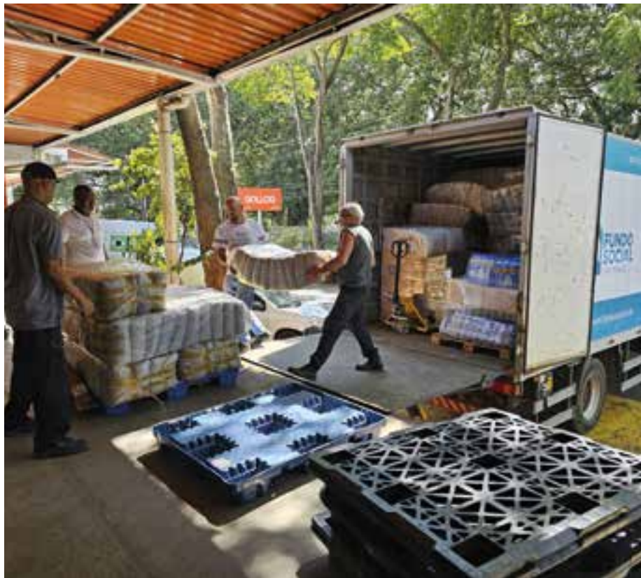
Governo de São Paulo

O Governo de SP encaminhou nessa segunda-feira (6) o primeiro lote de donativos às vítimas das fortes chuvas no Rio Grande do Sul. Mais de 13 toneladas de suprimentos essenciais como água potável, colchões e cobertores foram enviados ao estado.