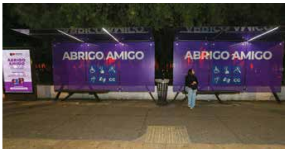
Governo de São Paulo

Essas frentes estão nos pilares da gestão e incluem novas soluções lançadas neste mês. Um dos destaques é o auxílio-aluguel no valor de R$ 500 para vítimas de violência doméstica. Houve ainda ampliação do monitoramento por tornozeleiras para agressores; o lançamento do aplicativo SP Mulher Segura que conecta a polícia de forma direta e ágil caso o agressor se aproxime; e a criação de novas salas da Delegacia da Defesa da Mulher 24 horas.