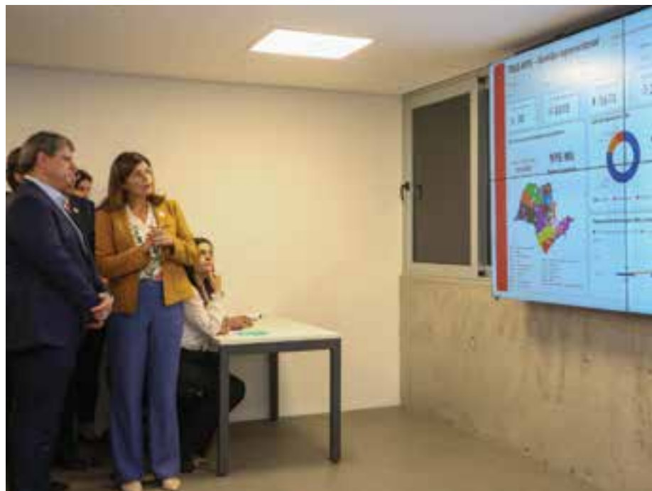
Governo de São Paulo

No caso da atenção básica, considerada a porta de entrada para o sistema de saúde, o serviço é chamado de Tele Atenção Primária em Saúde (TeleAPS). O paciente procura uma Unidade Básica de Saúde (UBS), com ou sem agendamento, e após a triagem é encaminhado para uma sala de teleatendimento para consulta com um profissional especializado em Medicina de Família e Comunidade ligado ao HC.