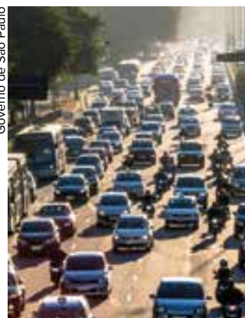
Governo de São Paulo

Para mais informações, os proprietários dos veículos podem entrar em contato com a Secretaria da Fazenda pelo canal Fale Conosco, no portal da Sefaz-SP ou nos telefones do call center 0800-0170-110 (chamadas de telefone fixo) e (11) 2930-3750 (exclusivo para chamadas de celular).